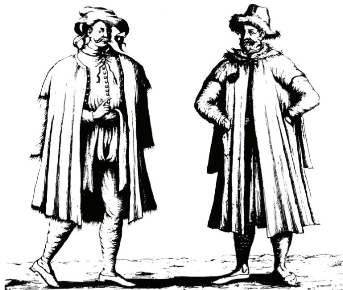
Dubrovački glasonoša i trgovac

Prvi zapisi progona prostitutki u Dubrovniku javljaju se 1456. godine. Tada je šest žena prognano iz grada zbog „nečasna načina života“. Godine 1464. udovica je osuđena na godinu dana prognanstva iz grada jer je „iskvarila mnogo mladića koji su je posjećivali“. Godine 1495. prognana je još jedna žena zbog „pokvarenog načina života“. Jedno je od pitanja koje se nameće koji su uzroci koji su naveli vlast na promjenu stava spram prostitucije. Jedan od razloga bila je moguća pojava sifilisa u 16. stoljeću te nije trebalo dugo da se ustanovi veza između širenja bolesti i promiskuitetnog seksualnog ponašanja. Drugi bi razlog bio velik utjecaj Crkve. Crkva je do tada u praksi tolerirala prostituciju, dok ju je u osnovi ipak osuđivala. Primjer je takve prakse i dubrovačko svećenstvo koje je posjećivalo prostitutke. Tijekom razdoblja reformacije Crkva je zbog svog dvostrukog morala često bila kritizirana te se zbog toga našla u prilično ugroženom položaju. Reakcija na takve kritike bila je temeljiti crkveni preustroj što se