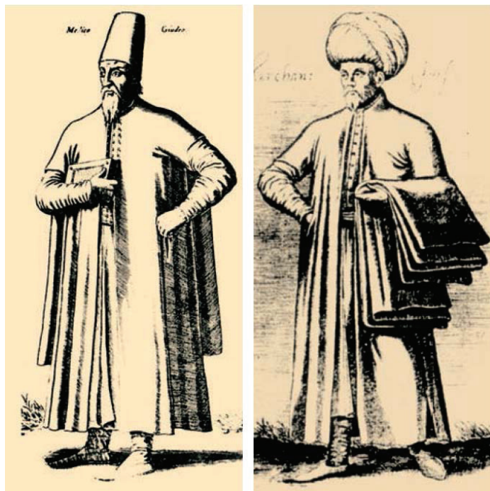
Židovski liječnik i trgovac

pobunili kada im je jedan od nadbiskupa zabranio liječenje kod Židova (Janeković Römer, 1993a: 36-37).