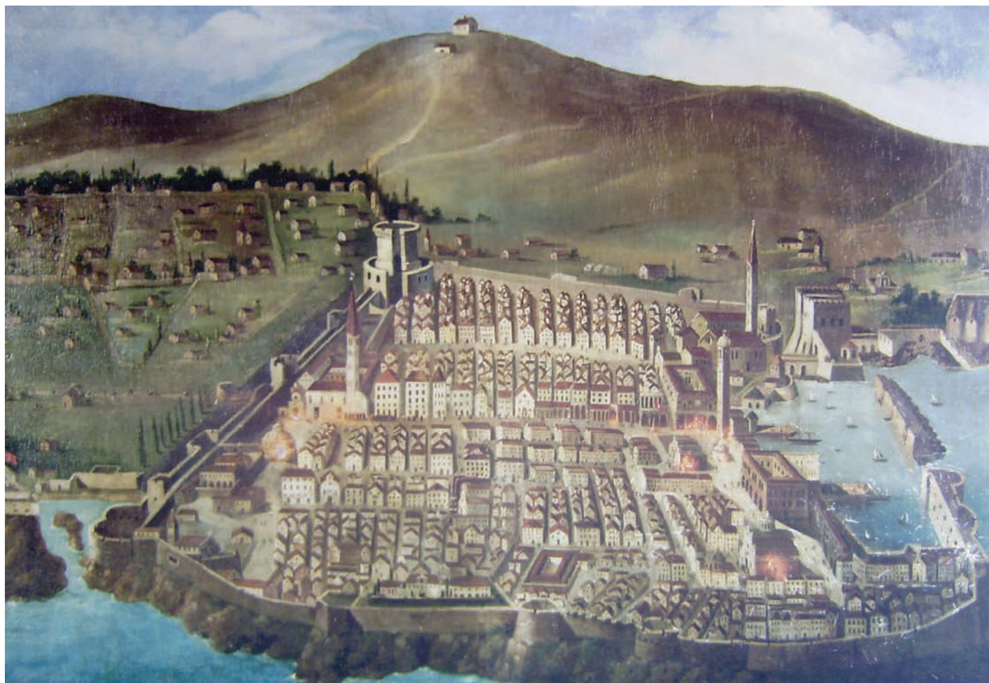
Dubrovnik prije potresa

Zdenka Janeković Römer piše kako je odnos prema strancima u Dubrovniku bio stupnjevan, od potpunog prihvatanja i integracije u društvo do odbacivanja i progona. Mnogi su stranci prije nego su bili prihvaćeni u društvu morali proći provjeru te pružiti jamstvo svoje odanosti Republici. Neprihvatanje pak nije bilo uzrokovano iracionalnim motivima, već interesima dubrovačke vlasti. Prihvaćeniji su bili oni stranci sa sličnim kulturnim, vjerskim i etničkim identitetom ili pak ako su svojom stručnošću i kapitalom bili korisni Republici. Na vrhu ljestvice prihvaćenosti bili su oni koji su nakon integracije u društvo stekli sva građanska prava. Ispod njih bili su