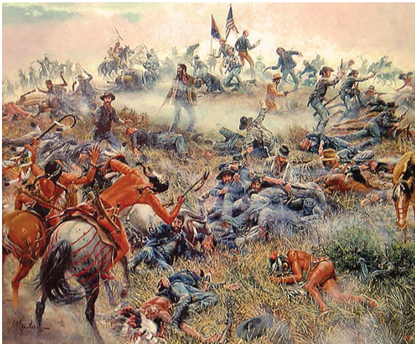
Little Big Horn

Konj 4 predvodili su okupljena indijanska plemena Lakota, Siouxa, Cheyennea, Dakota Siouxa, Arapahoa, Blackfeeta i još mnogih drugih plemena s oko 20 000 konja. U završnoj je bitci poginuo general George Armstrong Cluster na posljednjem položaju te su svladane njegove trupe sačinjene od više od 200 ljudi. Američka je konjica poražena, a pobjeda indijanskih plemena bila je prvi i zadnji pokušaj otpora jer su uslijedile ratne operacije koje su nakon pet godina uspjele otjerati sva plemena natrag u rezervate (Sesvečan, 2005: 41). Za zimskog ratnog pohoda američke vojske poglavica Bik Koji Sjedi protjeran je u Kanadu iz koje se vratio 1881. godine (Lučić, 1998: 6). Živio je u rezervatu dok mu život nije okončan u nasilnom obračunu između