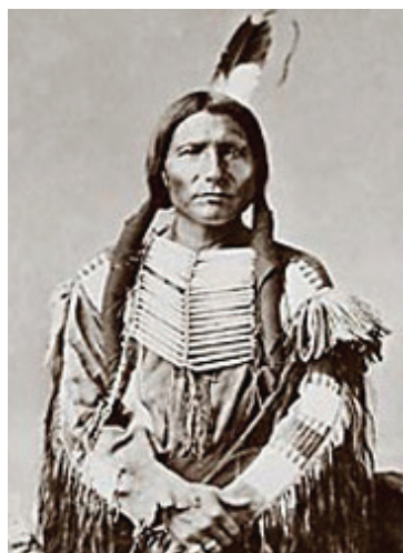
Poglavica Ludi Konj

maskote, zaštitni znakovi raznih proizvoda i tvrtki, dječje igračke ili obilježja nekih današnjih ceremonija potječu od etničke skupine Indijanaca ili se pak odnose na njih. Američki su domoroci jedina takva skupina koja još uvijek predstavlja glavni predmet i inspiraciju u takve neprihvatljive i degradirajuće svrhe (Nelson, 2001: 8). Ovakva diskriminacija može prouzrokovati