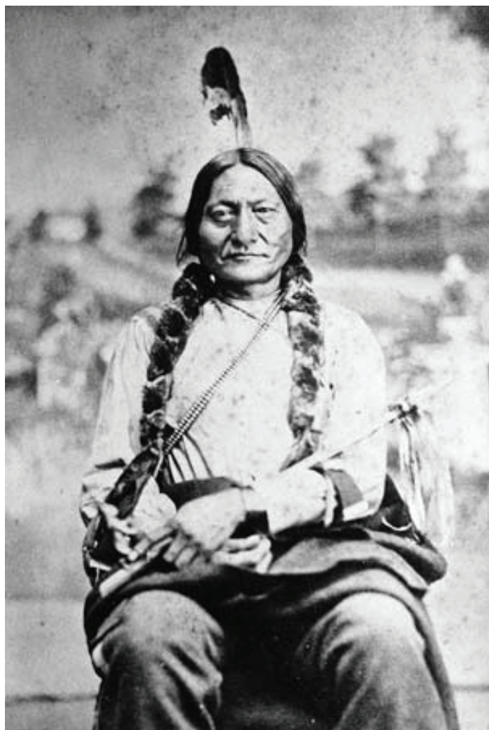
Poglavica Bik Koji Sjedi

Prema tom popisu jedna je od negativnih osobina bila štovanje običaja vlastitih predaka, što upućuje na to da se nisu htjeli odreći svoje vjere (Lips, 1959: 37). Dakle, indijanska se vjera trebala napustiti kako oni ne bi bili zauvijek izgubljeni, odnosno kako bi se uspjeli spasiti od štovanja sotone i poganstva (Eastman, 2005: 8).