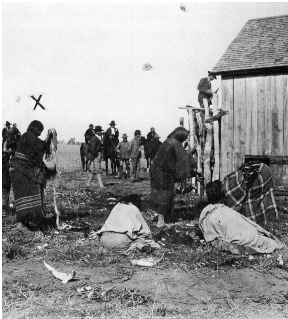
Jedan od indijanskih rezervata

teškoga rada. Bili su to misionari Sam Worcester i Elizur Butler. No nakon žalbe Vrhovnom sudu u Georgiji, u slučaju Worcester protiv države Georgije, obojica su pušteni na slobodu, jer je sud utvrdio da je Georgija prekršila zakon iz 1802. godine s Cherokeejima, a time i prava Worcestera i Butlera koji su im pomagali. Međutim, među samim Cherokeejima pojavila se skupina koja je željela sklopiti što povoljniji sporazum o preseljenju sa SAD-om i otići na zapad. Bila je to tzv. Treća strana (Remini, 2001: 48-51).