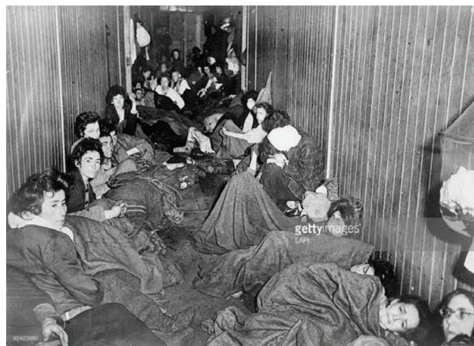
Bolnica u logoru Bergen-Belsen

Hitler je bio pod utjecajem i dvojice ekscentrika. Joseph Arthur de Gobineau (1816.-1882.) bio je francuski diplomat i pisac. Između 1853. i 1855. objavio je djelo Esej o nejednakosti ljudskih rasa u četiri sveska. U njemu ističe podjelu na bijelu, crnu i žutu rasu te nadmoć bijele nad