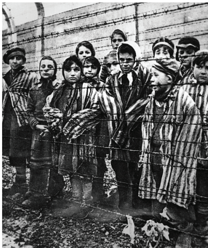
Prizor iz Auschwitza

Gradske su vlasti na tu odluku odgovorile odgovarajućim mjerama protiv Židova. Te su mjere uključivale zabranu rada za židovske profesore, glumce, pjevače... Četiri dana kasnije izdan je dekret kojim se utvrđuju kriteriji za određivanje pripadnosti arijevske rasi. Taj je dekret odredio da bilo tko "tko potječe od ijednog ne-arijskog pretka u drugom koljenu (djeda ili bake) jest nearijevac (Gilbert, 1985: 36).