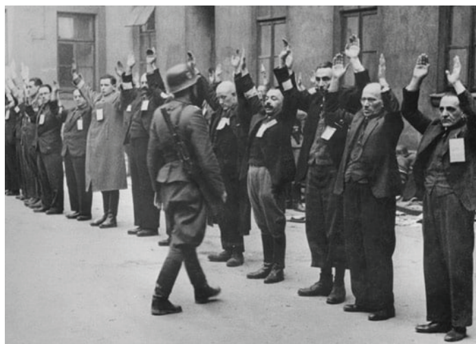
Konfiskacija židovske imovine

nesloge između klasa i između dinastičkih i političkih grupacija u njemačkom narodu, čime je ujedinjenje Njemačke bilo još više odgođeno (Shirer, 1977: 153). Bio je i antisemit - želio je da se Njemačka riješi Židova. Prema njegovim riječima, „te otrovne zlobne gnjide“, kako je nazivao Židove, treba lišiti imetka („novac, nakit, zlato i srebro“) koji su ionako „lihvarenjem oteli“. Želio je i da im se „sinagoge ili škole zapale, zgrade razgrade i razruše“ (Gilbert, 2001: 15). Ovakav destruktivan stav prema Židovima evidentan je i u Hitlerovom Trećem Reichu.