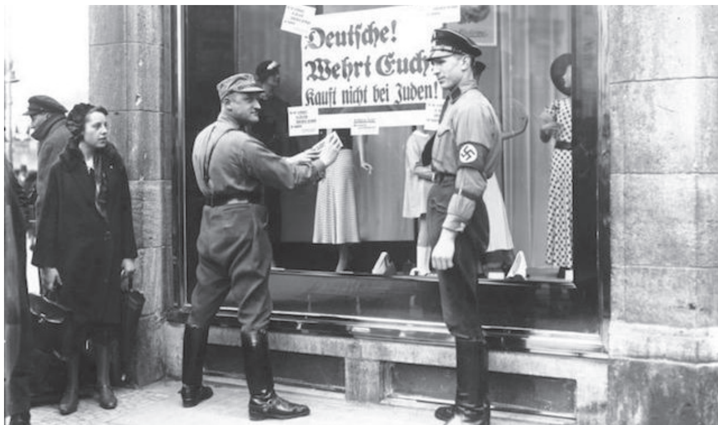
Židovska trgovina – nacisti upozoravaju kupce da ih ne štite