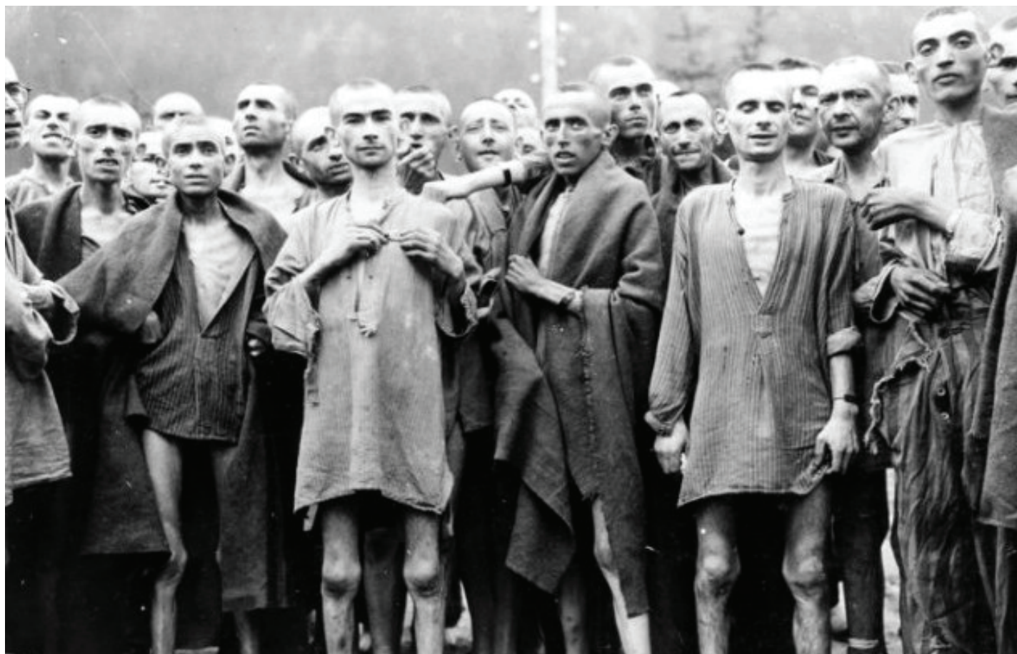
Prizor iz jednog od nacističkih logora

Dio deportiranih, najčešće žena, djece i staraca pri dolasku u logore odmah je ubijen, dok je dio privremeno ostavljen na životu kao robovska radna snaga; dio bi umro od iscrpljenosti, a ostali su kasnije također ubijeni. U prvo su vrijeme žrtve, ukoliko ih nisu strijeljali na stotine i tisuće, ubijane pomoću ispušnih plinova kamiona u vožnji: pedesetak njih bilo bi zbijeno u hermetički zatvoren prostor u koji je bila prespojena ispušna cijev te bi se tako svi ugušili. Kasnije je masovno ubijanje usavršeno: tvrtka DEGESCH – Njemačko društvo za borbu protiv štetočina – isporučivala je brzodjelujući plin ciklon-B. Pomoću ovog plina krvnici iz SS-a organizirali su “racionalno” masovno ubijanje u željezničkim vagonima ili u prostorijama kamufliranim kao kupaonice s tuševima. To je omogućavalo da se prevarene žrtve same svuku pa su im tako oduzete i odjeća i razne sitnice, koje su još posjedovali. Nakon smrti, prije bacanja u peći za spaljivanje, čupani su zlatni zubi (Shirer, 1965: 1290- 1292).