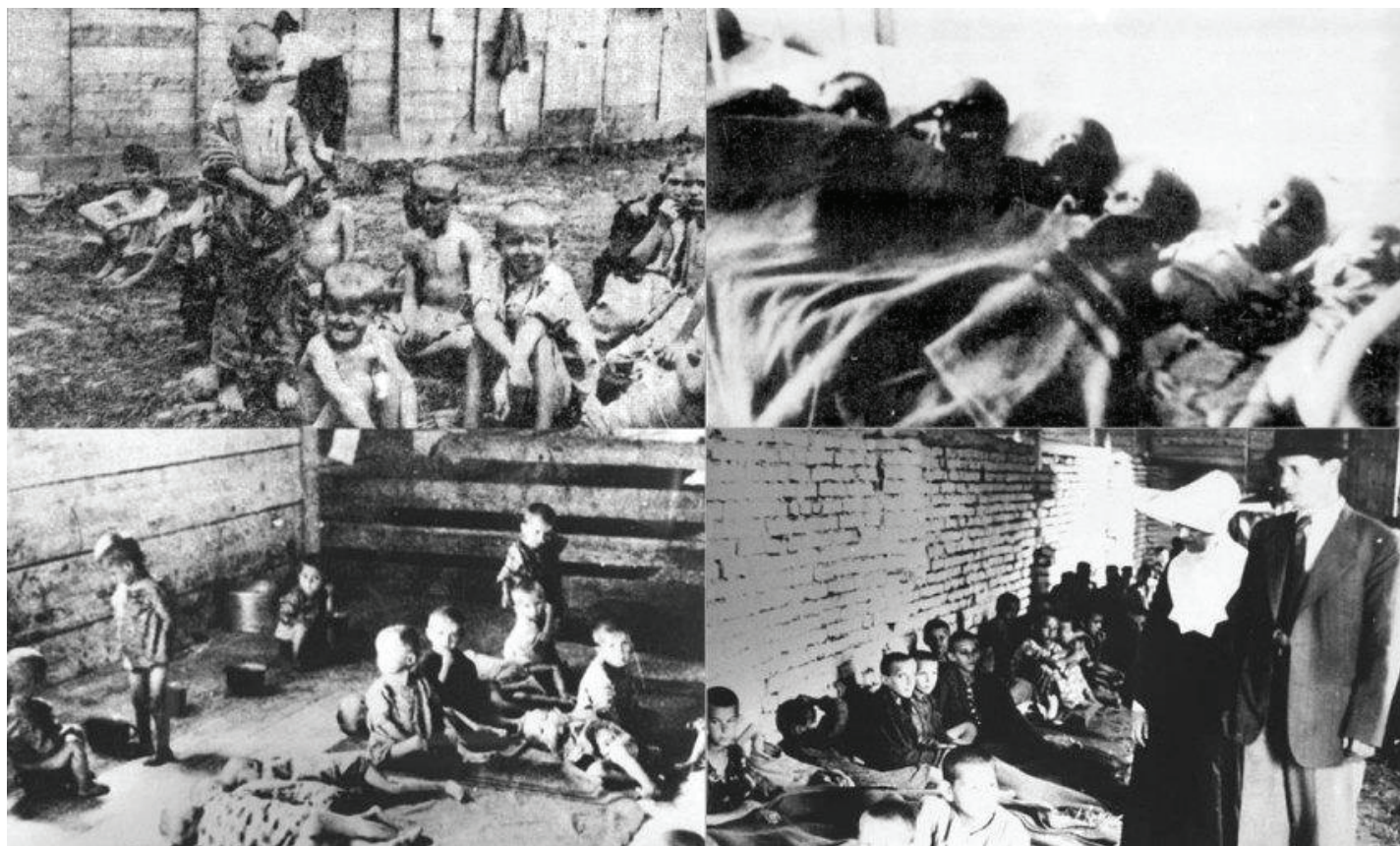
Dječji logori u Jugoslaviji nakon Drugog svjetskog rata

i 4 000 muškaraca, najveći broj u radne logore na području Donbasa 6 u Ukrajini (Suppan, 2014: 1305b). Uspostavljeno je najmanje osam transportnih linija, četiri iz Bačke i četiri iz Banata. 29. prosinca 1944. godine krenuli su vlakovi iz Sombora, Apatina i Bečkerek, 1. i 2. siječnja 1945. godine iz Kule, Odžaka, Apatina, Kikinde, Bečkerek, Pančeva i Vršca te 6. siječnja 1945. godine iz Vršca. Na putu za radne logore i unutar radnih logora stradalo je oko 2 000 Nijemaca, od čega 1 106 muškaraca i 888 žena (Senz, 1993: 86-87). Radni logori unutar Sovjetskog Saveza počeli su se raspuštati u listopadu 1949. godine, kada je većina preživjelih jugoslavenskih Nijemaca bila prebačena na područje istočne Njemačke (Suppan, 2014: 1307b). Ne postoji službena dokumentacija o tome jesu li Josip Broz Tito i Staljin na sastanku, u rujnu 1944. godine, raspravljali o deportaciji Nijemaca s područja Jugoslavije u radne logore SSSR-a. Budući da je Crvena armija imala glavnu ulogu u oslobađanju područja Srbije te zbog činjenice da su nekoliko mjeseci nakon oslobođenja deportacije bile planske i organizirane, može se pretpostaviti da je do razgovora o navedenoj temi ipak došlo (Suppan: 1304b).