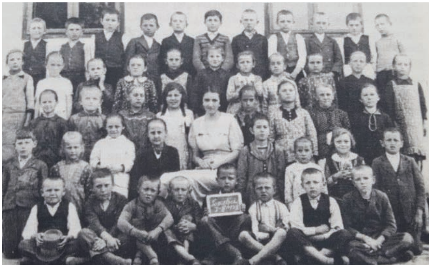
Njemački školski odjel u Viškovcima 1935./1936. godine

djeca. Tijekom devet mjeseci u logoru je boravilo oko 3 500 logoraša njemačke nacionalnosti, korištenih uglavnom za različite radove, a točan broj, kao ni broj žrtava, nije utvrđen. Procjene žrtava kreću se u rasponu od najmanje 500 do preko 2 000 osoba (Geiger, 2001: 176). Osim logora Krndija, među najvećim logorima namijenjenim Nijemcima, bio je i hrvatski logor Valpovo. Kao sabirni i radni logor, osnovan je u svibnju 1945. godine, a raspušten u svibnju 1946. Kroz logor je prošlo više od 3 000 ljudi 7 , a stradalo je najmanje 1 000 interniranih Nijemaca (Geiger, 1998: 101). Logoraši su u oba logora, ali i u većini ostalih, uglavnom umirali od bolesti, gladi i premorenosti. Za razliku od nekih logora u Vojvodini, smaknuća nisu bila masovna, zabilježeno je tek nekoliko likvidacija i to uglavnom pri pokušaju bijega (Geiger, 1997: 72). Navodi o masovnim ubojstvima u Krndiji proglašeni su netočnima, a generalno nehumani uvjeti bili su glavni krivac za velik broj žrtava (Geiger, 2001: 177). Nepovoljni uvjeti smještaja, izrazito slaba prehrana, nemogućnost održavanja optimalne osobne higijene te nedostatak lijekova i liječničke pomoći, uz težak fizički rad po nepovoljnim uvjetima, bili su pogodno tlo za razvitak raznih zaraznih bolesti. Umirali su