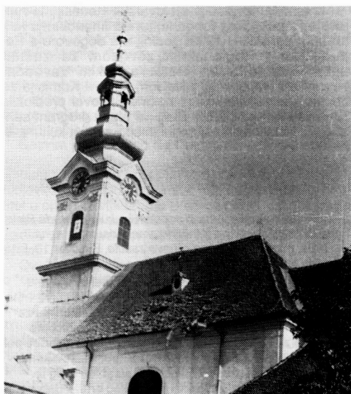
Sl. 1. - Crkva sv. Terezije

Očevid je izvršen u onoj mjeri koliko je to u takvim okolnostima bilo moguće obaviti, a najveća oštećenja su fotografirana. Ovim izvještajem obuhvaćeni su samo spomenici kulture I. kategorije u zaštićenoj povijesnoj jezgri.