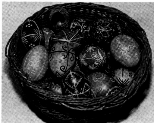
Pisanice iz etnografske zbirke GM Križevci

Drugi primjer svastike je pisanica na kojoj su dva susjedna kraja okrenut ajedan prema drugome tako da se dobiva dojam, kada se gleda zasebno lijeva i desna strana stiliziranoga srca (4, 10). Dodatni ukras čine male crtice dajući crti izgled borove grančice. Dva su posebno lijepa primjerka pisanica pisana voskom, a bojana u zelenu i smeđu boju. Ukras je izveden slaganjem vitice, te njihovim međusobnim povezivanjem i kombiniranjem sa crticama, a sve zajedno pažljivo prati oblu formu jajeta (7, 8).