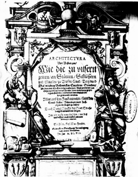
Naslovna strana Specklinove knjige "Arhitektura utvrda/kako se u naše vrijeme grade" iz 1608. godine

O važnosti Varaždina u organizaciji Slavonske granice za obranu od Turaka od četrdesetih godina 16. stoljeća se zna na temelju istraživanja arhiva štajerskih staleža. 2) Kapetan Štajerske Ivan Ungnad vlasnik varaždinske tvrđe od 1543. godine, istovremeno imenovani vrhovni kapetan granice od 1544. godine organizirao je između ostalog njenu pregradnju angažirajući graditelja Domenica de Lalia i pomoćnike.