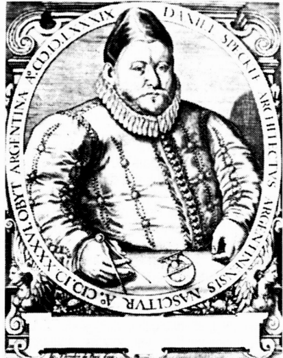
Portret Daniela Specklina iz knjige "Arhitektura utvrda" iz 1608. godine

Da je slobodni kraljevski grad Varaždin u to vrijeme već imao vlastite zidove poznato je iz sačuvane arhivske građe iz Nürnberga. 3) Neosporno je da se radi o tlocrtu koji je izradio vojni arhitekt, jer su svi dijelovi iz kojih se plan sastoji po svojoj prirodi elementi obrane i zaštite. Teritorij je grada predstavljen uobičajenom bjelinom prema pravilima vojne kartografije iz 16. i 17. stoljeća. Očito da Specklina nisu zanimali raspored ulica, gradske insule i objekti. U tlocrtu nema ni crkava koje su neosporno postajale u 16. stoljeću.