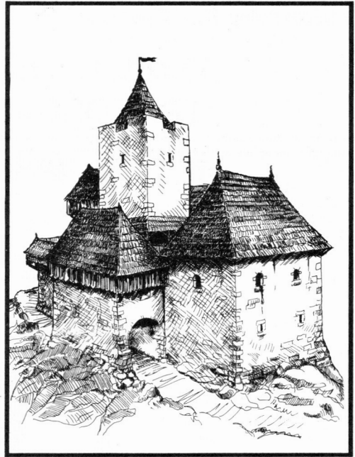
Hipotetička rekonstrukcija najranije građevinske faze razvoja Trakošćana