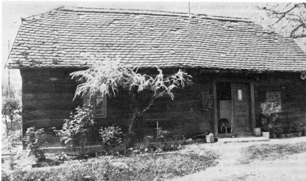
Najstarija drvena kuća u Sesvetama

Kroz Sesevsko prigorje prolazi dio prirodnih prometnica "što su kroz dugu prošlost taj dio Hrvatske (Središnje Hrvatske — op. M. Nadu) učinile težištem gospodarskog i političkog razvoja cijele Hrvatske" 9 .