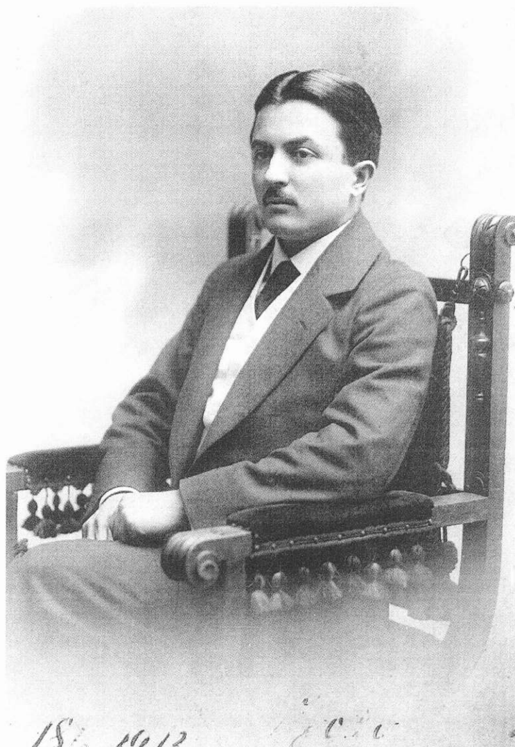
SLIKA 4. Dr. Benčević kao tek diplomirani liječnik 1913. u Pragu FIGURE 4. Dr. Benčević as a graduate doctor in Prague in 1913