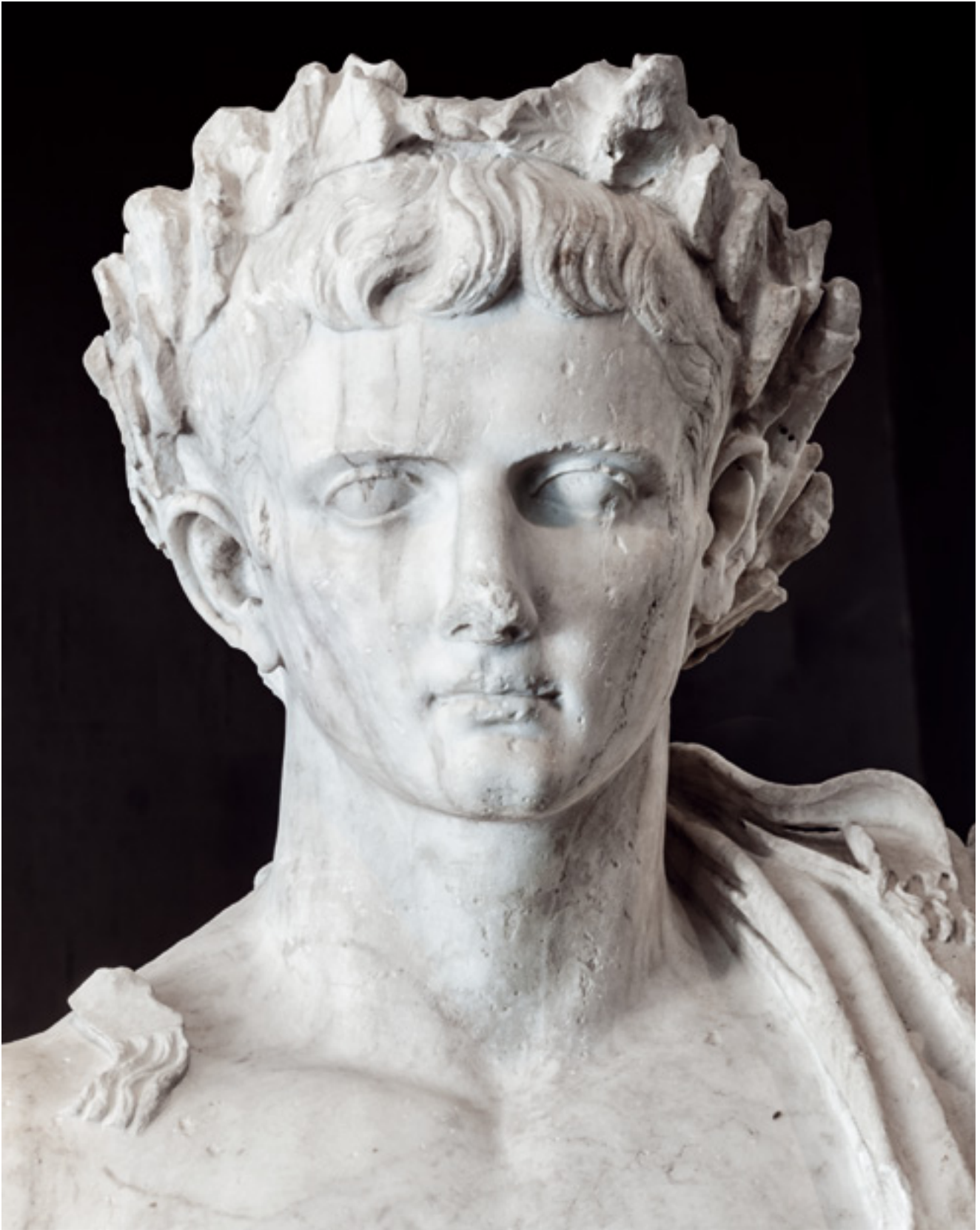
2. August prerađen iz Kaligulina portreta, detalj. Nin ( Aenona ), Arheološki muzej Zadar Detail of Augustus, recut from Caligula. From Nin (Aenona), Zadar, Archaeological Museum