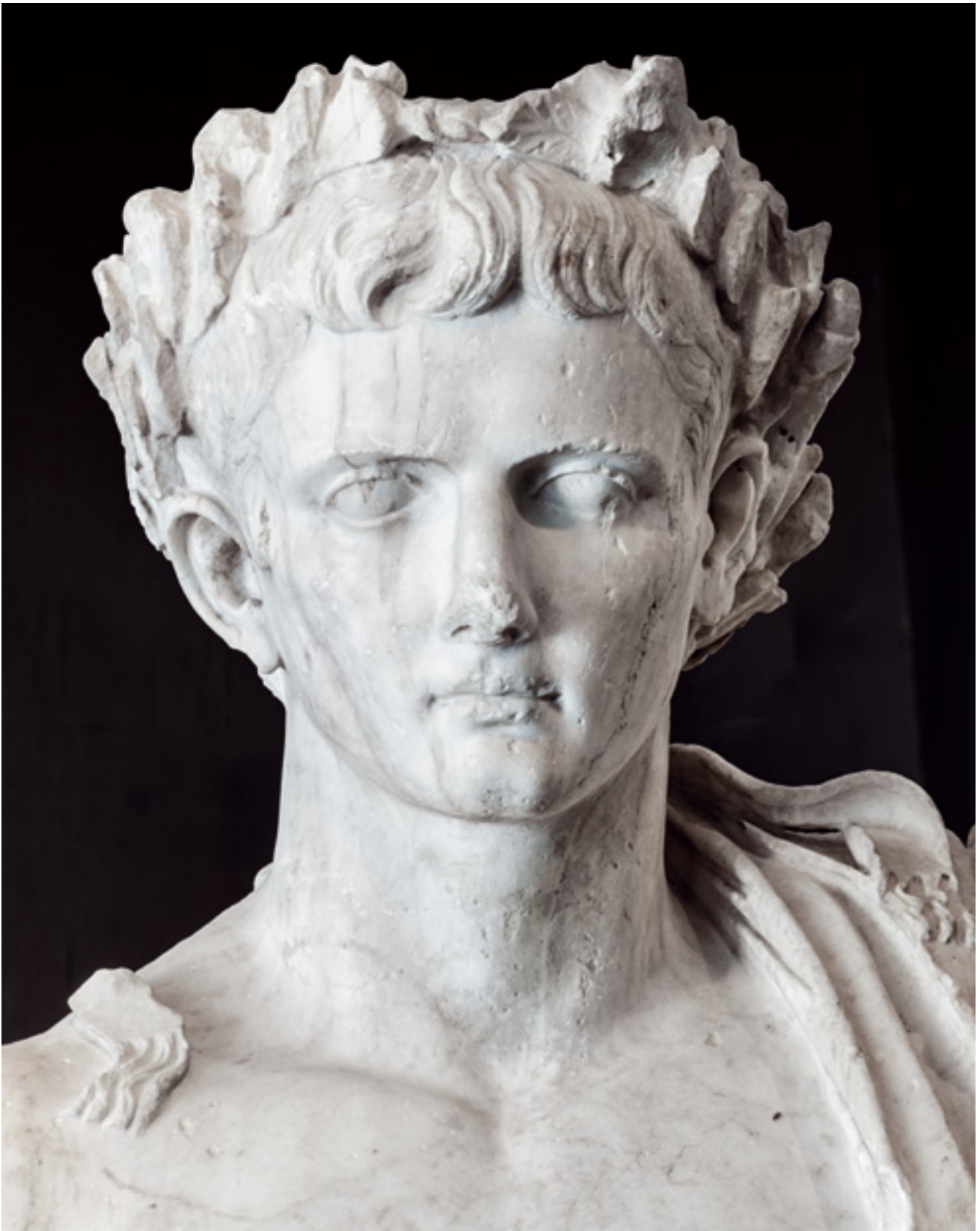
2. August prerađen iz Kaligulina portreta, detalj. Nin ( Aenona), Arheološki muzej Zadar Detail of Augustus, recut from Caligula. From Nin (Aenona), Zadar, Archaeological Museum