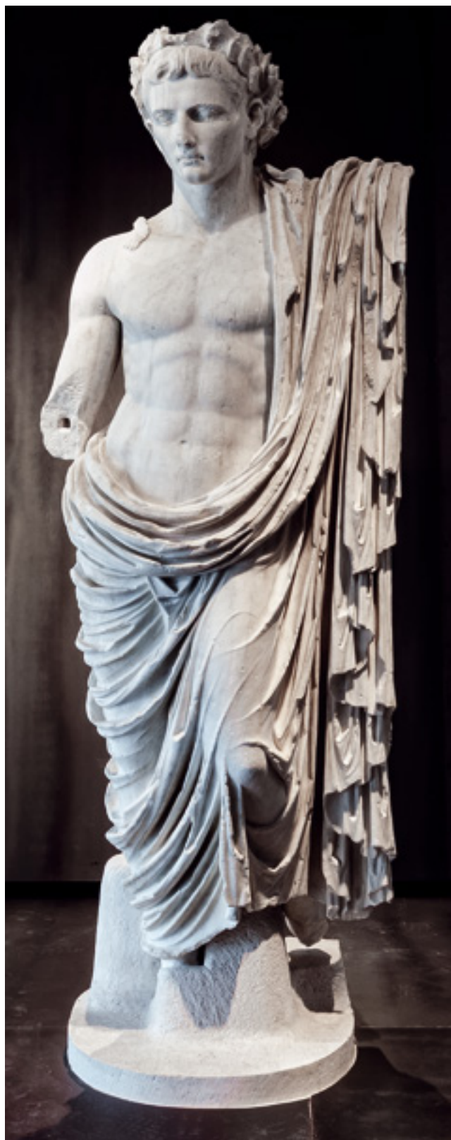
1. August preraden iz Kaligulina portreta. Nin (Aenona), Arheološki muzej Zadar

Portret Augusta iz Nina ima frizuru tipa Prima Porta, najrasprostranjeniju i nadalje najpopularniju u sačuvanom korpusu njegovih portreta (sl. 2). Višegodišnja istraživanja stranih autora poduzeta u cilju što egzaktnije izrade tipologije Augustovih portreta, temeljena na korištenju i uvažavanju antičkih povijesnih izvora i impozantnom sistematiziranom kiparskom ostavštinom, rezultirala su brojnim tipologijama . Ranoj fazi pripada ona Brendelova iz 1931. godine koji razlikuje četiri tipa (A, B, C i D). 14 Suvremenu klasifikaciju dopunjenu novim atribuiranim portretnim primjerima donosi P. Zanker, te ih kategorizira kao: I. tip (Octavianstypus), II. tip (Haupttypus ili Prima Porta) i III. tip (Nebentypus). 15 Sistematizaciju Augustovih portreta izrađuje i U. Hausmann, s posebnim naglaskom na kategoriju najučestalijeg tipa Prima Porta. 16 Metodološkim i analitičkim pristupom sveukupnog sačuvanog (ali niti pri-