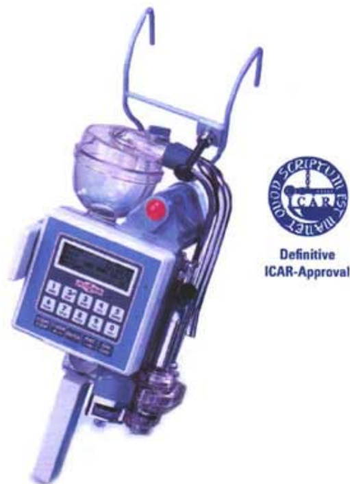
Slika 1: Lacto-Corder

četiri godine. Cilj ovog rada je bio upoznati stručnu i znanstvenu javnost o ovom uređaju, njegovim mogućnostima, prednostima, nedostacima, kao i mogućim korisnicima.