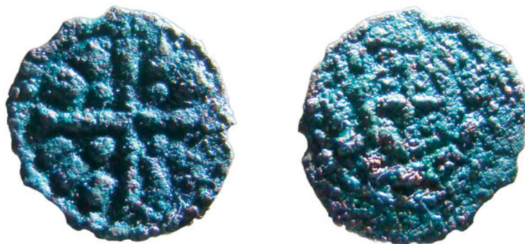
SLIKA 2. Nalaz Kolomanova denara s gradske plaže Kolovare u Zadru, 2012.

(1 + 5) komada i da dvojica navedenih aktera priče tvrde „da takvog novca“ ima još 2000 komada. Danas je ta činjenica o velikoj ostavi s oko 2000 komada novca od kojih svi pripadaju Kolomanu dobila smisao više puta publicirane znanstvene činjenice, no čini se ipak da je nesigurna i na klimavim dokazima. Tim više što te ostave danas nema, kao što je nestala i te 1878. godine. U Muzeju hrvatskih arheoloških spomenika ili Arheološkom muzeju u Splitu danas bi se trebalo nalaziti 6 komada iz te ostave. Oni doista, po Bullettinu , 1879., i pripadaju Kolomanu, kako se čini iz teksta, jer se navodi da su u odličnom stanju. Godine 1879. još 5 komada tog novca iz navedene ostave Muzeju je darovao Doimo Alachevich, službenik u Okružnoj upravi benkovačkog političkog Kotara. 11 Nažalost, i ovdje su točan kontekst i čitav opis nalaza i dalje ostali nepoznati i nedorečeni. A nepoznata je i neka duža korespondencija