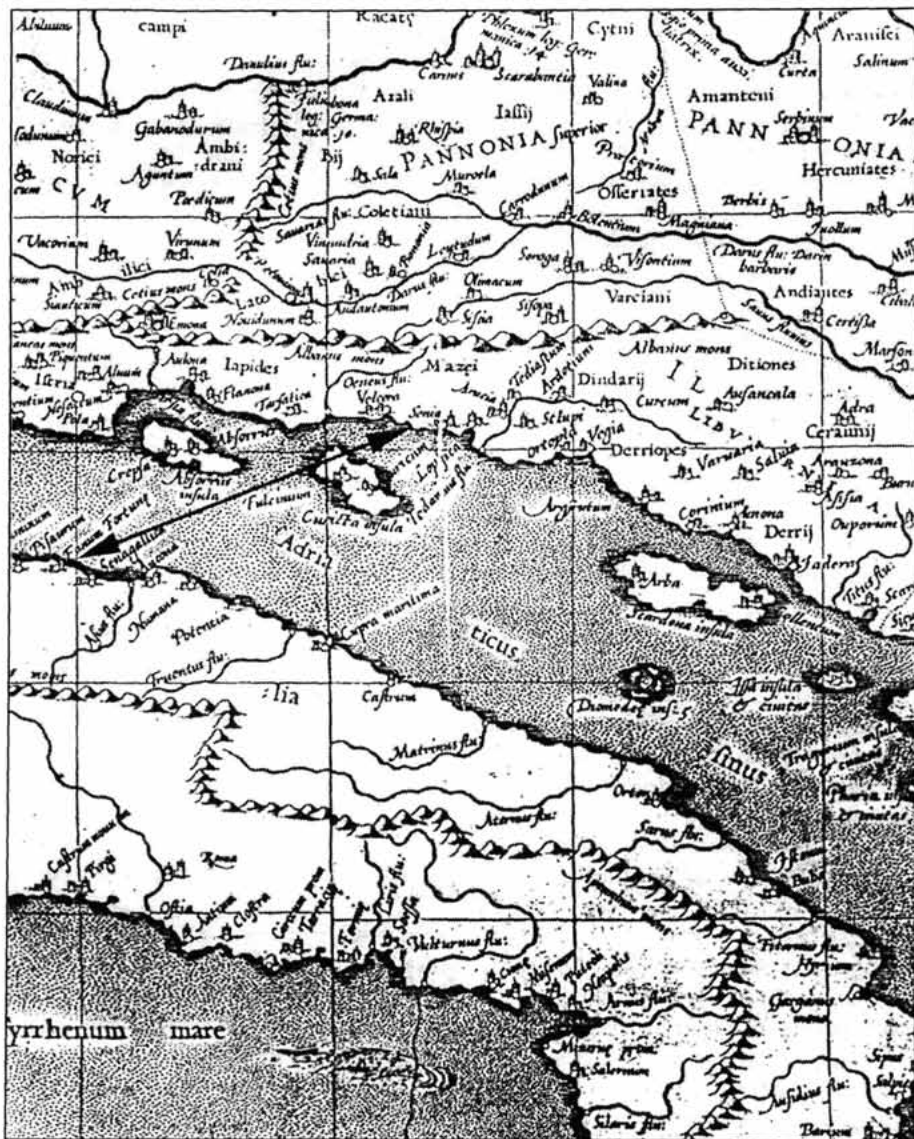
Sl. 1. Isječak iz Pete karte Europe Klaudija Ptolomeja, Amsterdam 1730. 12

Romagne, koje mu treba za kućnu upotrebu." Na vino koje plemić dovozi radi trgovine, bio je dužan platiti porez kao i ostali građani Senja. L. MARGETIĆ, 1985-87, 19-100.