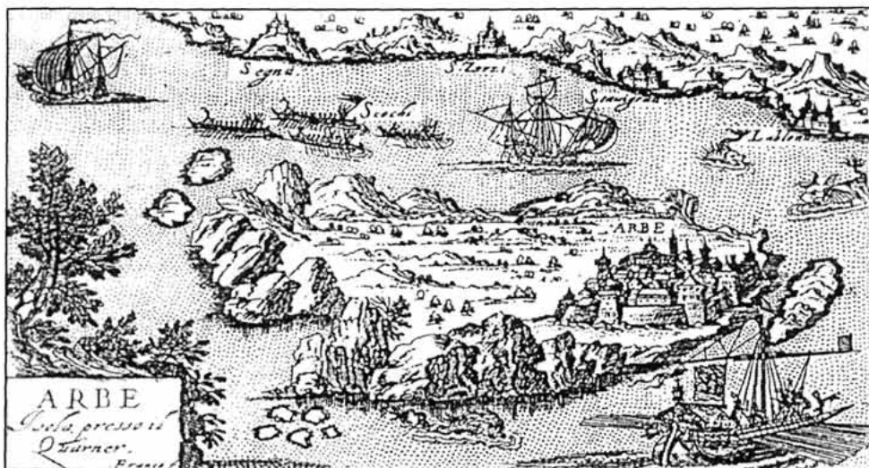
Sl. 5. Rapsko-podgorsko primorje na karti Giuseppa Rosaccija iz 1606.