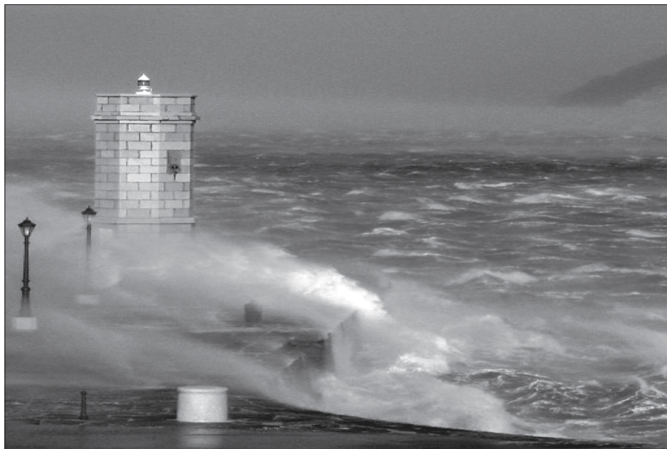
Sl. 1. Bura na Đigi, Iz promidžbenog materijala Udruga Senj 21 , 2010. godina

stigmatizacija ili pishodinamski rečeno, internaliziranja reda i poretka nametnutih odozgor. Zaboravlja se da se i sami članovi stigmatiziranih populacija (recimo pacijenata Republike Hrvatske) dijele na one kojima je dopušteno kategorizirati i ne biti kategoriziran (službenici zdravstvenog sustava i superiornije od toga) i njihove pacijente koji su kategorizirani interno nametnutim kriterijima. Francuski sociolog Pierre Bourdieu razvija svoju tezu o hegemonijalnom simboličnom nasilju upozoravajući kako ni jedna dominacija nije održiva bez ove internalizacije, gdje potčinjeni pojedinci potčinjenih naroda, grupa i zajednica internalizirane simbole dominacije prevađaju u stanja normaliziranih trajanja 18 , pa tako dominirani i sami koriste kategoriziranje dominantora jer se cijeli proces odvija ispod razine posvještanja. 19 Tako činjenica o nekom kraju, poput Podgorja i Senja, koja govori o specifičnosti njegovih ljudi usred vrlo specifičnih okolišnih uvjeta samo je dio priče podčinjavanja nevidljivog trajanja. Cijeli postkolonijalni turizam u zemljama