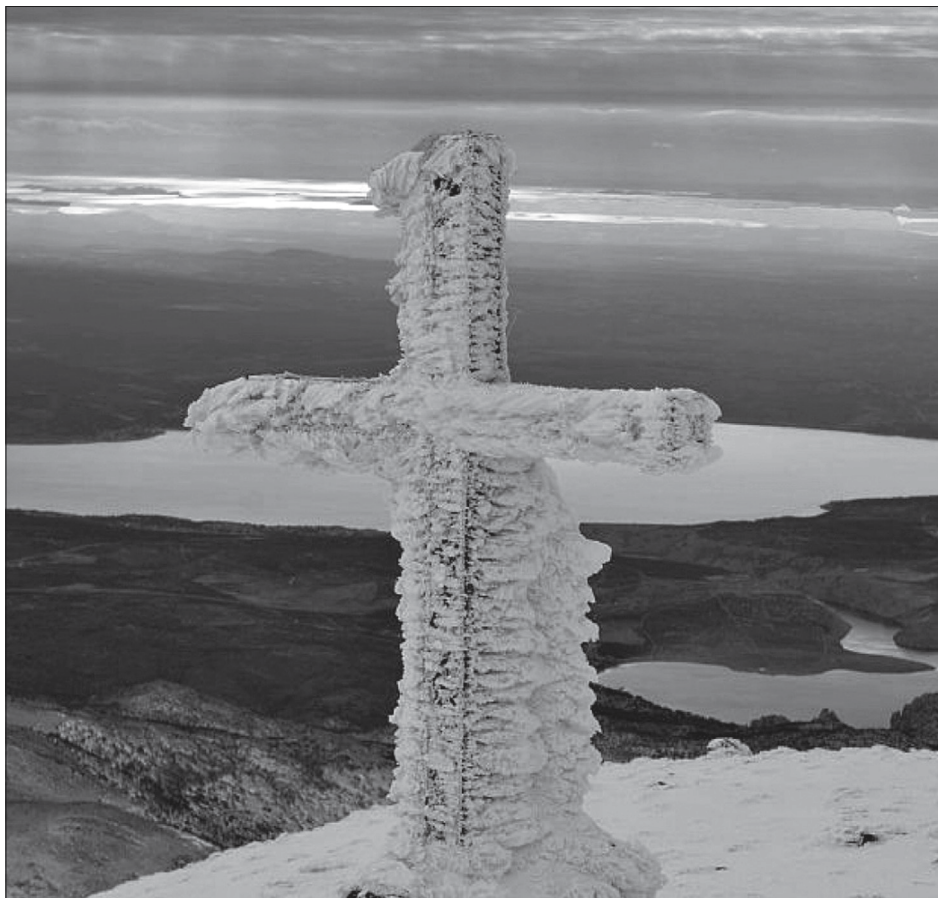
Sl. 3. Sv. brdo, 1751 metar visoki vrh s kojeg pogled puca na Ravne kotare i zadarski arhipelag. Križ okovan ledom najbolji je svjedok onog što se gore događa – niskih temperature, snijega i bure koji stvaraju uvjete slične onima na Himalaji, 23. 1. 2013. godine

postala isključivo etska kategorija. Vile ustuknuše i zamijeniše ih zaigrani trolovi instrumentaliziranja i potkradanja sveopćih duhovnobioloških resursa. Duhovne obnove izjednačiše se kultovskim pohodima revitalizacija kroz nepce, vid i ugodu. Stoga, sasvim obrnuto proporcionalno s današnjim beznađem, arhetipski obodreno, zaključiti je da iako je revitalizacija Hrvatske nesaglediva, zasigurno će to postati ukoliko krene s Velebita – gdje je udaljenost