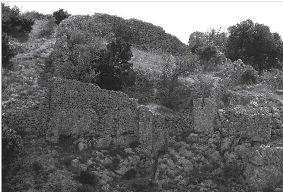
Sl. 2. Sačuvani objekt s kontraforima na Gradini u Donjoj Prizni