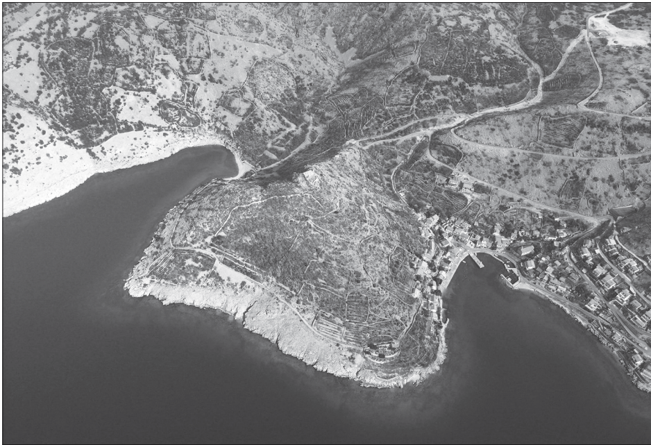
Sl. 1. Gradina Golubić iznad Starigrada Senjskog, foto: Vedrana Glavaš