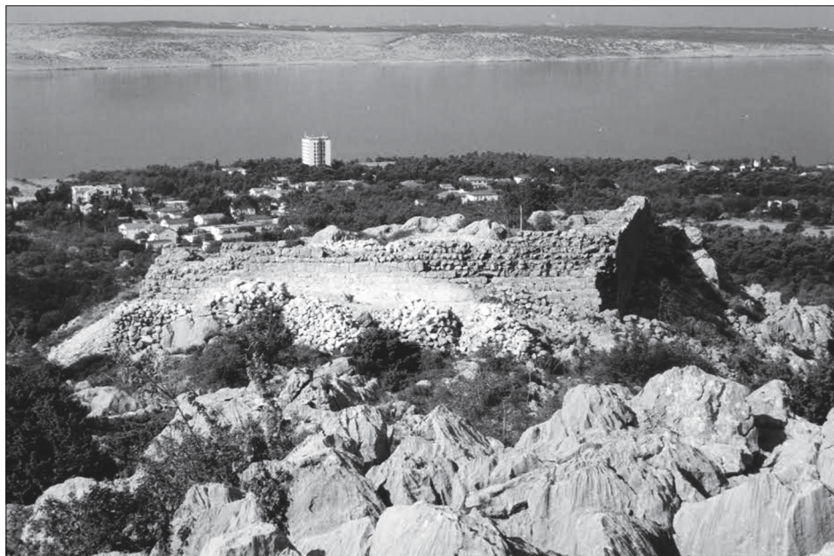
Sl. 4. Utvrda Paklarić iznad Starigrad Paklenice, foto: Franjo Nedved

Na položaju Kulina, tik uz more i u moru, na rtu (nasuprot Vinjerca), odnosno između Starigrada i Selina nalazi se Večka kula, danas poprilično dobro sačuvana. Vjerojatno je iz konca 15. i početka 16. stoljeća i pripada nizu mletačkih utvrda koje su podignute radi pregleda plovidbe i obrane od Turaka. Valjkasta kula je na kopnu, dok je njezin četvrtasti dio koji se nalazi s južne strane, većim dijelom u moru.