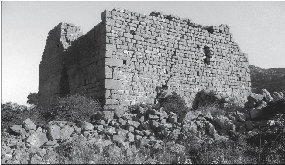
Sl. 3. Utvrda na Drvišici

ranog bizantskog vojnog graditeljstva duž Jadrana. 15 Kastrum se dobro vidi s morske strane prigodom plovidbe Velebitskim kanalom kao i sa sjeverne obale otoka Paga, gdje se javlja još jedan ranobizantski kastrum u uvali Sutojašnica. 16 Ovaj kastrum nalazi se na najjužem dijelu Podgorskog kanala te je zajedno sa suprotnim na otoku Pagu, osiguravao kontrolu plovnog puta u ovom dijelu Tarsatičke Liburnije. 17