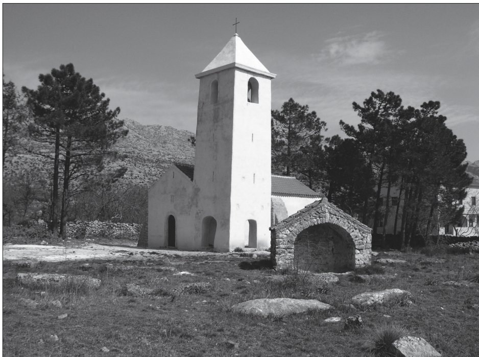
Sl. 5. Crkva sv. Petra u Starigrad Paklenici

Treba spomenuti i romaničku crkvu sv. Jurja koja se smjestila u sredini rimskog Argirunta, u mjesnom groblju. Crkva ima neobičan, više gotički šiljasti luk i svod apside. 62