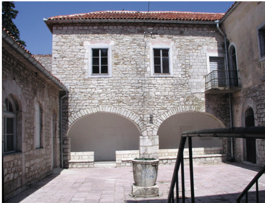
SLIKA 9. Novi mletački lazaret u Meljinama, Herceg-Novi, jedno od unutrašnjih dvorišta, prije radova