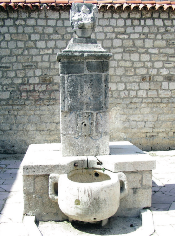
SLIKA 10. Novi mletački lazaret u Meljinama, Herceg-Novi, detalj česme u dvorištu, prije radova