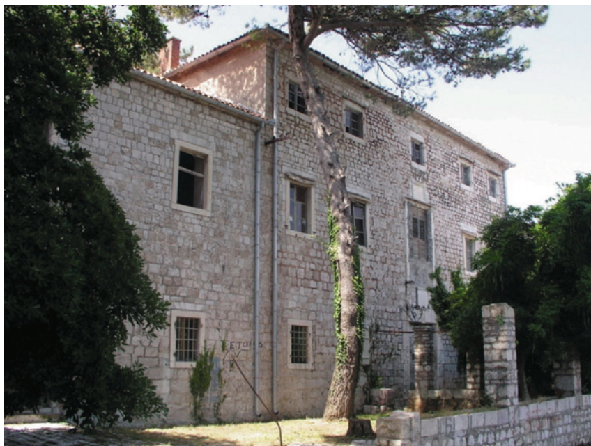
SLIKA 8. Novi mletački lazaret u Meljinama, Herceg-Novi, glavna fasada, prije radova