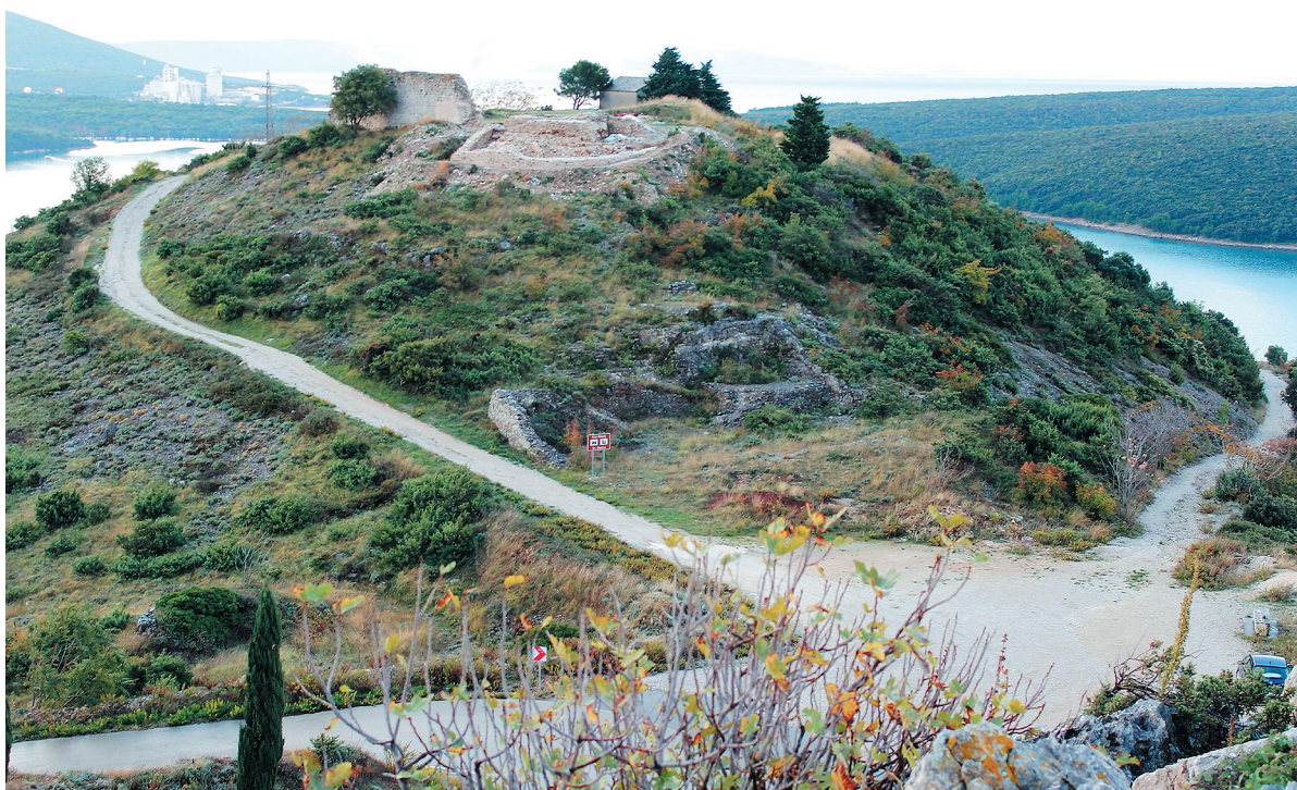
SLIKA 3. Pogled na Stari Rakalj s ostacima srednjovjekovnog kaštela i crkvu sv. Agnije – Agneze (foto R. Matijašić, listopad 2016.)