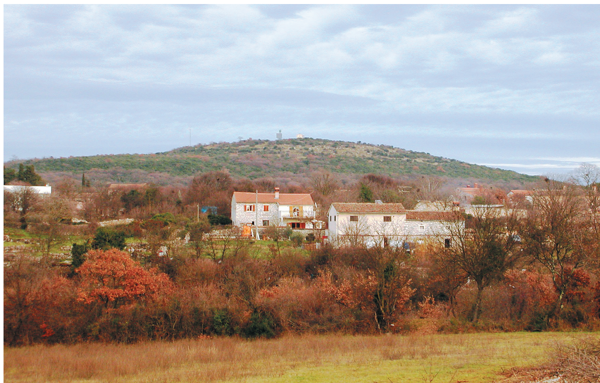
SLIKA 4. Sv. Mihovil kraj Bala