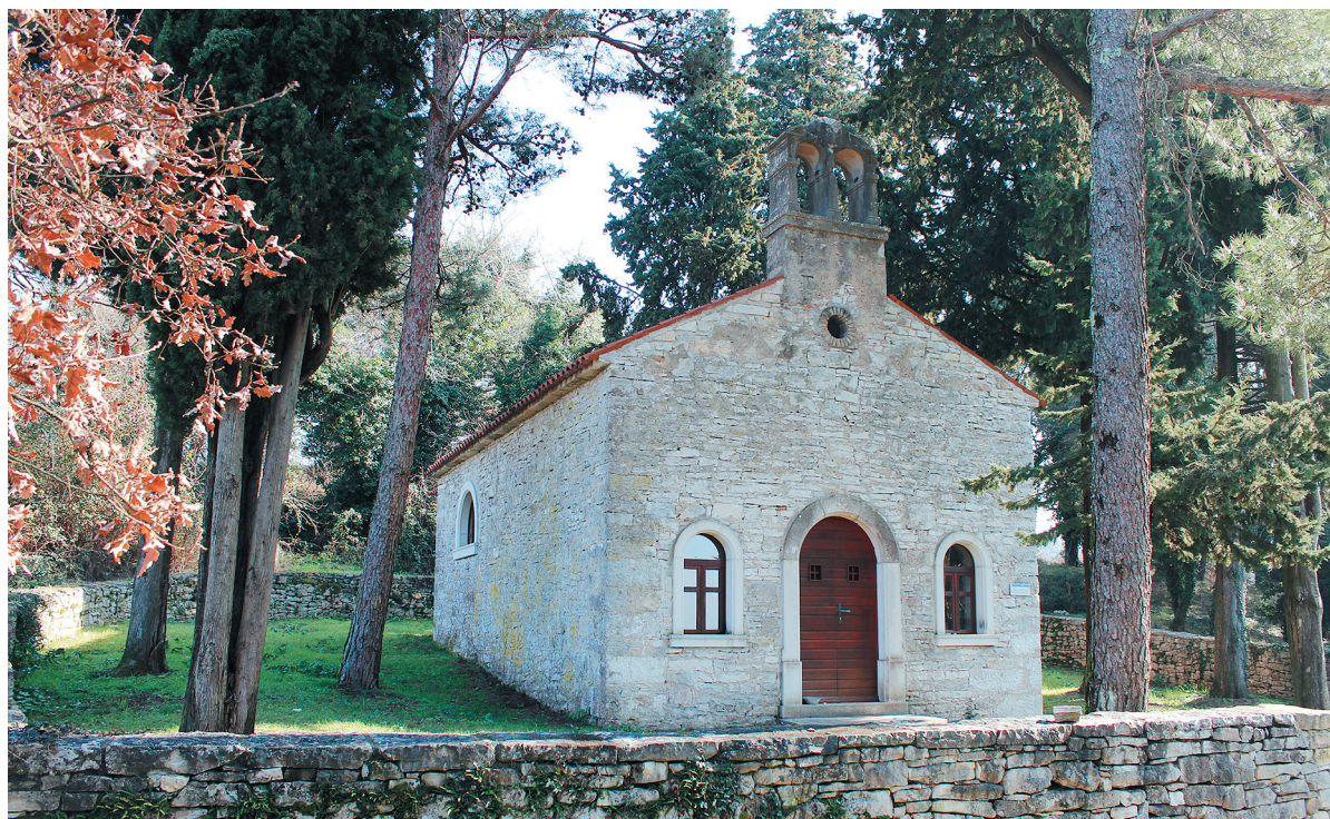
SLIKA 2. Crkva sv. Martina na položaju gradine u Tarskoj vali (foto R. Matijašić, veljača 2017.)