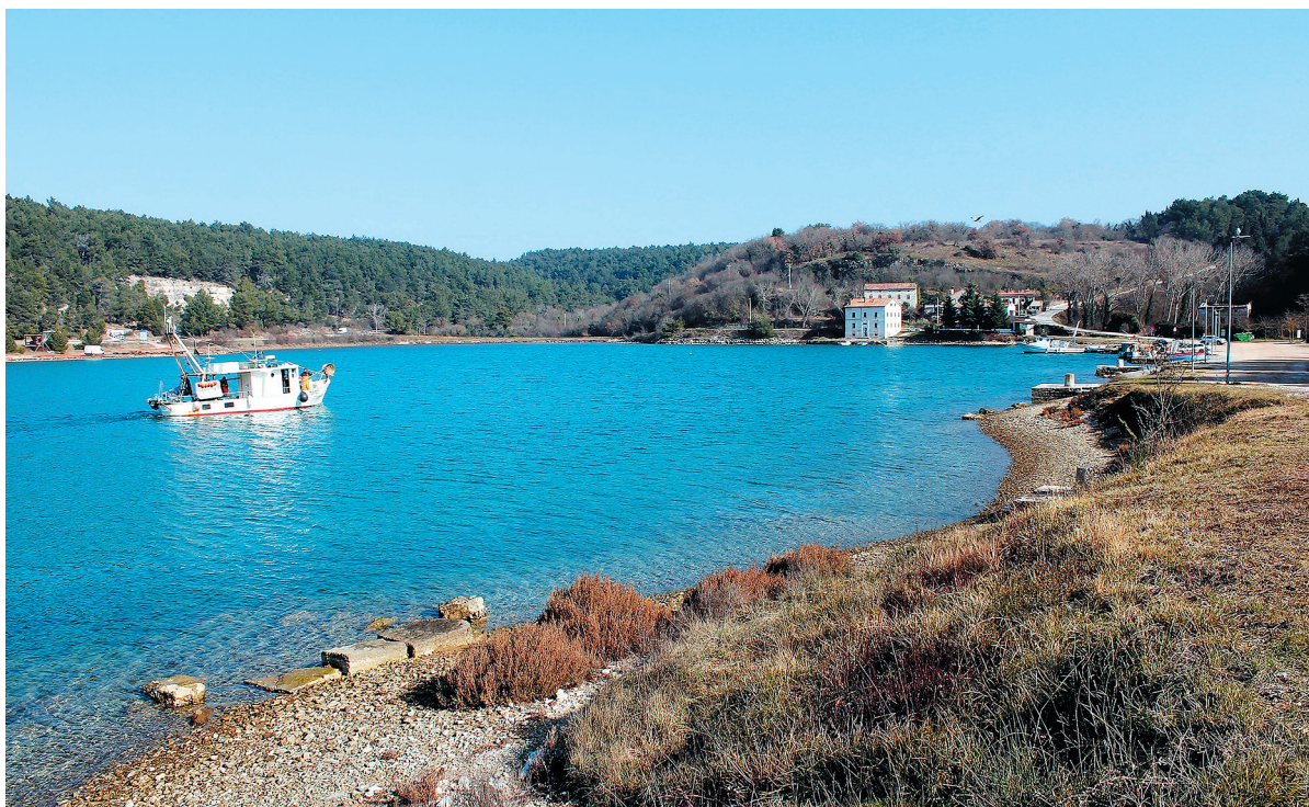
SLIKA 1. Tarska vala i položaj gradine Sv. Martina (foto R. Matijašić, veljača 2017.)