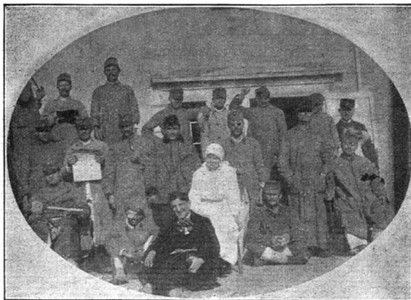
Ranjenici u gradskoj bolnici na Rijeci (odjel za očne bolesti)

Slika 5. Ranjenici na Odjelu za očne bolesti Gradske bolnice u Rijeci. Ilustrovani list, Zagreb, 13. ožujka 1915., br. 11, str. 243