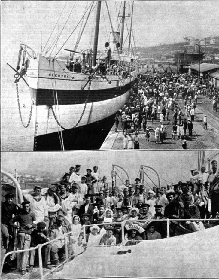
Prvi ranjenici na Rijeci, koji su sa parobrodom „Elektra“ stigli na Rijeku, sa južnog ratišta. Među ranjenicima imade i mornara.

Slika 1. Doček prvih ranjenika u Rijeci, pristiglih parobrodom Elektra s južnog ratišta. Ilustrovani list , Zagreb, 12. rujna 1914., br. 37, str. 875.