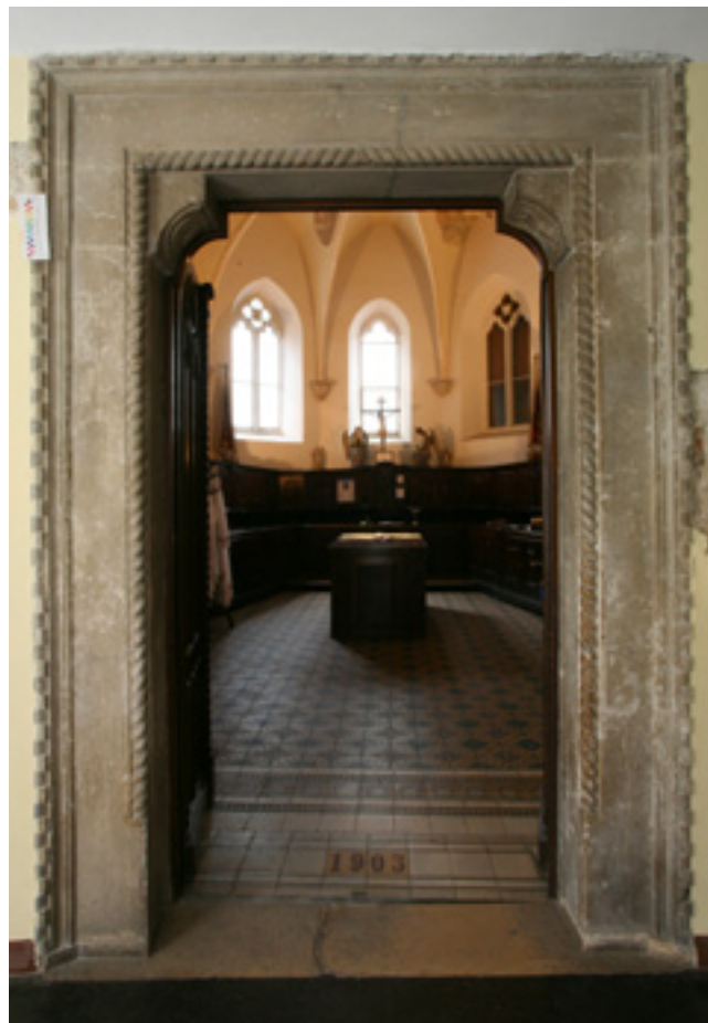
6. Rijeka, portal kapele Presvetog Trojstva Rijeka, portal of the Holy Trinity chapel

Nakon glavnih donatora vazalno je plemstvo samo nastavilo s razvojem samostanske cjeline. U neposrednoj blizini i paralelno sa svetištem podignuta je kapela Presvetog Trojstva. Svojim položajem, a na dalek način i oblikovanjem, podsjeća na kapelu Žalostne Matere Božje, smještenu sjeverno od prezbiterija današnje celjske župne crkve Sv. Danijela. Pri ovoj tvrdnji svakako valja istaknuti da je ipak bila riječ o geografski nedalekom,