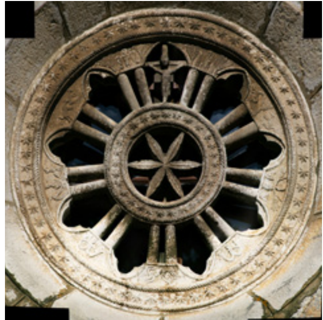
3. Omišalj, rozeta pročelja Stomorine , župne crkve Uznesenja Marijina Omišalj, parish church of Mary's Assumption, rosette in the front façade of the Stomorina

cijeniti kada je ondje ugrađen, preko robusne monofore drugoga kata (kakvima je, barem prema Klobučarićevu prikazu grada Rijeka iz 1579. godine, bila providena završna loža za zvona), na kvarnerskom području svojstvene zvonice prve polovine 16. stoljeća, do kasnogotički koncipirane bifore današnje lože za zvona. Pažnju ćemo ovom prigodom posvetiti isključivo analizi elemenata arhitektonske plastike portala orijentirana prema istoku, tj. pročelju crkve i neposredno nad njim postavljene bifore. Odmah treba istaknuti da je lučno zaključeni portal izveden od monolitna gređa i bez ijednog preveza s građom zida, očito posve recentnoga postanka. Na tjemenu njegova plitkoga luka vrlo je pravilnim arapskim brojevima, za našu temu očito također posve nedavno, možda čak prigodom obnove provedene između dva svjetska rata, uklesana 1377. godina. To je možda bila restauracija neke zatečene datacije, no o tome nema podataka. Već nakon