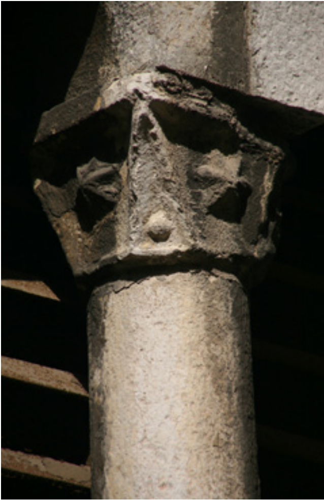
2. Rijeka, kapitel bifore nad portalom zvonika župne crkve Uznesenja Marijina

Rijeka, parish church of Mary's Assumption, capital of the bifora above the belfry portal