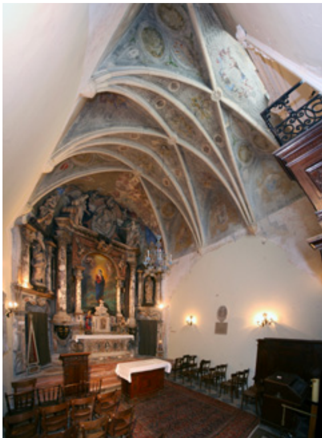
9. Rijeka, kapela Bezgrešnog Začeca Rijeka, chapel of the Immaculate Conception

Rijeka, chapel of the Immaculate Conception, keystone with the coat-of-arms of the Rauber family