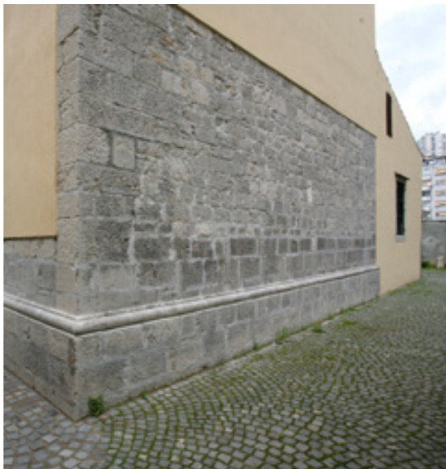
1. Rijeka, začelje svetišta župne crkve Uznesenja Marijina

Rijeka, parish church of Mary's Assumption, rear façade of the sanctuary