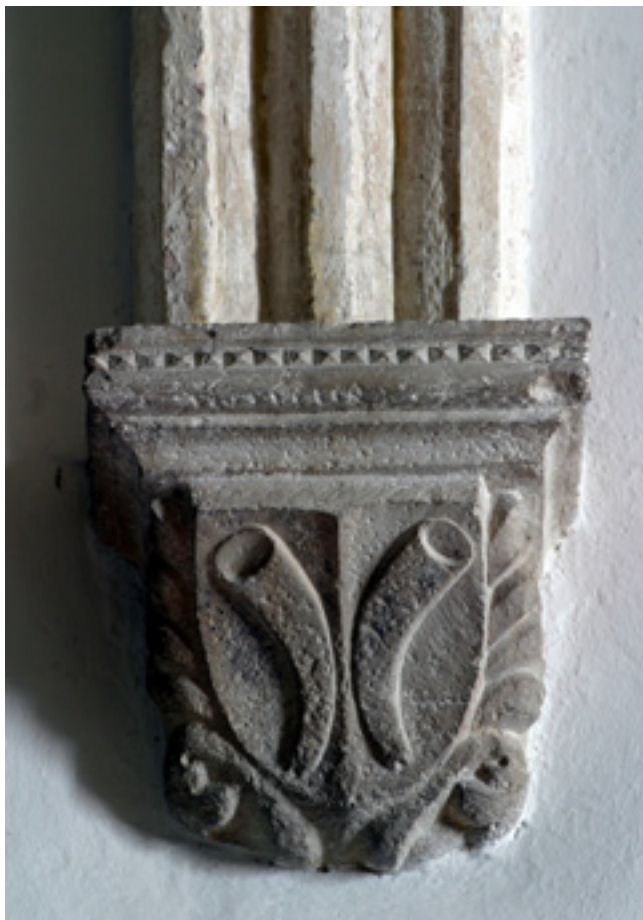
7. Rijeka, konzola s grbom obitelji Raunacher Rijeka, console with the coat-of-arms of the Raunacher family

no daleko kvalitetnijem mogućem uzoru, u usporedbi s kojim riječka kapela može figurirati tek kao krajnje pojednostavljena i značajno kasnija inačica. U okvirima teme riječkoga augustinskog samostana možemo je tumačiti kao vjerojatnu umanjenu inačicu crkvenoga kora, lišenu kontrafora, no vjerojatno izvedenu sa sličnim sustavom svodjenja. Kao i na dugom koru Sv. Jeronima, zid je bio predviđen za žbukanje, ali je sustav zidanja ovdje drugačiji, kamen je znatno bolje uslojen u redove i pažljivije priklesan u relativno ujednačene kvadre. Ovaj je opus vrlo blizak onome rijetkih preostalih, a k tomu i vidljivih segmenata riječke stambene arhitekture iz doba gotike, poput ziđa u visini prizemlja i prvoga kata kuće Garbas, danas sjedišta riječkoga Konzervatorskog odjela. Od kora kapelu danas dijeli uzak prostor nekadašnje sakristije. Svoden je križnim svodovima koji počivaju na kamenim konzolama. Njegovo oblikovanje izlazi izvan okvira ove rasprave. Držimo da ga valja pripisati 16. stoljeću, uz napomenu da je i na njemu uočljiva faznost jer su Pete svodovlja izvedene sedrom, a