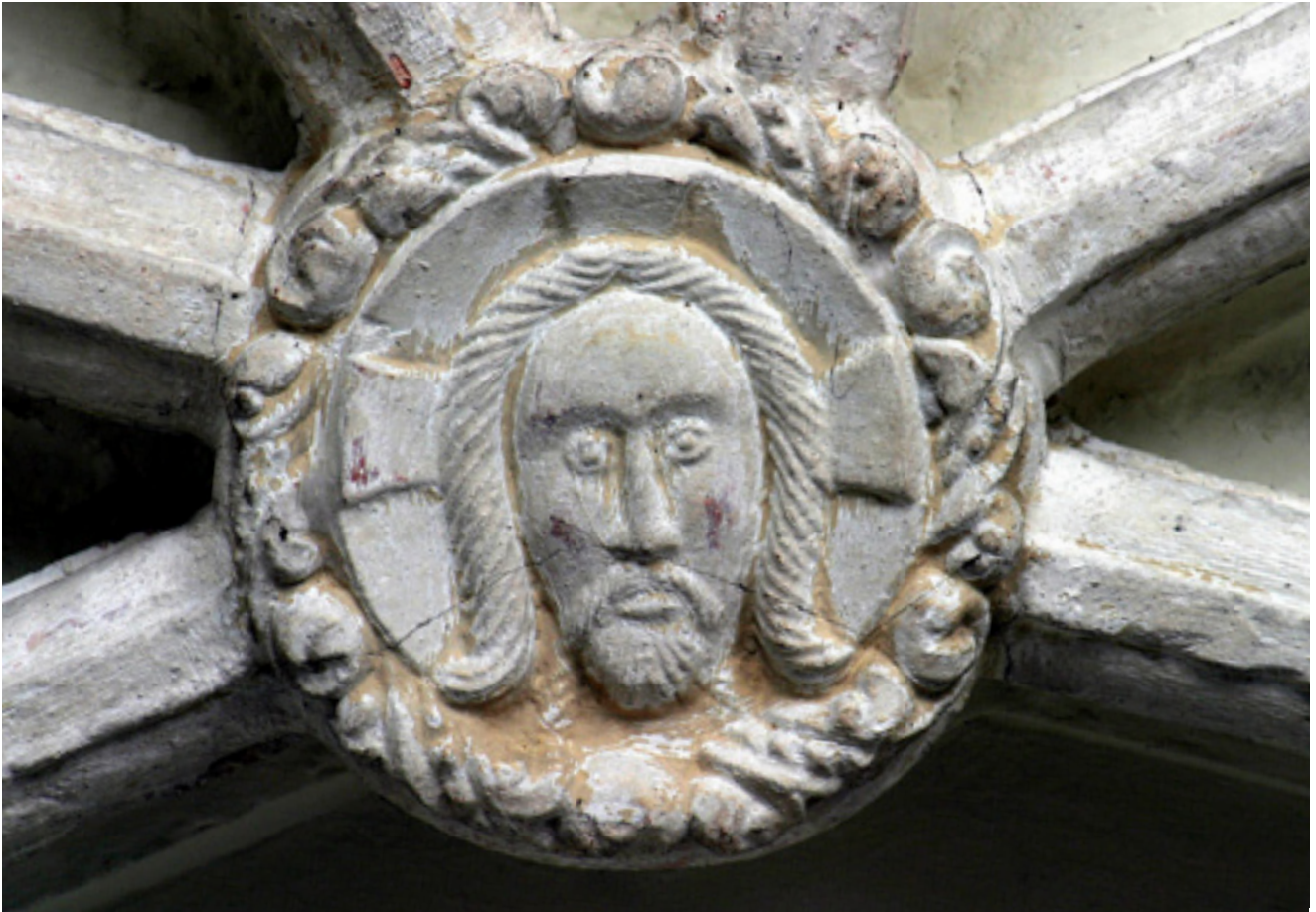
8. Rijeka, kapela Presvetog Trojstva, Vera Icon Rijeka, chapel of the Holy Trinity, Vera Icon

tak 16. stoljeća. Njihovim podnožjima pružaju se štitovi dok im je geometrijsko oblikovanje bliže onomu našega sljedećeg arhitektonskog primjera iz riječkoga srednjovjekovlja. 42 Opisana geometrijska i vegetabilna plastika kapele Raunacher jasno ukazuje na prakticanje niza elemenata svojstvenih kasnogotičkom oblikovanju jadranskih gradova. Drugačiji je slučaj ukrasa nadgrobne ploče supružnika Raunacher koju ćemo ostaviti po strani analize, a za koju je već istaknuto izrazito sjeverno podrijetlo. Izvedbu kapele logično je povezati uz 1450. godinu kojom je datirana nadgrobna ploča supružnika Martina i Margarete Raunacher, što se u pravilu i čini, no ornamentalni bi repertoar gradnje mogao upućivati i na nešto kasnije razdoblje, unutar treće četvrtine 15. stoljeća. 43 Kapela se zatim sukcesivno opremala inventarom, ali je nastavila biti i mjesto povlaštena ukopa pa je ondje, sudeći prema duljem natpisu iz 1484. godine napisanom u formi pravnog dokumenta, počivala Katarina, prva supruga Baltazara de Durra, gospodara Kršana, koji je obnašao funkcije kapetana Rijeke, a kasnije i