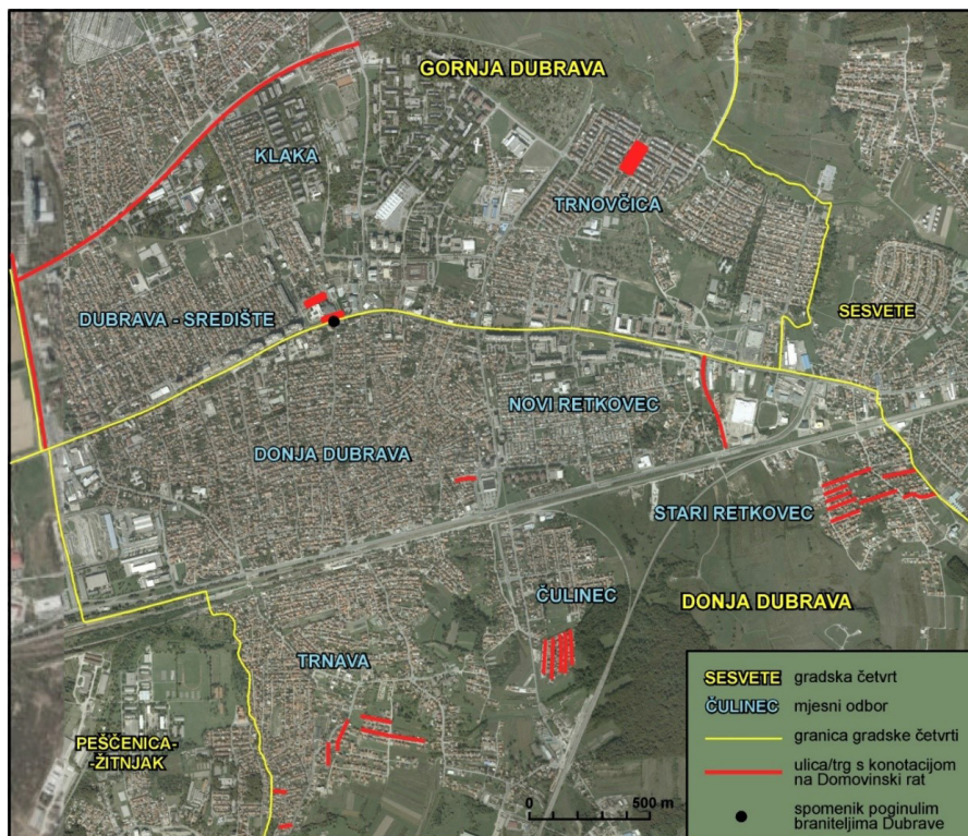
Slika 6. Ulice imenovane 2001. – 2016. koje komemoriraju Domovinski rat. Izvor: Službeni glasnik Grada Zagreba 2001. – 2016.; Zg Geoportail; izradila: Ivana Crljenko, 2017. godine

braniteljima u Domovinskom ratu nazvani su trg 33 i dva parka. 34 Izgrađen je i spomenik poginulim braniteljima Dubrave. Usto su u razdoblju od 2002. do 2016. godine po braniteljima poginulima u Domovinskom ratu nazvane dvadeset tri ulice, uglavnom u rubnim dijelovima Staroga Retkovca, Trnave i Čulinca (Slika 6). Većina tih ulica nosi imena pripadnika 145. brigade, članovi koje su bili stanovnici Dubrave.