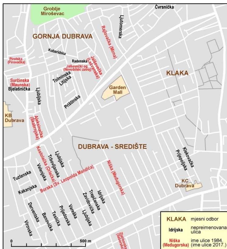
Slika 7. Jugoslavenska toponimija u užoj Dubravi 1984. i 2017. godine. Izvor: Popis preimenovanih ulica i trgova, 2007.; Službeni glasnik Grada Zagreba 2007. – 2016.; Službene stranice Grada Zagreba; Zagreb – plan grada sa svim općinama, 1984.; Zg Geoportal; Google Maps; izradila: Ivana Crljenko, 2017. godine

države. Takva imena ulica očito nisu bila provokativna ili konotativna pa su stoga preživjela intenzivni val postsocijalističkih preimenovanja.