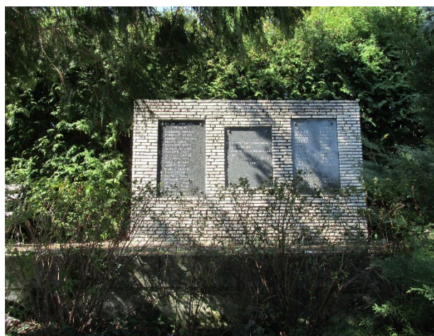
Slika 3. (C) Spomen-ploče sa Spomenika palim borcima NOR-a u Čučerju, danas na ulazu u mjesno groblje