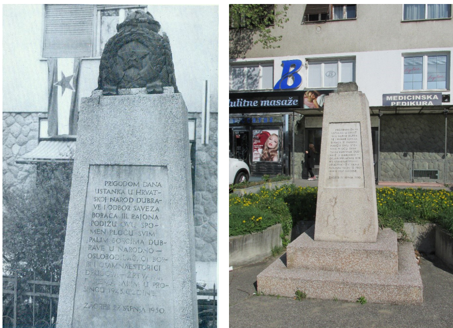
Slika 4. Spomenik palim borcima i žrtvama fašizma Dubrave sa zvijezdom na vrhu 1979. godine (A) i bez zvijezde 2017. godine (B)