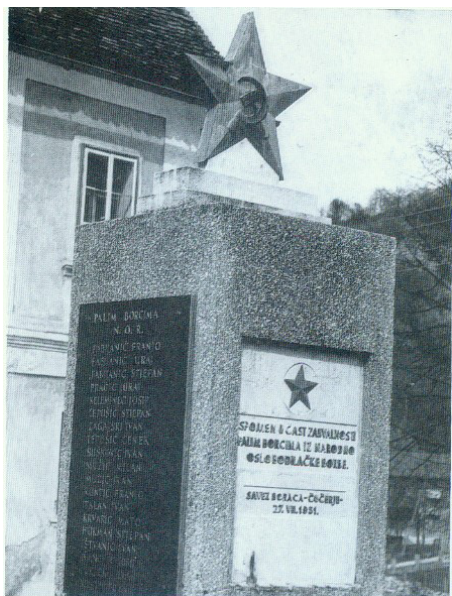
Slika 3. (A) Spomenik palim borcima NOR-a u Čučerju na čučerskom trgu 1979. godine