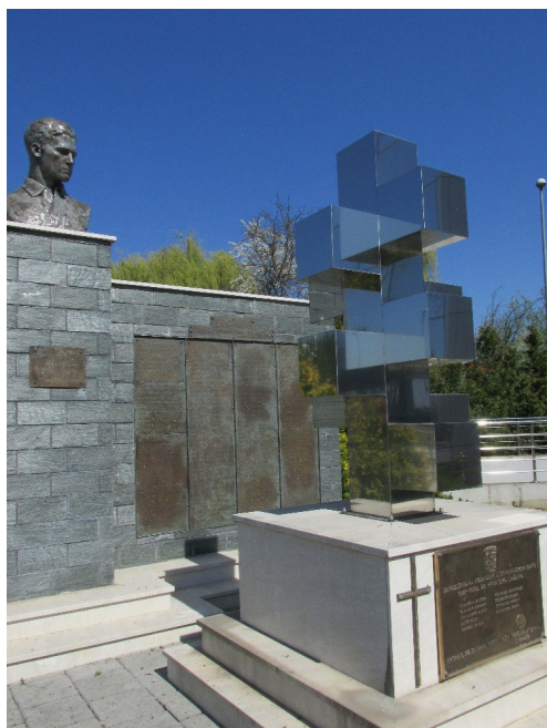
Slika 5. Spomenički kompleks ispred TŽV Gredelj. Fotografirala: Laura Šakaja, 2017. godine

Još jedan zanimljiv primjer simboličke nadgradnje odnosi se na spomenički kompleks koji je, zajedno s Tvornicom željezničkih vozila Gredelj, bio prebačen u Dubravu iz Trnja (Slika 5). Bista Janka Gredelja postavljena je 1959. godine. Dvije godine kasnije ona postaje dio spomen-obilježja podignutoga Gredeljevima radnicima poginulima u NOB-u. Godine 1997. spomen-obilježju dodan je novi spomenik – poginulim braniteljima, zaposlenicima TŽV Gredelj u Domovinskom ratu. Sva tri djela čine jedinstven kompleks koji sadrži natpise nastale u raznim vremenima i političkim okolnostima: JANKO GREDELJ NARODNI HEROJ 1916–1941; SPO-MEN PALIM DRUGOVIMA 1941–1945; ZAPOSLENICIMA POGINULIM U DOMOVINSKOM RATU 1991–1995. ZA HRVATSKU DRŽAVU.