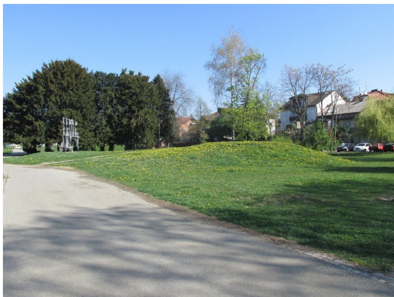
Slika 2. Spomenik prosinačkim žrtvama i uzvisina (desno) na kojoj je nekad stajao. Fotografirala: Laura Šakaja, 2017. godine

Spomenik prosinačkim žrtvama koji je stajao na humku u središtu parka istoga imena spušten je s uzvisine i pomaknut u dubinu parka, čime je bila postignuta njegova “prostorna degradacija”, odnosno manja prostorna vidljivost (Slika 2). Slično tome je “degradiran” Spomenik palim borcima NOR-a u Čučerju – premještanjem s glavnoga čučerskoga trga prema rubu obližnjega groblja, dakle sa središnje pozicije u naselju na rubno i manje vidljivo mjesto (Slika 3).