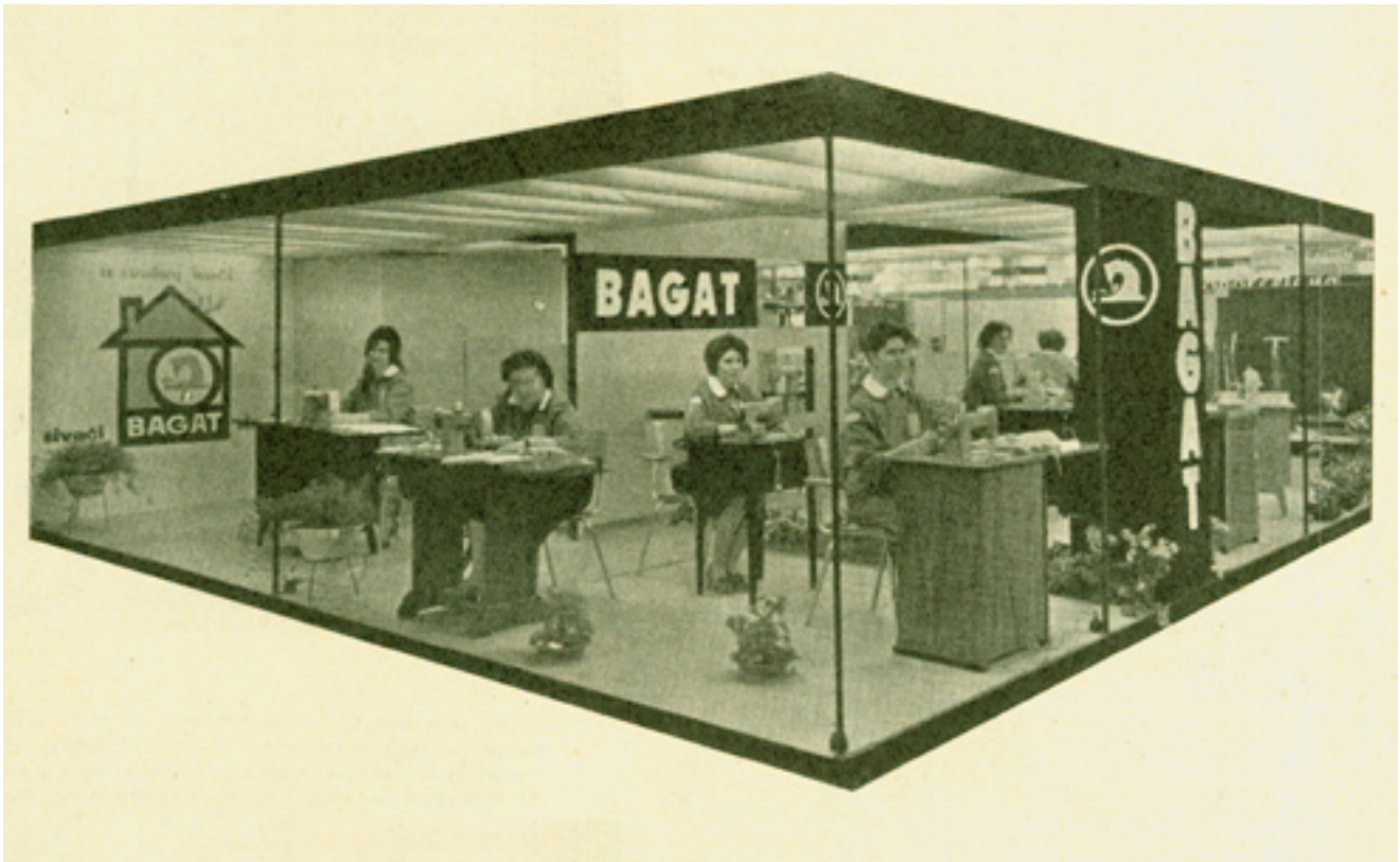
1. Izložbeni prostor zadarske tvornice Vlado Bagat na izložbi Porodica i domaćinstvo 1960. godine na Zagrebačkom Velesajmu

Exhibition venue at the Vlado Bagat factory in Zadar, exhibition Family and Household at the Zagreb Fairgrounds (1960)