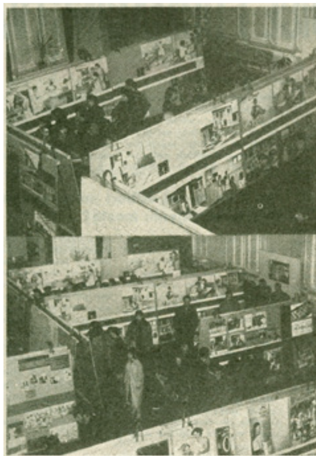
5. Dio postava izložbe Stambena zajednica (izvor: N.N., 7500 kilometara puta pokretne izložbe Stambena Zajednica : Osim neposrednog rada s posjetiocima organizirana su predavanja, sastanci, prikazivanje filmova i diskusije, Porodica i domaćinstvo , Beograd – Zagreb: Centralni zavod Porodica i domaćinstvo, 9 / 1960./, 14-15, 15) Part of the exhibition The Housing Community

Krajem pedesetih sve je intenzivnija rasprava o provedenju nove stambene reforme, ekonomičnijoj izgradnji stanova i boljoj organizaciji stambenih zajednica, a predviđeno je i održavanje niza predavanja o značaju i primjeni zakona nove stambene reforme. 42 U takvom je ozračju organizirana pod nazivom Stambena zajednica najznačajnija izložba na temu kulture stanovanja u Zadru, lokalna verzija izložbe Porodica i domaćinstvo 43 održana od 22. do 29. veljače 1960. u prostorijama Filozofskog fakulteta. 44 Radi se o putujućoj izložbi koju je organizirao Savezni odbor Porodica i domaćinstvo , 45 a gostovala je po SFRJ u 22 grada te stoga nije zaobišla ni Zadar. Fotografijama, maketama, tekstovima i timom demonstratora koji su pratili i objašnjavali izložbu željelo se upoznati građane sa svim aspektima novoosnovanih stambenih zajednica. 46 Izložba je obuhvaćala problematiku organizacijskih oblika djelovanja stambenih zajednica, brigu za djecu, društvenu ishranu, higijenu i kulturu stanovanja, organizaciju servisnih službi, modernizaciju trgovine ali i razne vidove osmišljavanja slobodnog vremena; rekreaciju i razonodu. 47 Sastojala se od četiri dijela koja su pojašnjavala što su to stambene zajednice, koja je njihova uloga te kako prosječan član stambene zajednice provodi dan. Prvi dio izložbe prikazivao je razvoj urbanizma u svijetu i lokalnoj sredini,