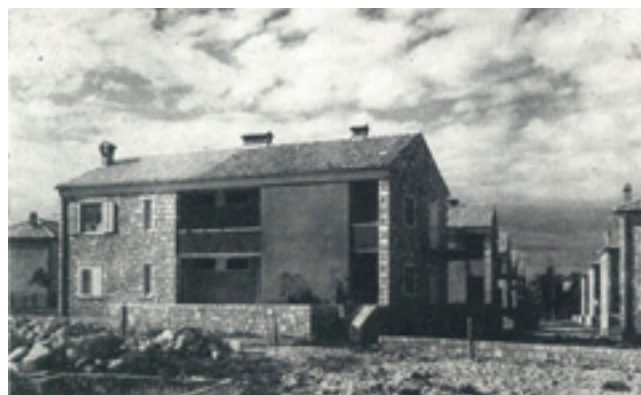
9. Stambeno naselje Ive Bartolića u Zadru Housing estate in Zadar designed by architect Ivo Bartolić

S druge strane, zadarska povijesna jezgra ispunjena je interpolacijama koje pokazuju nerazumijevanje zadarskih potreba, loše prostorne odnose i nelogične strukture. Antonija Mlikota ove probleme uočava u slučaju dvojne zgrade TD 4245 i TD 4273 Ive Bartolića, stambenoj zgradi Staro kazalište (arh. Srđan Čulić i Damir Bogdanović iz Projektnog poduzeća Donat ), bloku Stara pošta (arh. Slavka Šimatića iz Projektnog poduzeća Donat ) te dvojnoj stambenoj zgradi u Splitskoj ulici, dijelom nastaloj prema projektu Barice Petričević iz Projektnog poduzeća Donat . Također, u pojedinim slučajevima adaptacije postojećih zgrada pretvarale su se u rušenje i ponovnu izgradnju, među kojima su i primjeri nepoštovanja za-