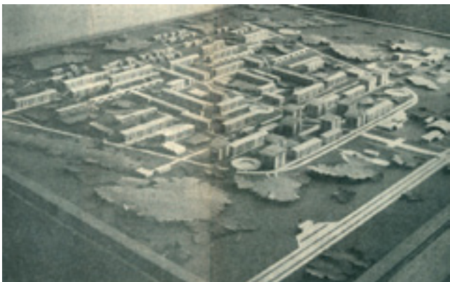
3. Maketa ogleđnog urbanističkog rješenja stambenog naselja izložena na izložbi Stambena zajednica

Model of a housing estate at the exhibition The Housing Community