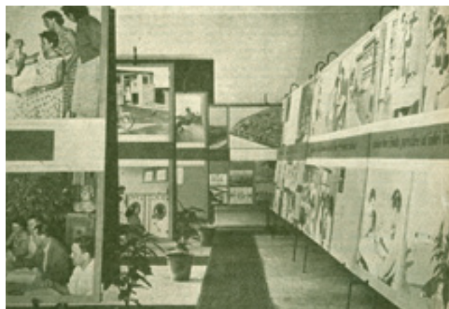
4. Dio postava izložbe Stambena zajednica (izvor: N.N., 7500 kilometara puta pokretne izložbe Stambena zajednica : Osim neposrednog rada s posjetiocima organizirana su predavanja, sastanci, prikazivanje filmova i diskusije, Porodica i domaćinstvo , Beograd – Zagreb: Centralni zavod Porodica i domaćinstvo, 9 / 1960./, 14-15, 15)

Part of the exhibition The Housing Community