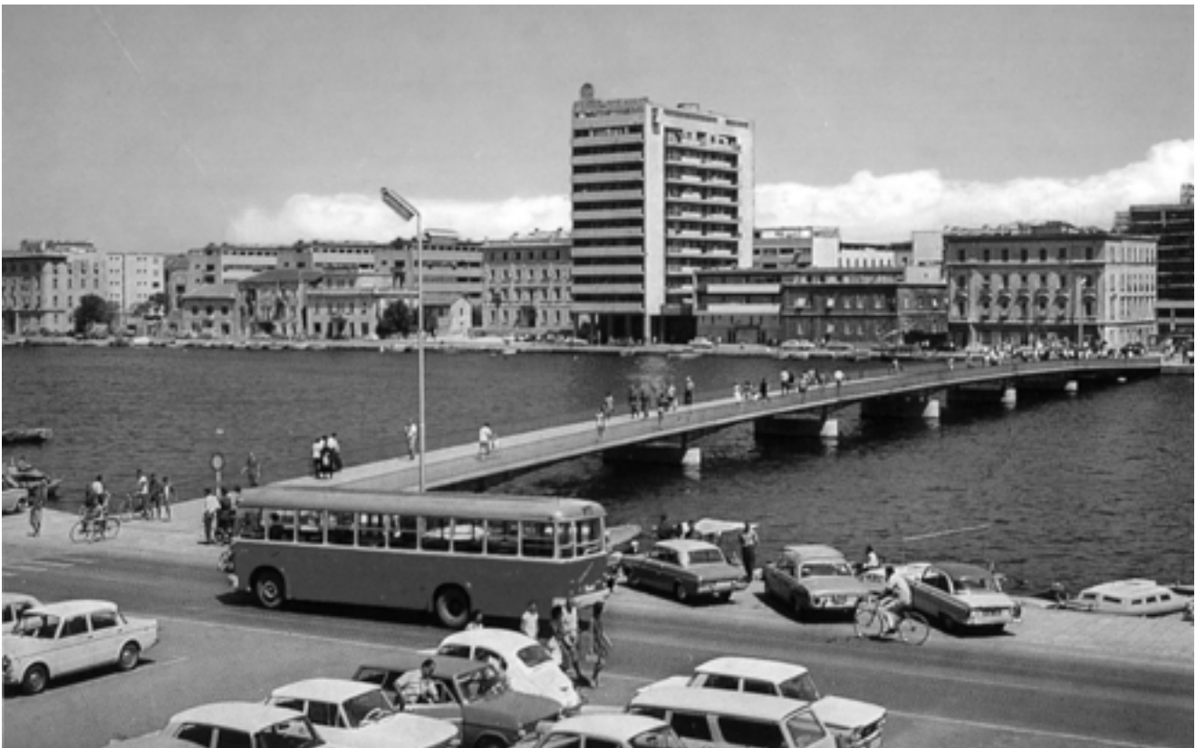
11. Pogled na Branimirovu obalu 1960-ih godina View to Branimir's Seafront in the 1960s

Do vremena austrougarske vlasti Zadar je zauzimao prostor poluotoka. Rušenjem zidina Zadar prestaje funkcionirati kao utvrda (gradska su se vrata prije zalaska