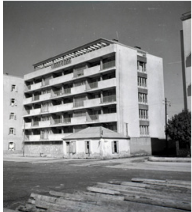
13. Stambena zgrada za radnike zadarskog poduzeća Vlado Bagat na Branimirovoj obali (arh. Igor Skopin), (foto: A. Brkan, izvor: Galerija umjetnina Narodnog muzeja Zadar)

One of the three identical buildings at Branimir's Seafront, architect Dragan Boltar