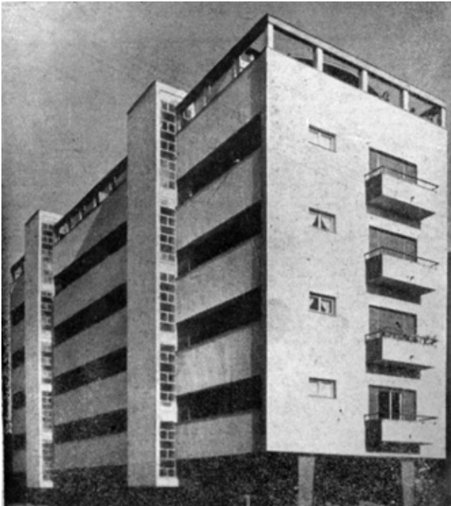
12. Jedna od tri identične zgrade na Branimirovoj obali sagrađene prema projektu arhitekta Dragana Boltara, (foto: A. Brkan, izvor: JOSIP BUDAČ, Stambena izgradnja u Zadru, u: Glas Zadra , 24. prosinca 1955., 6)

One of the three identical buildings at Branimir's Seafront, architect Dragan Boltar