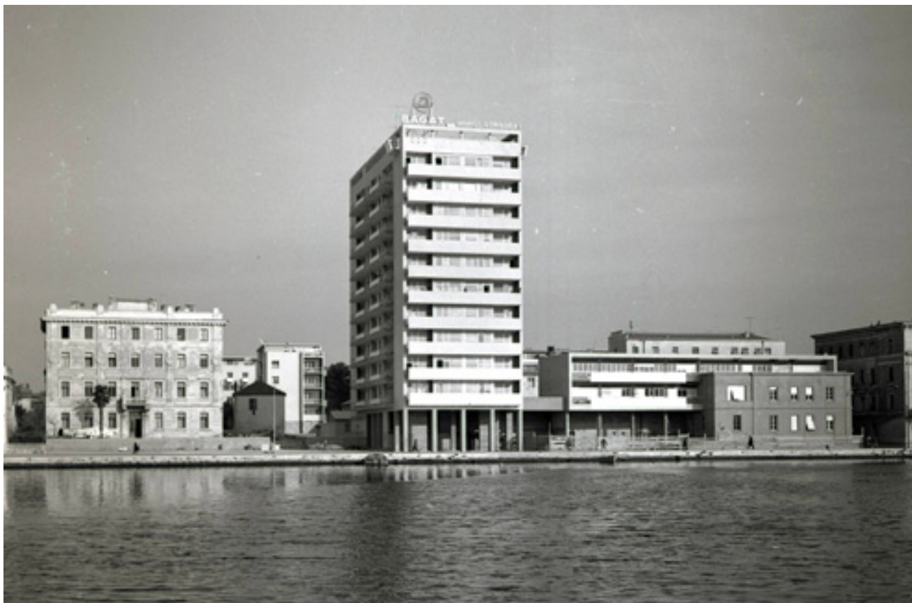
14. Voštarnica – „Bagatov neboder”, 1962., (foto: A. Brkan, Galerija umjetnina Narodnog muzeja Zadar) Voštarnica, Zadar: “Bagat’s Skyscraper”, 1962, Art Galery of the National Museum in Zadar

Gradski predio Voštarnica do Drugog svjetskog rata sadržavao je niz stambenih, gospodarskih i vojnih objekata iz vremena austrougarske i talijanske uprave. Regu-