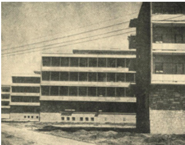
15. Stambene zgrade na Voštarnici sagrađene prema projektu arh. Milana Grakalića

Apartment buildings in Voštarnica, Zadar, architect Milan Grakalić