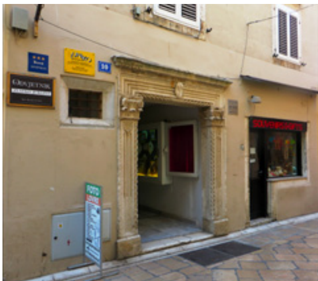
5. Mala kuća Nassis (foto: S. Sorić) The smaller Nassis house (photo: S. Sorić)

ku s kamenim stubištem koje je bilo dekorirano reljefnim školjkama na bočnim stranicama stuba pod kojim se vjerojatno već tada nalazila i kamena klupa koju spominje G. Sabalich. 23 Dvorište je s dvije strane bilo natkriveno trijemom, a u jednom kutu nalazili su se i zahodi.