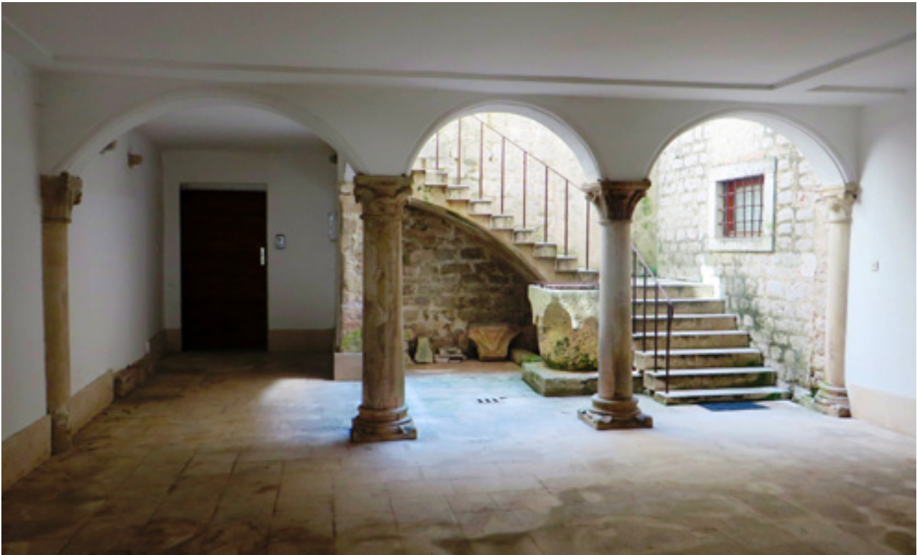
2. Unutrašnje dvorište kuće Nassis Inner courtyard of the Nassis house

Slijede još neki uvjeti vezani uz Dominika i Šimuna koji ostaju u velikoj kući. Ako jedan od njih bude želio napraviti zdenac za slanu vodu ( puteum salmastrum ) ili protok za kišnicu, neka to učini o zajedničkom trošku. Svaki od njih može, ako želi, zatvoriti svoje stubište u prizemlju. U svom dijelu kuće mogu graditi po volji, pod uvjetom da ne čine štetu jedan drugome, a krov camere scure ne smije se micati s mjesta na kojem se nalazi. Poslove koji su vezani uz branje i preradu grožđa i maslina mogu izvoditi u svojim ostavama i u zajedničkom dvorištu, isto vrijedi i za pranje robe. Nadalje, u vrijeme prodaje vina ne smiju jedan drugoga ometati, a onaj brat koji ima ostavu u sjeverozapadnom ( ponentali ) dijelu kuće, ne smije po običaju gostione (taberne) staviti natpis da prodaje vino osim na prozor s rešetkama koji se nalazi jugoistočno od velikih vrata kuće. Braća imaju rok od petnaest dana da se presele svaki u svoj dio kuće. Ugovor je napisan u njihovu dućanu u zapadnom kutu Narodnog trga, u predjelu samostana Svete Katarine, a sudac i djelitelj bio je Bartolomej Ugrinić, prior Svetog Martina u Varošu.