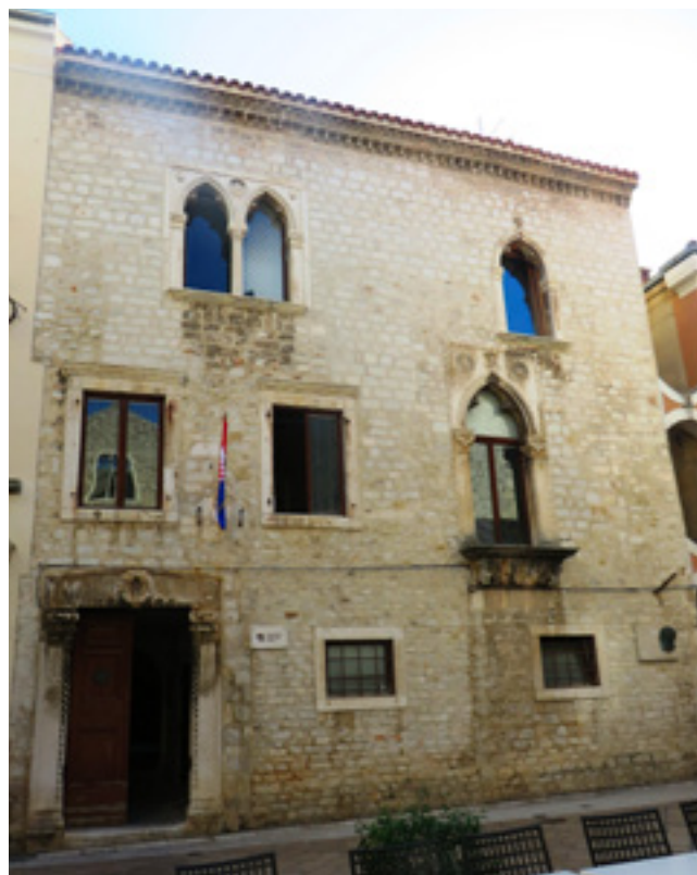
1. Pročelje kuće Nassis