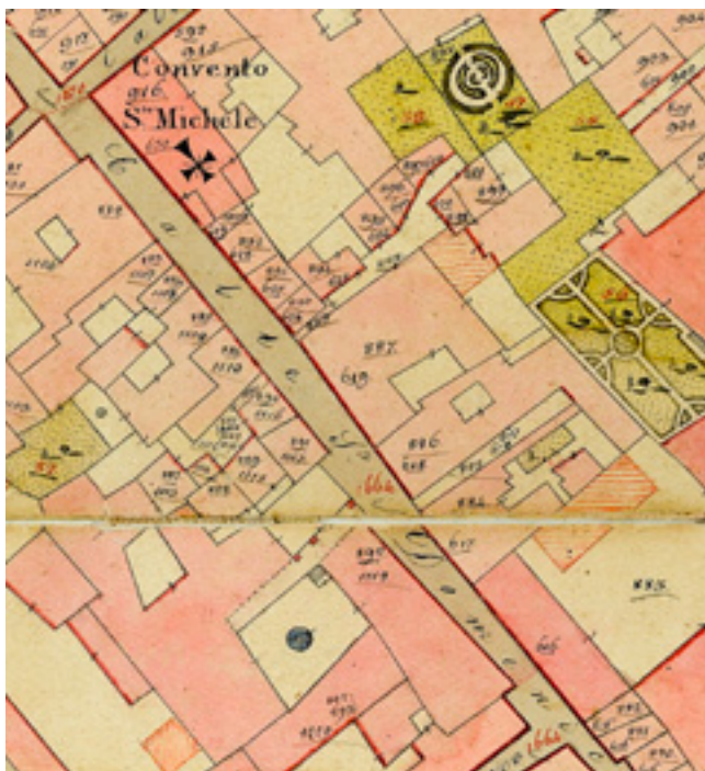
3. Položaj kuća Nassis na katastarskoj mapi iz 1927. godine; velika kuća pod brojem 618, a mala pod brojem 885. (Državni arhiv Zadar, HR-DAZD-382 Uprava za katastarsku izmjeru, Zadar-Poluotok, br. 577)

Situation of the Nassis house on a cadastre map from 1927: the larger house is indicated as 618 and the smaller one as 885