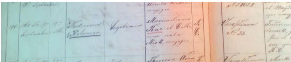
Slika 2. HR-DAVŽ-543 Matične knjige rimokatoličkih župa, Župa sv. Nikole u Varaždinu, Matična knjiga rođenih 1858.-1868.