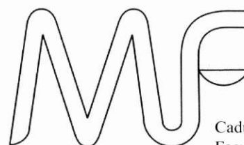
Caduceus of the Faculty of Medicine in Osijek