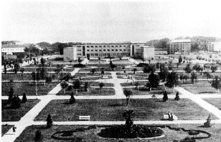
SLIKA 1. Dom zdravlja Osijek, 1939. FIGURE 1 Health Centre Osijek, 1939