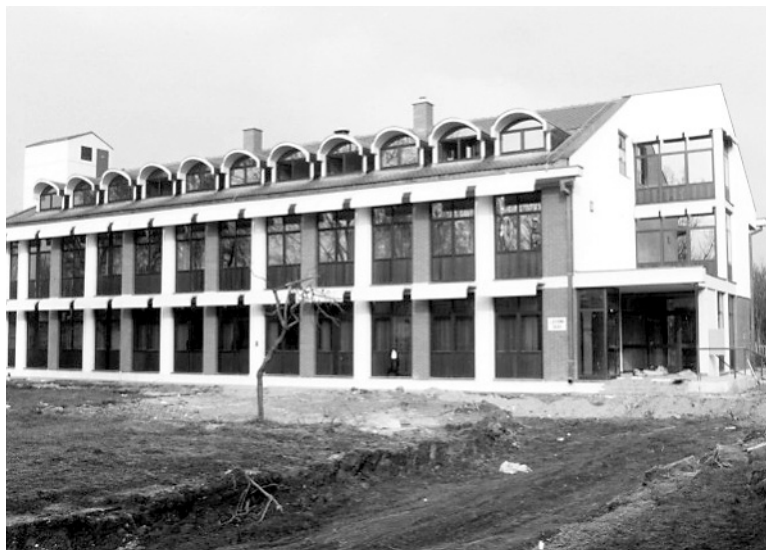
SLIKA 2. Zdravstvena stanica Višnjevac, 1985. FIGURE 2 Health Station Višnjevac, 1985