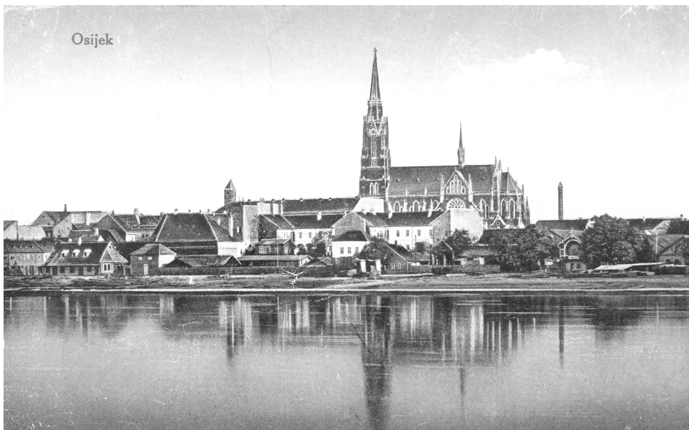
SLIKA 4.: Osijek-panorama Gornjega grada, 1930. FIGURE 4: Osijek-panorama of the Upper Town, 1930