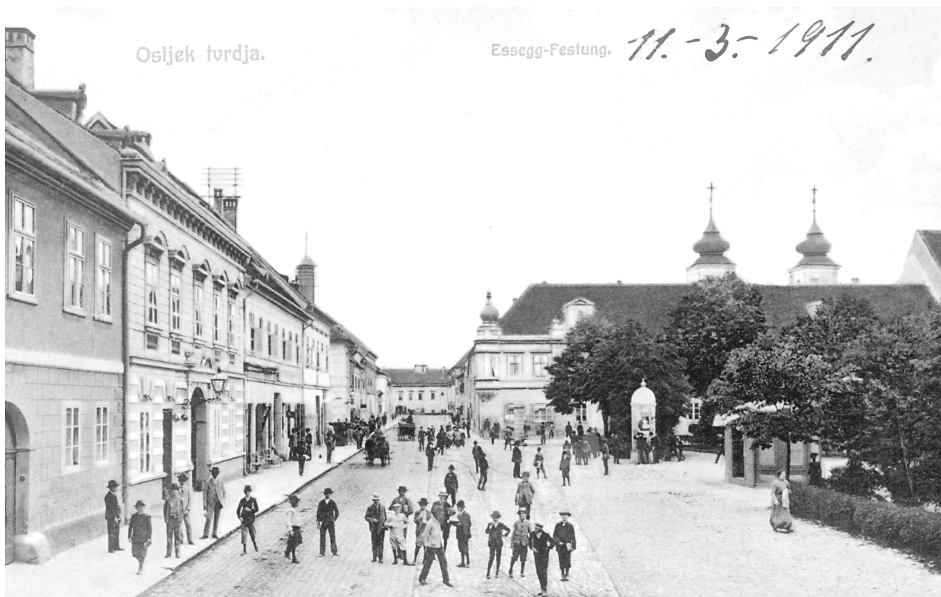
SLIKA 5.: Osijek, Tvrđa, 1911. g. FIGURE 5: Osijek, Tvrđa, 1911