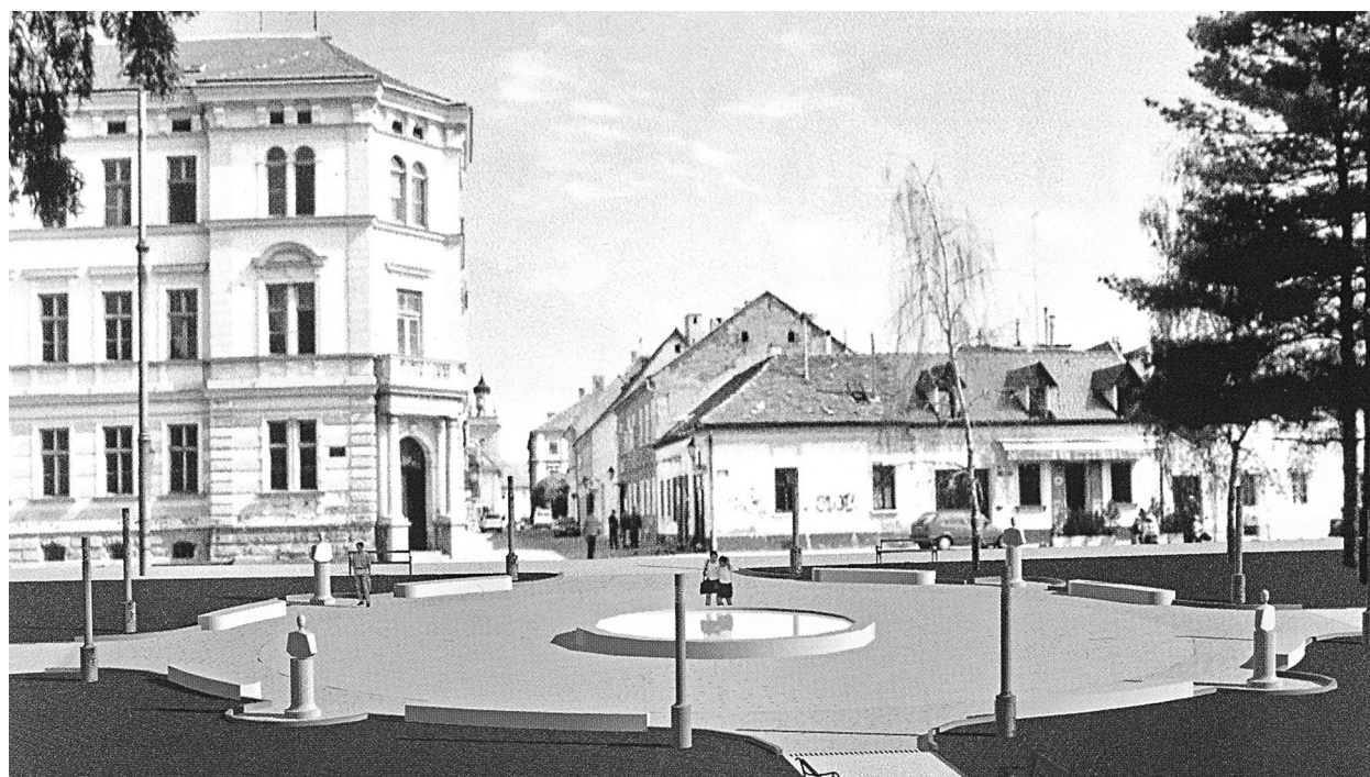
SLIKA 2.: Zgrada Treće gimnazije u Osijeku s kompjutorskom simulacijom Rondela velikana FIGURE 2: Building of the Third comprehensive school in Osijek with a computer simulation of "Rondel velikana"