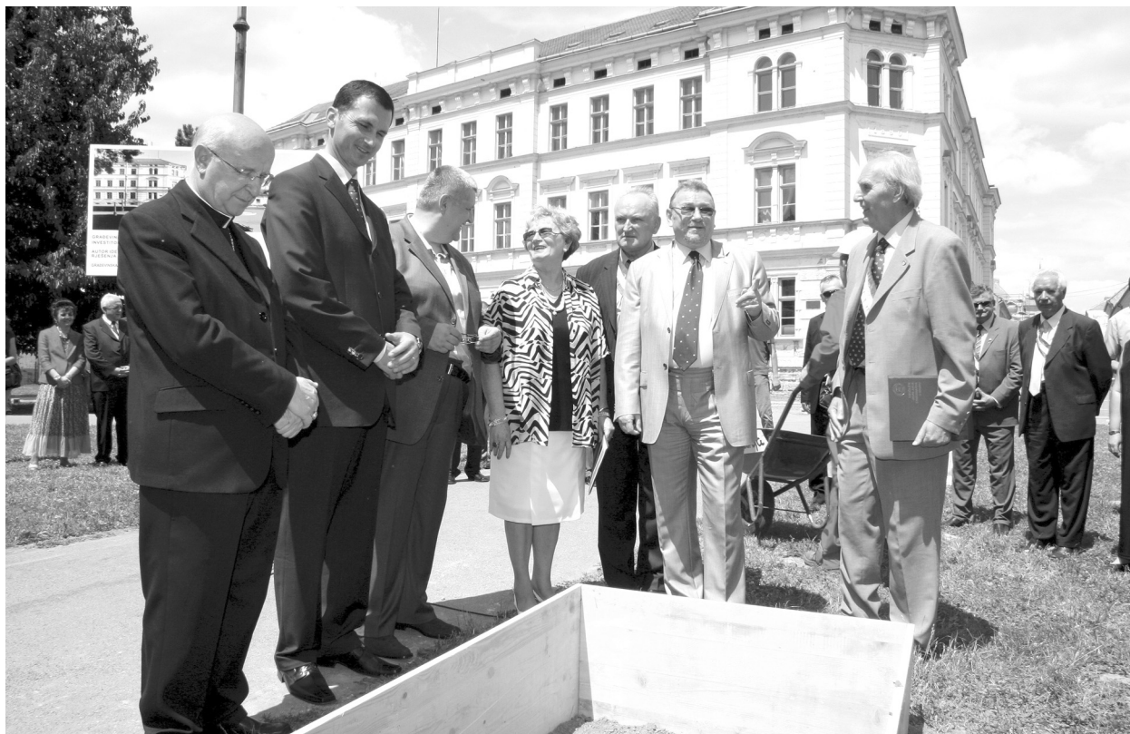
SLIKA 1.: Svečanost u povodu polaganja kamena temeljca Rondela velikana u osječkoj Tvrđi FIGURE 1: Foundation-stone laying ceremony for "Rondel velikana" in the Osijek Tvrđa