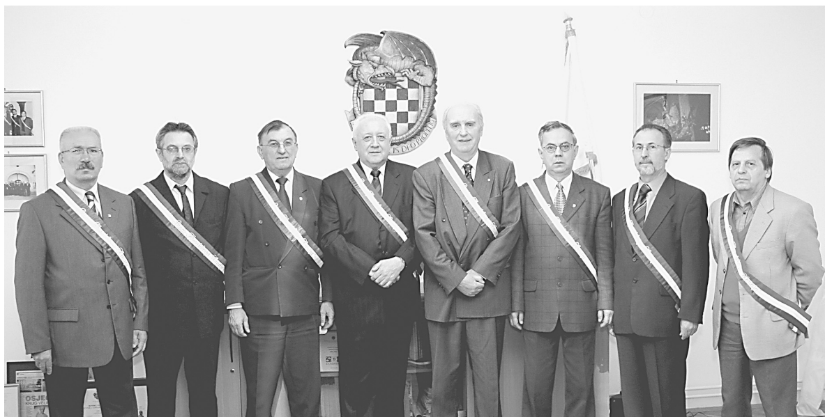
SLIKA 3.: Družba Braća Hrvatskog Zmaja, Zmajski stol u Osijeku FIGURE 3: Brothers of the Croatian Dragon, Dragon table in Osijek