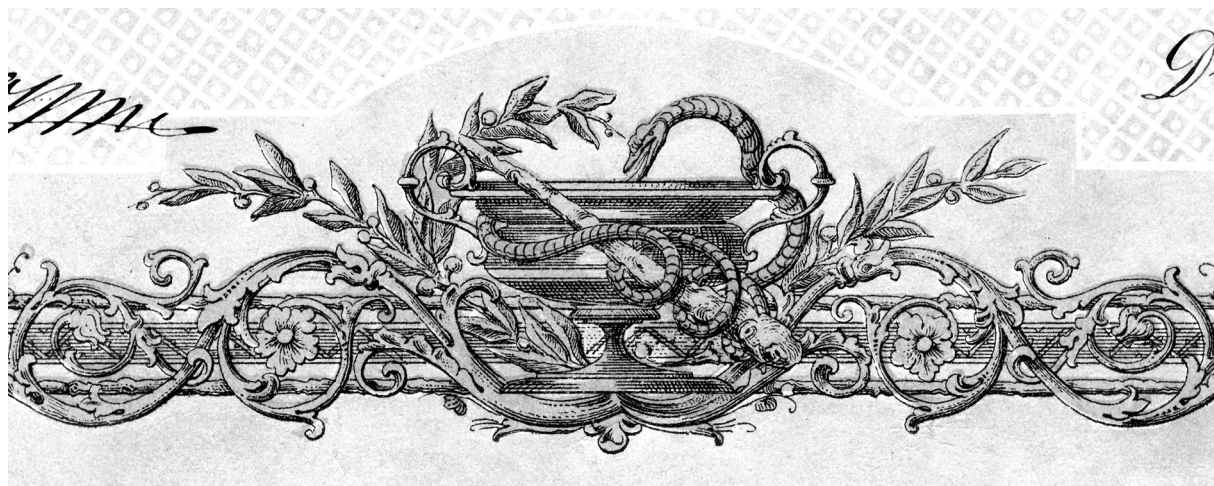
SLIKA 4. FIGURE 4