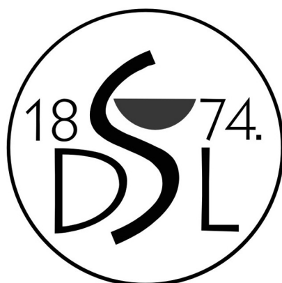
SLIKA 12a. FIGURE 12a

HRVATSKI LIJEČNIČKI ZBOR PODRUŽNICA OSIJEK