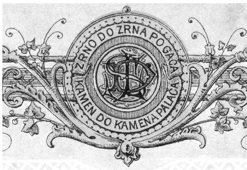
SLIKA 5. FIGURE 5