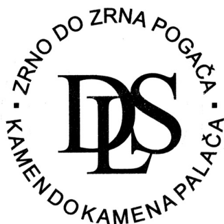
SLIKA 7. FIGURE 7