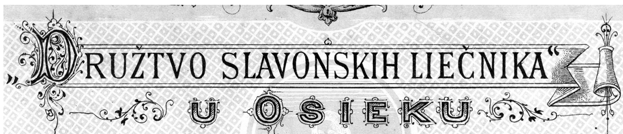
SLIKA 6. FIGURE 6