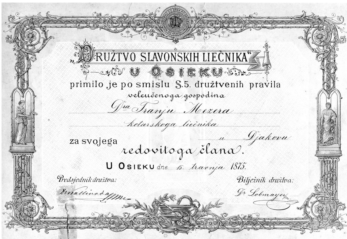
SLIKA 1. FIGURE 1