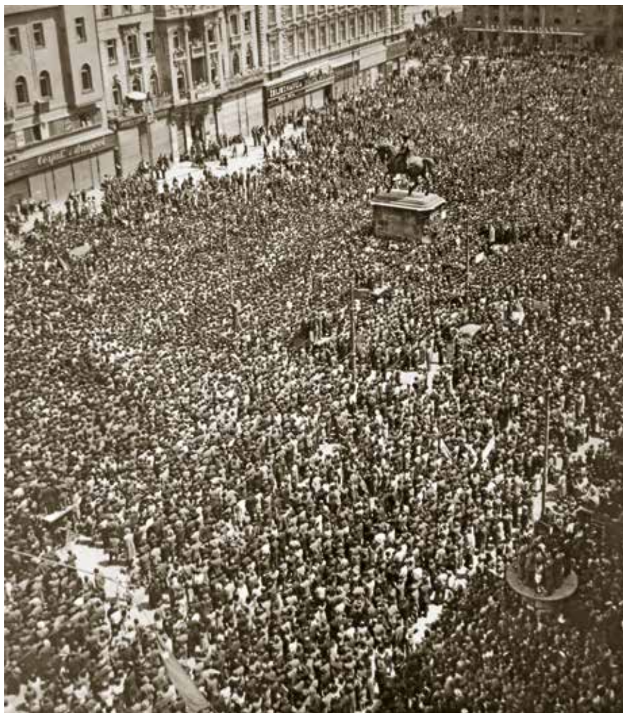
5, Politički skup na Trgu bana Jelačića, oko 1945. (foto: M. Pavić, izvor: PAVIĆ, MILAN, 1959.)

Milan Pavić, political rally on Ban Jelačić Square, c. 1945 (photo: M. Pavić, source: PAVIĆ, MILAN, 1959)