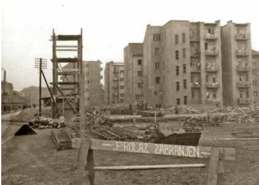
6 Martićeva ulica – pogled na gradilište, 11. ožujka 1949. (Muzej grada Zagreba, fot-16762)

Martićeva Street – view of the construction site, 11 March 1949, (Zagreb City Museum, fot-16762)