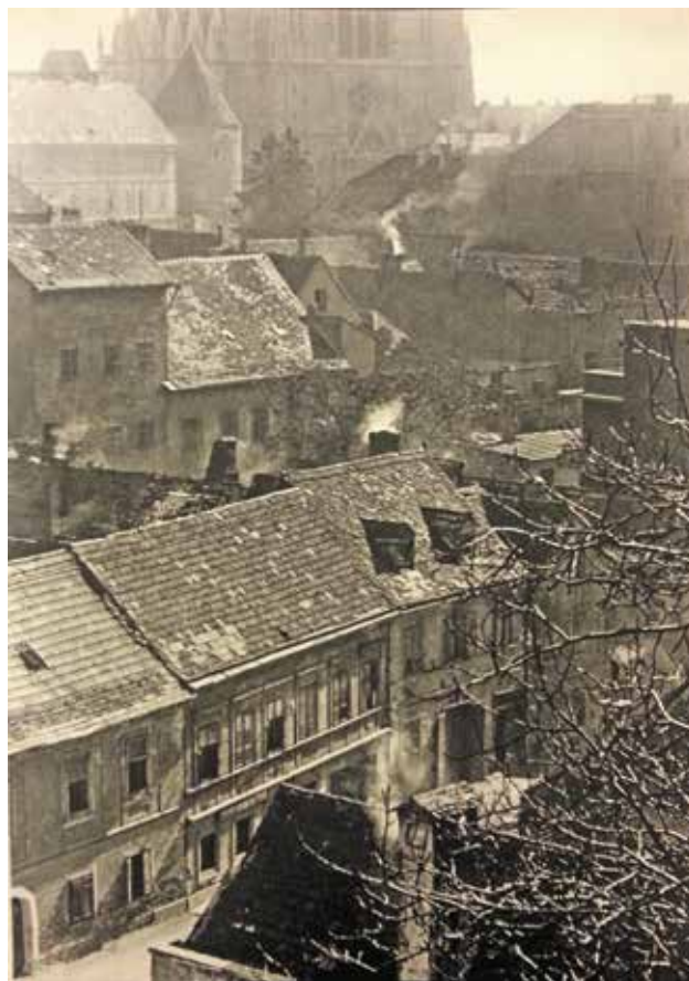
15 Prostor između utvrda katedrale i Gradeca, oko 1955. (foto: Z. Strižić, izvor: STRIŽIĆ, ZDENKO, 1955., 115)

Radićeva Street, c. 1955 (photo: Z. Strižić, source: STRIŽIĆ, ZDENKO, 1955, 63)