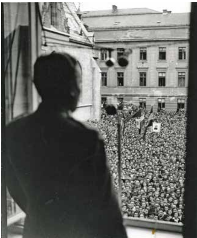
3 Govor Josipa Broza Tita iz Banskih dvora, 21. svibnja 1945.

Address given by Josip Broz Tito in Banski dvori, 21 May 1945 (photo: M. Pavić, Zagreb City Museum, fot-21059)