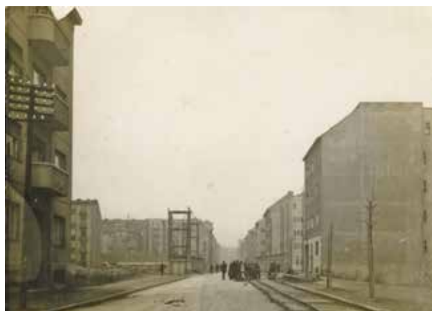
4 Martićeva ulica – pogled prema sjeveru, 11. ožujka 1949. (Muzej grada Zagreba, fot-16761)

Address given by Josip Broz Tito in Banski dvori, 21 May 1945 (photo: M. Pavić, Zagreb City Museum, fot-21059)