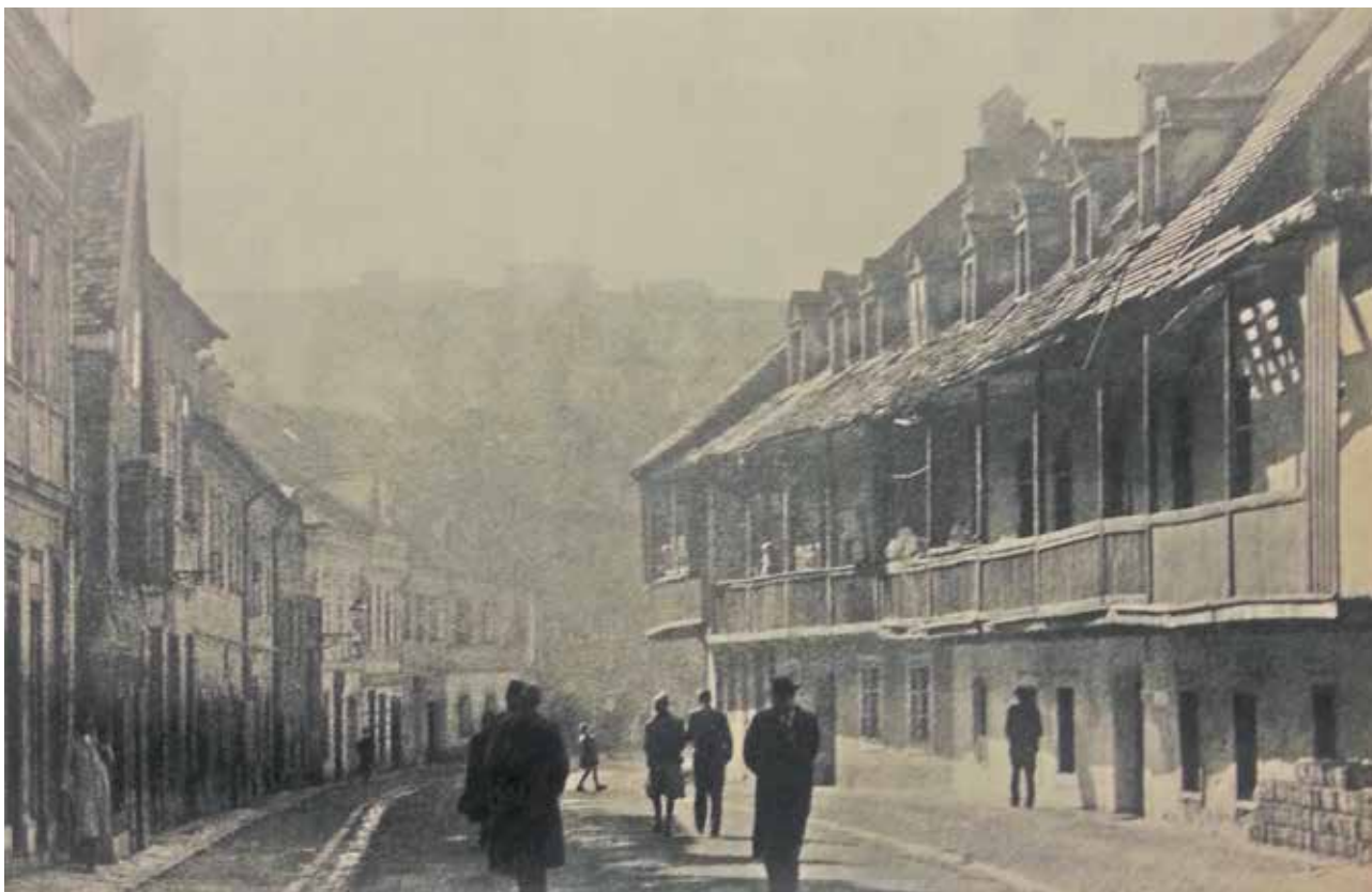
12 Tkalčićeva ulica, oko 1955. (foto: Z. Strižić, izvor: STRIŽIĆ, ZDENKO, 1955., 45)

Tkalčićeva Street, c. 1955 (photo: Z. Strižić, source: STRIŽIĆ, ZDENKO, 1955, 45)