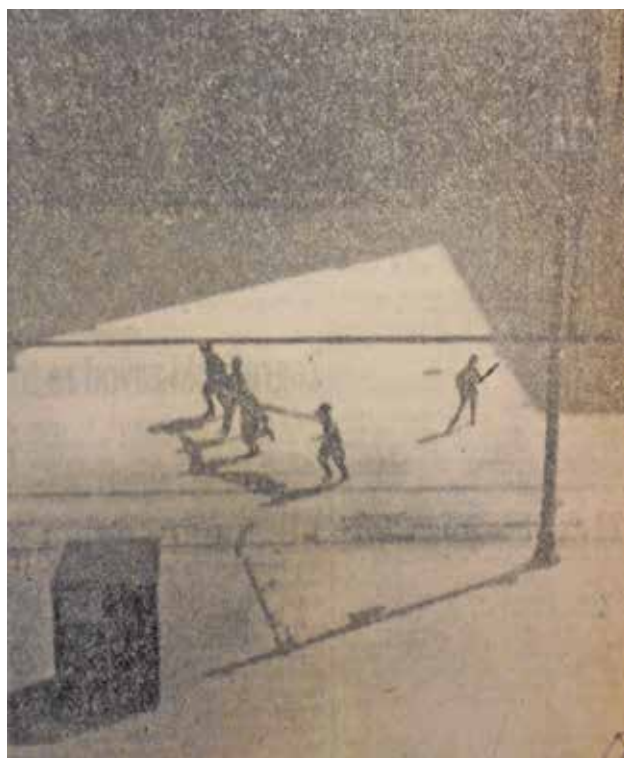
2 Partizanski omladinci na praznom Trgu bana Jelačića, 8. svibnja 1945. (presnimka iz novina Narodni list I/1, 26. svibnja 1945., 3)

Photo of partisans marching onto the Ban Jelačić Square, 8 May 1945 (photo: M. Pavić, Zagreb City Museum, fot-21249)