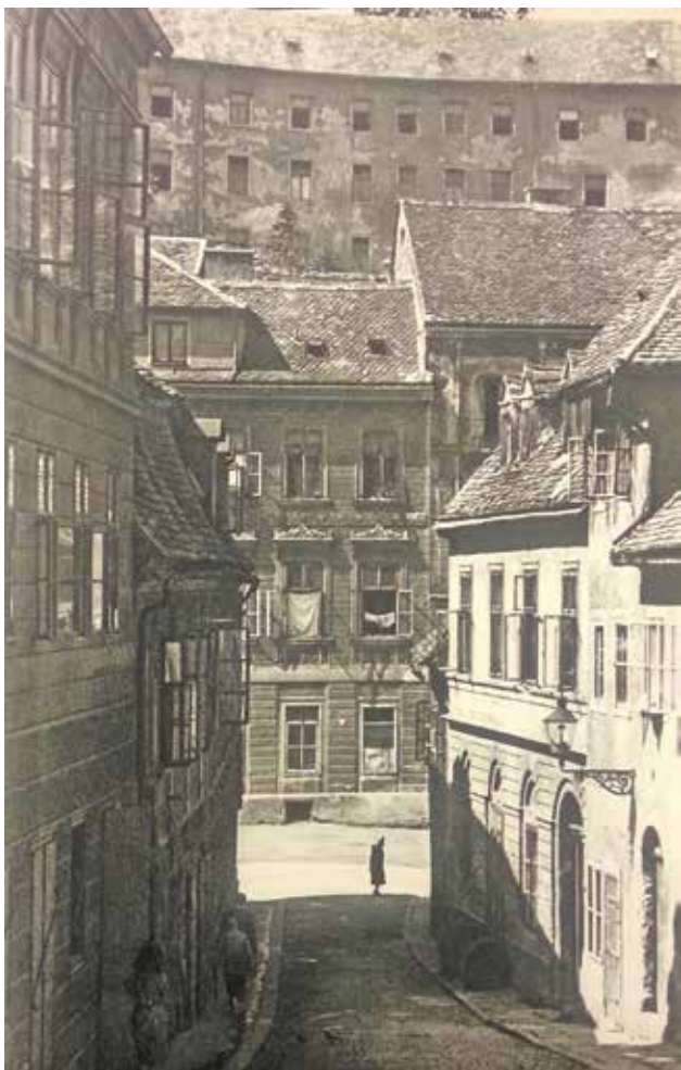
13 Skalinska ulica, oko 1955.

Skalinska Street, c. 1955