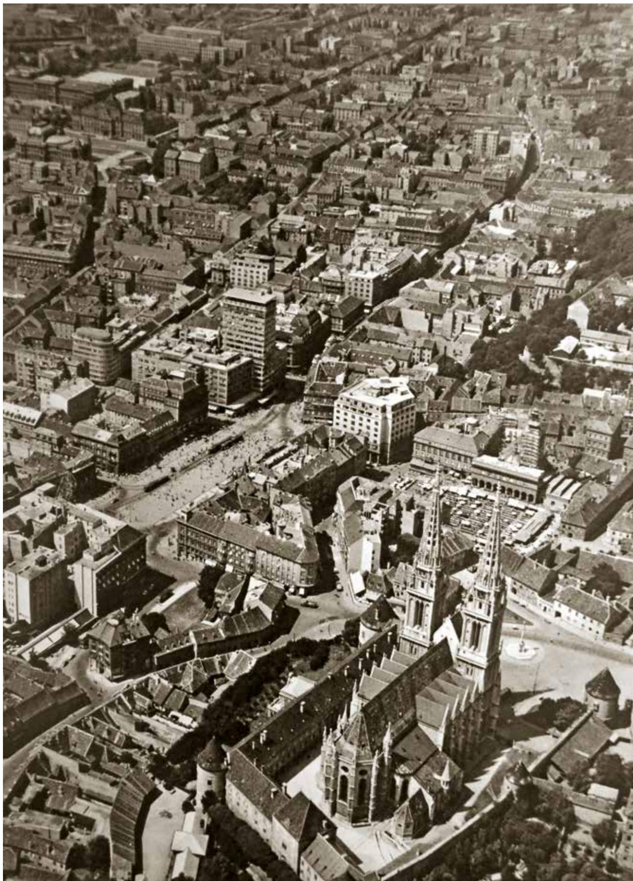
17 Zračni snimak Kaptola, Dolca i dijela Donjeg grada, oko 1959. Aerial photo of Kaptol, Dolac and part of Donji grad, c. 1959