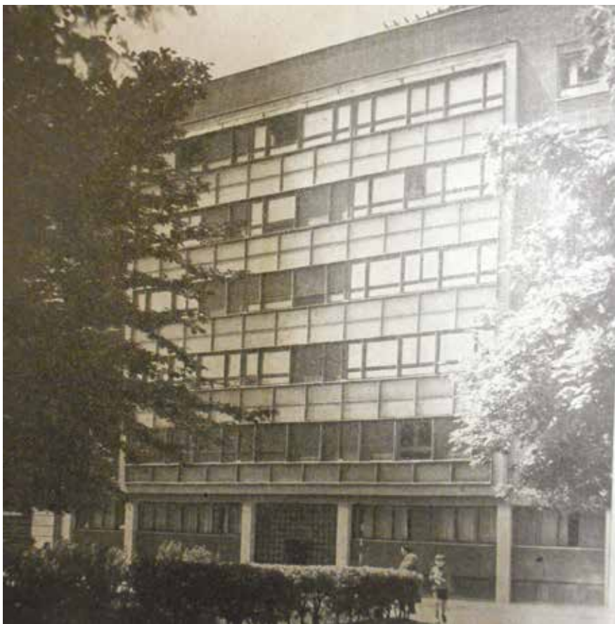
16 Roca, Stambena zgrada Drage Galića na Svačićevu trgu u Zagrebu

Roca, apartment building designed by Drago Galić on Svačićev Square in Zagreb