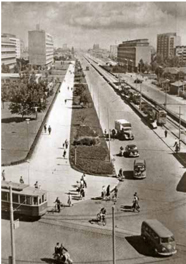
7 Ulica proleterskih brigada (Varaždinska, Moskovska, Beogradska, danas Vukovarska), oko 1959.

Proleterske brigade Street (Varaždinska, Moskovska, Beogradska, today Vukovarska Street), c. 1959