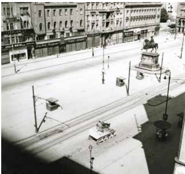
1 Snimka ulaska partizana na Trg bana Jelačića, 8. svibnja 1945.

Photo of partisans marching onto the Ban Jelačić Square, 8 May 1945