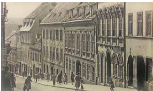
14 Radićeva ulica, oko 1955.

Radićeva Street, c. 1955