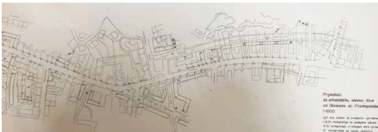
10 Prijedlozi za urbanističku obnovu Ilice, od Slovenske do Frankopanske, 1957., detalj

Proposals of urban reconstruction of Ilica Street, from Slovenska Street to Frankopanska Street, 1957, detail.