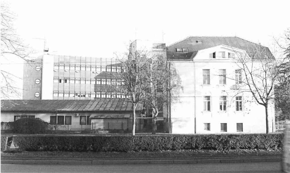
Desno - današnja zgrada Klinike za neurologiju, u kojoj je primarius dr. Ivo Glavan postavljao znanstvene i stručne temelje osječke neuropsihijatrije

vanja u vrijeme kad nije bilo interneta, a stručni su časopisi stizali kasno i u malom broju. On se smatrao sposobnim da svojim intelektualnim potencijalima može preuzeti ulogu «mosta» između razvijenih zemalja Evrope i zaostale Hrvatske. Čitajući strane knjige i časopise, on je stalno imao pred očima svoju buduću knjigu, koja će pomoći da hrvatskim neurolozima i psihijatrima prikaže najnovija dostignuća u struci i potakne njezin brži razvoj u nas. Imao je predilekciju prema neurologiji, jer mu je bila bliža, predviđajući skoru pojavu dokazivih veza između patoloških procesa u živčanom sustavu i njihovih kliničkih emanacija – neuroloških ili psihijatrijskih