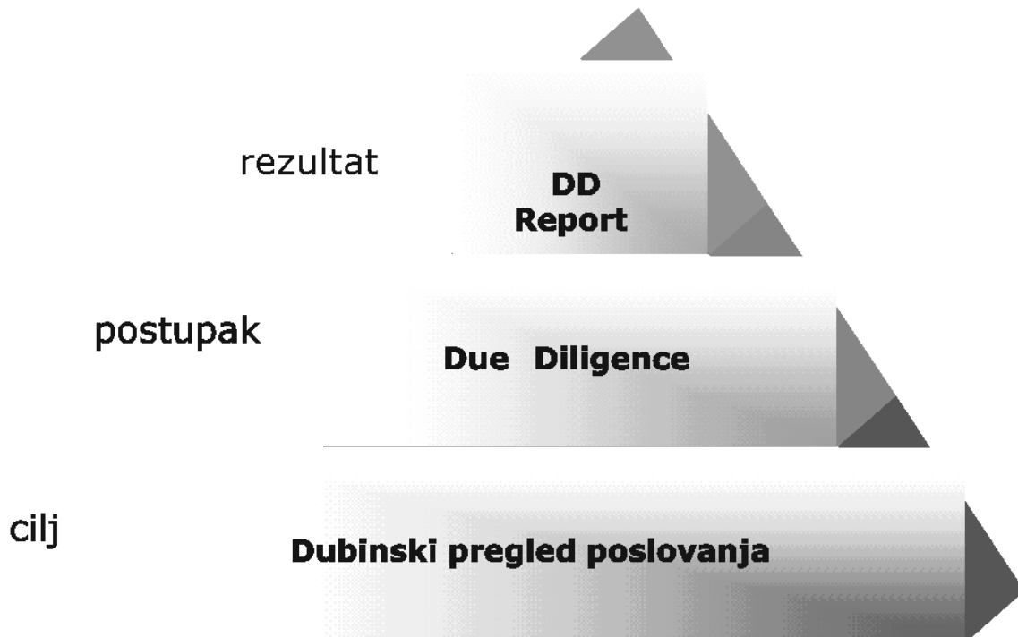
Slika 1. Dubinska analiza poslovanja