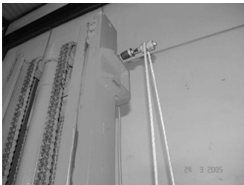
Slika 1. Krajnji prekidač kojim se aktiviralo podizanje radnika (zabranjena preinaka)