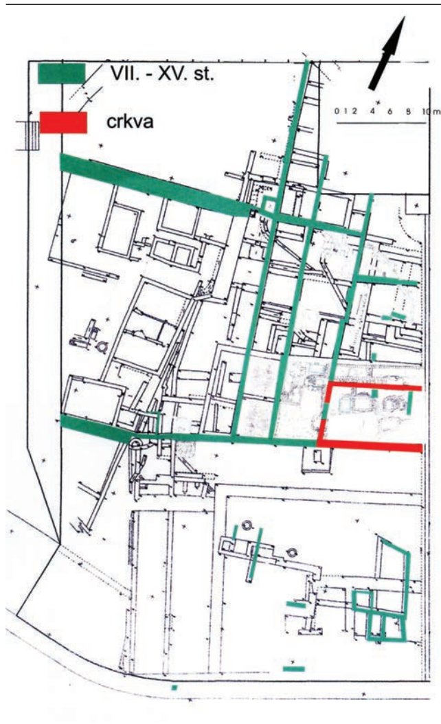
Sl. 2 Tlocrt ranokršćanske i predromaničke crkve (Starac 2011e, 37).

Fig. 2 Ground plan of the early Christian and pre-Romanesque churches (Starac 2011e, 37).