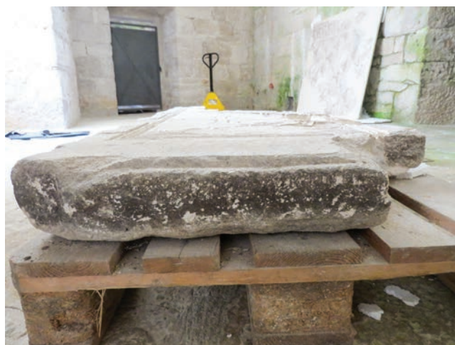
Sl. 4 Bočna strana ploče.

corner there are trefoils directed towards the cross, and the central position of the edge of the steplike profile shows a branch with leaves with a dove on it. The latter motifs were made by almost engraving the stone surface. The leaves are emphasized in the middle, in order to achieve greater realism of the motif, and the beautifully depicted dove, with a rounded head and a short beak, has emphasized feathers in the area of the tail, a wing, and an eye. The slab does not have a preserved connection (a pin) necessary for wedging into the pilaster (Fig. 4).