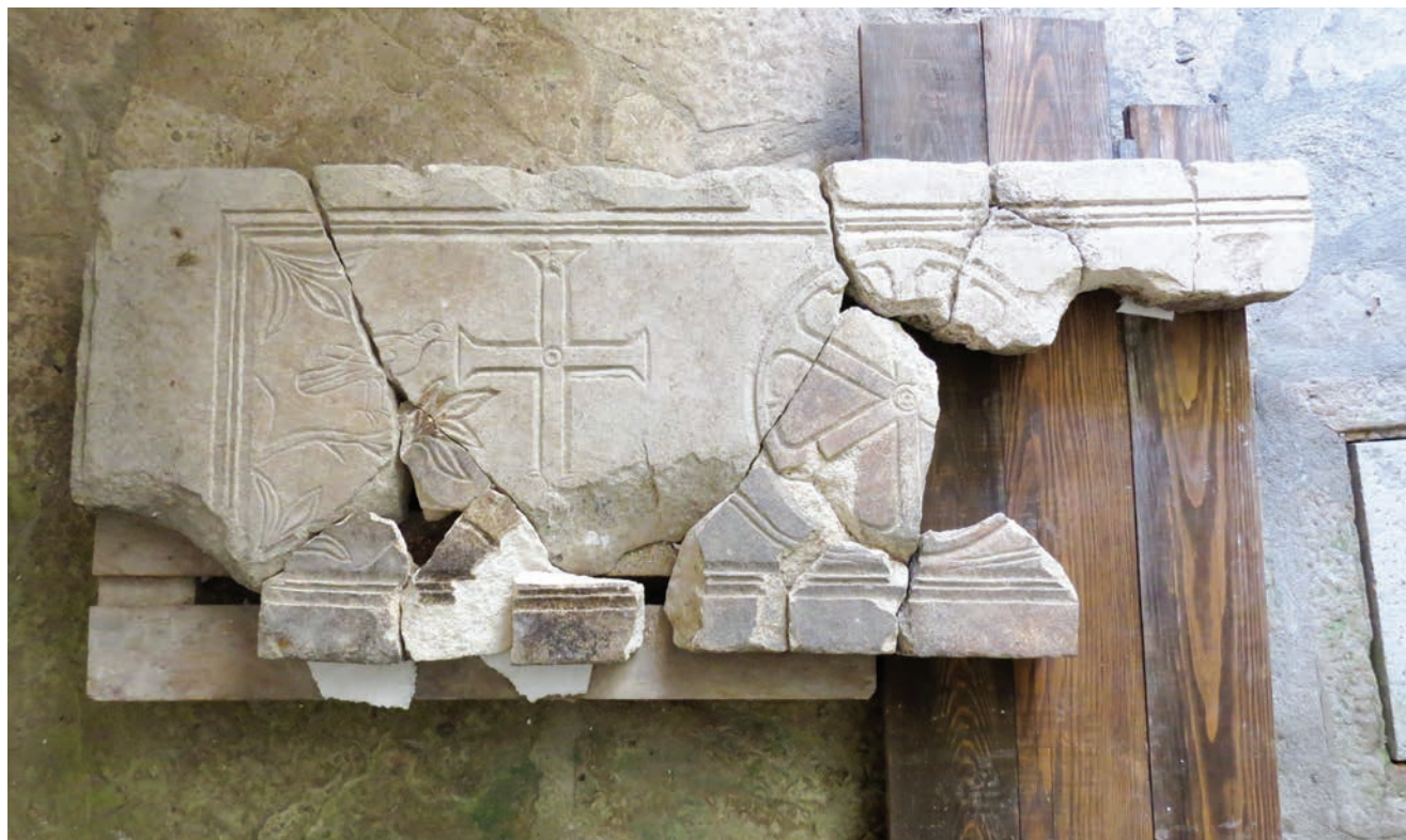
Sl. 3 Ranokršćanska kamena ploča iz četvrti sv. Teodora u Puli.