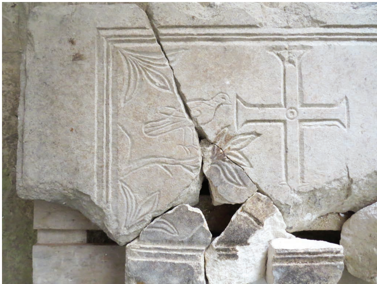
Sl. 5 Detalj ploče s prikazom golubice, grančice, trolista i križa.