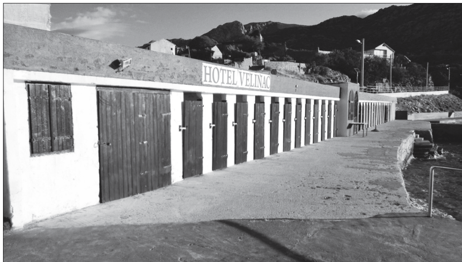
Sl. 1. Današnje gradsko kupalište u Karlobagu, foto: I. Brlić, 2014.