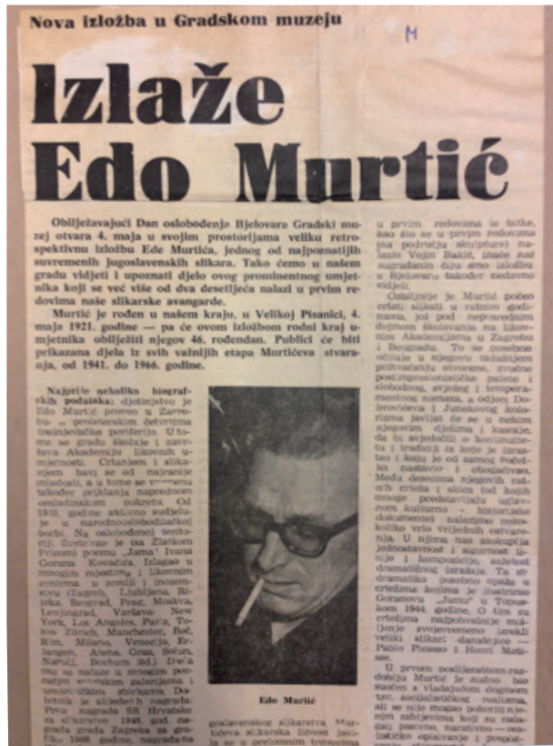
Slika 3. Željko Sabol, Izlaže Edo Murtić, Bjelovarski list , 27. travnja 1967. Zagreb, Arhiv za likovne umjetnosti Hrvatske akademije znanosti i umjetnosti, hemeroteka.

Uzbuđenje vezano za izložbu 1967. godine već svjedoči o Murtićevu ugledu u rodnoj sredini pa ne čudi – da je desetljećima poslije – odabran za Počasnoga građanina grada Bjelovara (2002.). Na drugoj samostalnoj izložbi u Bjelovaru (2004.) opet su se pomiješali javno i privatno: „[...] slučaj je htio da je svoj zadnji, 83. rođendan proslavio 2004. godine na svojoj drugoj i istodobno zadnjoj izložbi u istome gradu i na istom mjestu, dakle u Bjelovaru i njegovom Gradskom muzeju, na velikoj samostalnoj izložbi kojom je svojim djelima ispunio sve galerijske prostore Gradskega muzeja Bjelovar.“ (Medar, 2010., str. 5) No, s tom izložbom i smrću umjetnika nije završilo zanimanje zavičaja za njega i njegovu baštinu. Ponovno u povodu Dana oslobođenja (ali sada u Domovinskom ratu), i to Općine Velika Pisanica, priređena je 2010. godine svečanost (likovna kolonija i izložba) naslovljena Edo Murtić – povratak u zavičaj u povodu koje je objavljen istoimeni katalog, a velikoga sumještanina u Velikoj Pisanici sjećaju se redovito, godišnjom priredbom Dani Ede Murtića .