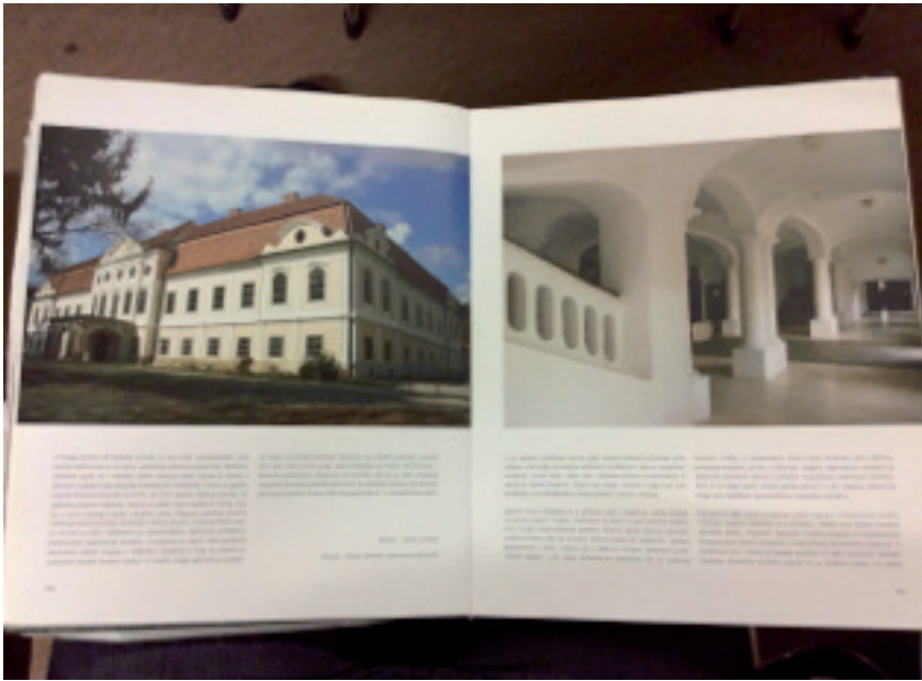
Slika 4. Marković, Vladimir, Dvorci 18. stoljeća – rafinirana upravna sjedišta u katalogu izložbe Slavonija, Baranja i Srijem: vrela europske civilizacije , II. svezak, 2009., str. 354-355.

kata sadržavaju niz malih intimnih soba i kabineta predvojima odvojenim od hodnika. Na taj je način ostvarena udobnost stanovanja karakteristična već za razdoblje rokoka. Isti rafinirani izraz kasnobarokne likovne kulture prepoznaje se i u arhitektonskoj plastici na vanjskim pročeljima dvorca, gdje umjesto pilastara prozorske zone odjeljuju uska polja obrubljena prutastom profilacijom koja se simetrično na gornjoj i donjoj strani meko uvija i razlistava biljnom ornamentikom ili zaključuje malom školjkom. Pilastri koji trebaju predočiti snagu koja nosi zamijenjeni su arhitektonskim ornamentalnim motivom rokoka. Zgrada dvorca smještena je u prostrani park u kojem je i velika kapela posvećena Svetom Trojstvu. Prethodno su dvorci iz prve polovice stoljeća imali mnogo manje parkovne površine.“ (Marković, 2009., str. 354-355). Za oživljavanje nastavnoga sata iz barokne arhitekture nedostaju samo završna profesorska provjera o jasnoći protumačenoga: „Imate li pitanja? Je li to bilo jasno?“, na koja bi ukročena publika poslušno klimala glavama u ritmu: „Ne, nema. Da, hvala!“, ne sluteći pritom da su upravo bili nakratko odvedeni pred najvažniju građevinu u predavačevu rodnom gradu.