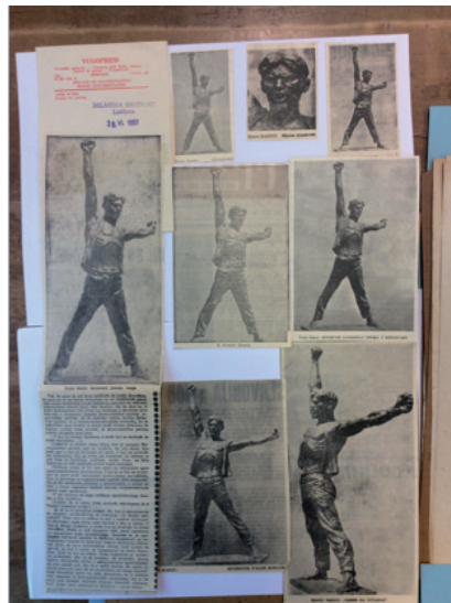
Slika 2. Skulptura Poziv na ustanak u suvremenom jugoslavenskom tisku (dio). Zagreb, Arhiv za likovne umjetnosti Hrvatske akademije znanosti i umjetnosti, hemeroteka.

spominjan, cijenjen i nagrađen (Ivančević, 2013., str. 39). Tonko Maroević u studiji o ranom razdoblju Vojina Bakića Obol oblini, volja za volumenom objašnjava kako je kipar pristupio spomeničkom izazovu u doba socrealizma: „Premda je obaveza neposredne komunikativnosti i ideološke provjere nužno vodila recepturi socrealizma (odnosno, akademizma s propagandnom funkcijom, eklekticizma naglašene monumentalnosti i heroizacije) neće biti nimalo teško ustvrditi kako se i u spomeničkoj plastici Bakić beziznimno ponašao kao kipar. Dovoljno je pogledati najraniji njegov spomenik, Poziv na ustanak (ili Spomenik strijeljanima , popularno Bjelovarac ), načinjen 1946-7, pa da ustanovimo kako je osnovni obris uvjerljiv i znakovit, kako stvara dinamičan odnos punine i šupljine, odnosno izrazito aktivira okolni prostor, a pritom je modelacija ne samo veristički odgovarajuća nego i organski gipka, ritmički usklašena.“ (Maroević, 2013., str. 111, 113) Reprodukција spomenika Poziv na ustanak objavljena je desetke puta u suvremenom dnevnom tisku [sl. 2], no često s različitim nazivima: Poziv na ustanak , Spomenik narodnoga ustanka , Borac , Spomenik palim borcima , Žrtva fašizma , Ustanak , Bjelovarac , Spomenik strijeljanima u Bjelovaru . 13