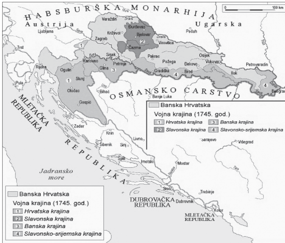
Sl. 1. Vojna krajina, izvor: http://www.enciklopedija.hr/natuknica.aspx?id=36410

kulturne tradicije, običaji, sjećanja, simboli, aktivno identificiranje s nacionalnom državom. Uvjet nastanka nacionalnog identiteta je pokušaj političke elite da utječe na snažno identificiranje s nacionalnom državom i želja stanovništva za kolektivnom povezanošću. Sam nacionalni identitet nastaje procesom unutarnje povezanosti i vanjskog definiranja granica stvarajući vremenski kontinuitet svoje jezgre utemeljene na zajedničkoj kulturi, povijesnim sjećanjima i mitovima, zajedničkom teritoriju i zakonskim pravima. Ali Podgorci nisu imali svoju zajedničku nacionalnu državu. Svoja uvjerenja oblikovana u mi definirana prema pripadnicima ne-mi grupe u kontekstu povijesnih događanja potvrđuje treći kôd nacionalnog identiteta po tipologiji Samuela Noaha Eisenstadta i Bernarda Giesena koji kolektivni identitet oblikuje na osnovi svetoga . 21 Tumačimo to