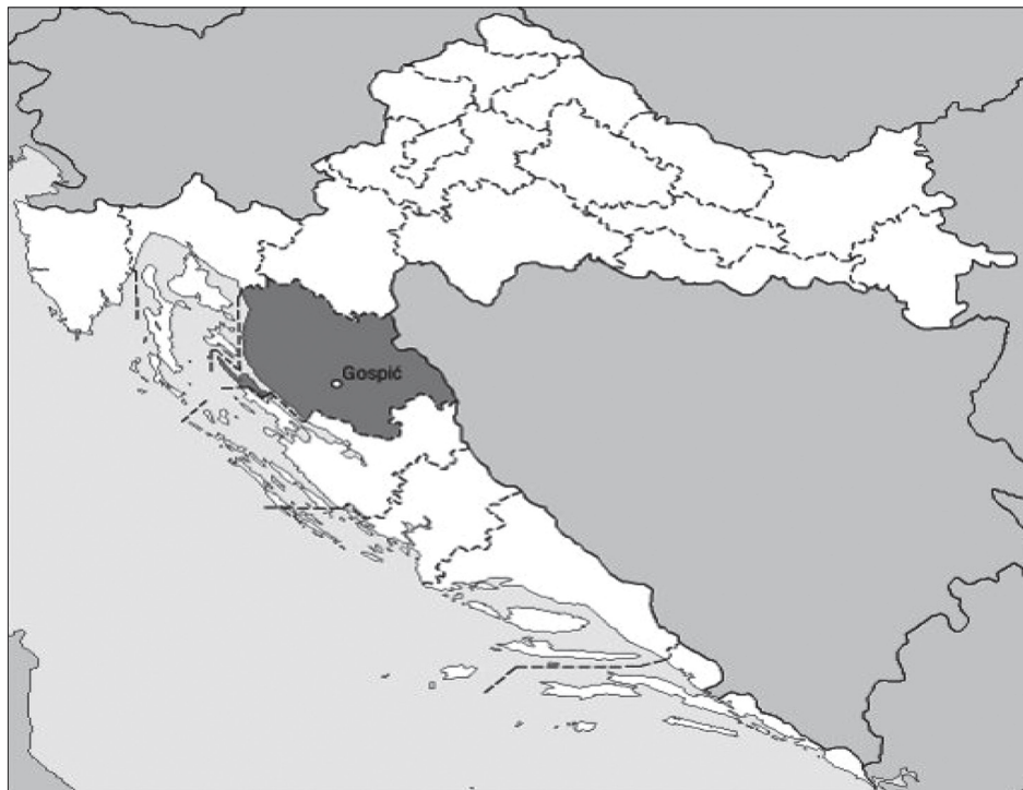
Sl. 2. Ličko-senjska županija, 26

Redoviti lokalni izbori na području cijele zemlje (ne računajući prijevremene) dosad su održani 1990., 1993., 1997., 2001., 2005., 2009. i 2013. godine. Prvi višestranački demokratski izbori na lokalnoj razini održani su istodobno s parlamentarnima u travnju i svibnju 1990., i to prema odredbama istog zakona. 27 Nakon donošenja novog Ustava 1990. i