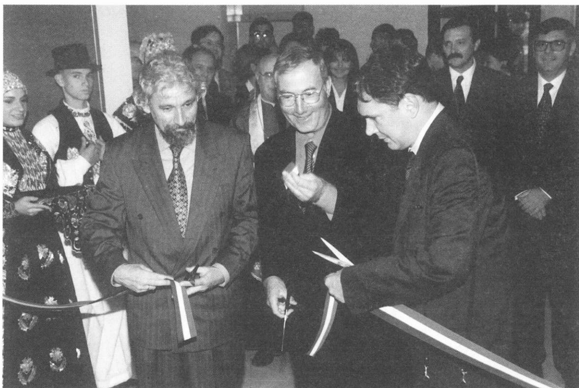
SLIKA 6. Svečano presijecanje vrpce

samo za osječko Sveučilište već i za grad Osijek, za Županiju, za cijelu državu Hrvatsku i za cijeli hrvatski narod. U jednoj maloj zemlji, u jednom malom narodu osnutak četvrtog medicinskog fakulteta predstavlja i znak stupnja razvoja tog naroda, njegovog akademskog razvoja, razvoja njegove znanosti i njegovog zdravstva također."