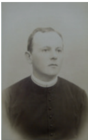
Slika 3. Rudlof Vimer, dekan Bogoslovnog fakulteta 1902.

Prorektorom Sveučilišta bio je akademske godine 1901./1902., a za akademsku godinu 1902./1903. biran je za dekana Bogoslovnog fakulteta u Zagrebu, 34 kada ga nadbiskup dr. Juraj Posilović imenuje i počasnim prisjednikom Nadbiskupskog duhovnog stola. Potom je bio prodekan za akademsku godinu 1903./1904. 35 Ponovno je biran za dekana akademske godine 1906./1907. i prodekana 1907./1908. godine. 36