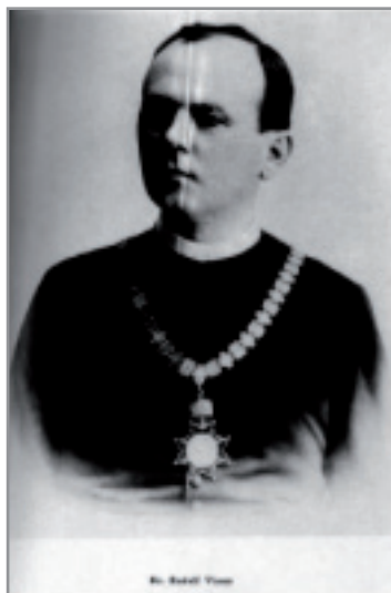
Slika 1. Rudolf Vimer, rektor Zagrebačkog sveučilišta 1900.

(* Bjelovar, 21. III. 1863. – † Zagreb, 28. X. 1933.)