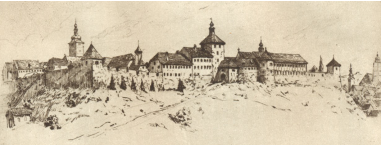
8. Branko Šenoa, Idealna rekonstrukcija južne fronte Gradeca potkraj 18. stoljeća, prema naputcima Gjuro Szabe (GJURO SZABO, Stari Zagreb , Zagreb, 1942., A) Branko Šenoa, Ideal reconstruction of the south front of Gradec, end of 18th century, according to Gjuro Szabo's instructions (GJURO SZABO, Stari Zagreb , Zagreb, 1942, A)

dimenzijama i obrisom predstavljati atraktivni dio korone južne strane Gornjega grada.