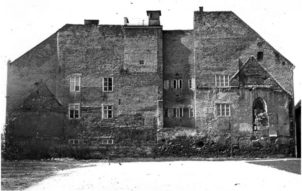
4. Istočni zid zgrade Hidrometeorološkog i Geofizičkog zavoda s obrisom kapucinske crkve, očuvanim gotičkim prozorom i kompozicijom spolija unutar prozora (desno) te obris bivšeg kapucinskog samostana (lijevo) East wall of the Meteorological and Hydrological Service building with the outline of the Capuchin church, a preserved Gothic window and a composition of spolia inside it (right) and the outline of the former Capuchin monastery (left)