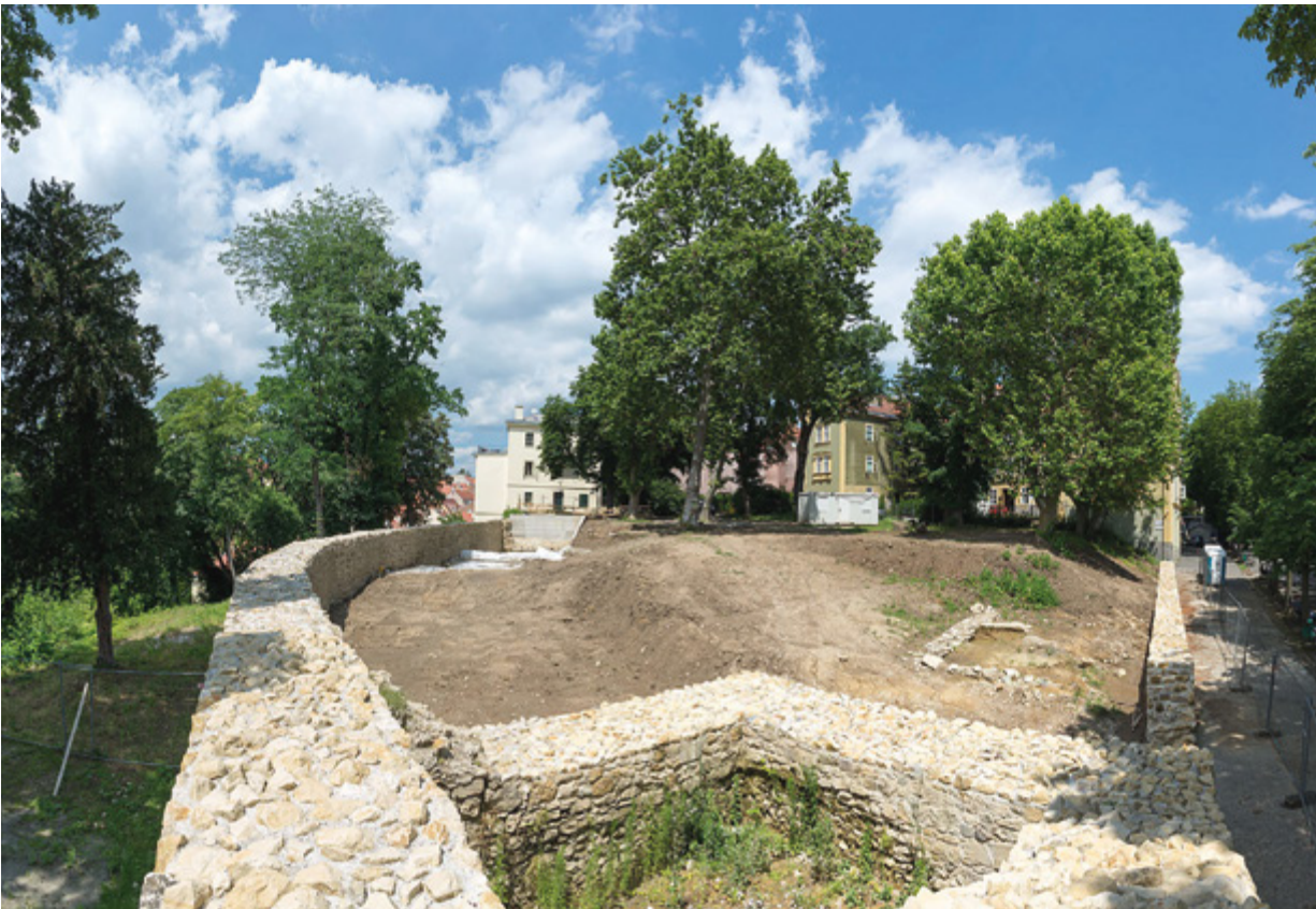
14. Situacija Parka Grič; konzervirani i restaurirani dijelovi gradskog zida i jugozapadna kula s najnovijim nalazom novovjekih arhitektonskih struktura (fototeka HRZ-a, snimio Lj. Gamulin, 2016.) Situation of Grič Park; conserved and restored portions of the city walls and southwest tower with the most recent find of early-modern architectural structures (Croatian Conservation Institute Photo Archive, photo by Lj. Gamulin, 2016)

uvijek i svagda bitna za formu. Zahtjev za rekonstrukcijom, odnosno faksimilnom metodom, proizašao je iz revalorizacije sklopa pošto je bio srušen. Nije ispitano smisao rekonstrukcije sklopa koji je od početka 19. stoljeća bio podvrgnut postojanom prepravljaju, da bi se u prvoj polovici 20. stoljeća postupno pretvarao u slum i najvjerojatnije zbog toga bio uklonjen. Štoviše, pridana mu je važnosti spomenika. Nije potaknuto ni pitanje, može li novogradnja određena takvim zahtjevima zadovoljiti funkciju, ma kakva ona bila. Očekujući od novogradnje restituciju sklopa i ujedno južne fronte narušene rušenjem, prednost je umjesto životu i inovaciji dana sceni i kulisi. Odnosom prema tzv. Vranicianijevoj poljani zadugo je inauguriran scenografski pristup.