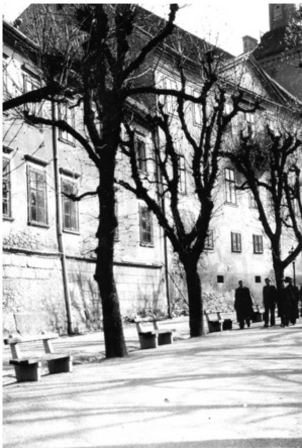
10. Pročelje sklopa „kuća Hellenbach“ sa Strossmayerova šetališta, 1940.; drugi kat nadograđen je 1836., a balkon i zabat izvedeni su 1862.

Front of the 'Hellenbach house' complex from the Strossmayer Promenade, 1940; the second floor was added in 1836, the balcony and pediment in 1862