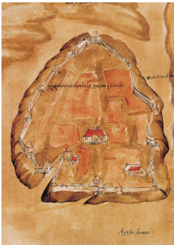
6. Nicolò Angielini (atr.), Gradec, detalj topografskog prikaza Zagreba, 1570-ih Izvorno stanje južne osnovice Gradeca prije gradnje kapucinskog samostana i pavlinske kurije. Kontinuirani pojas bedema s dvije četverouglaste kule na krajevima, kulom Dverce, Poljskim vratašcima i polukružnom kulom između njih te jugoistočna kula. Iza jugozapadnog dijela zida krovovi samostana ženskog dominikanskog reda (osnovanoga poslije 1477.) Nicolò Angielini (attrib.), Gradec, detail of a topographic map of Zagreb, 1570s. Original situation of the south front of Gradec prior to the construction of the Capuchin monastery and the Pauline manor. The continued stretch of walls with two rectangular towers at each end, Dverce Tower and Porta campestris (Field Gate), a semicircular tower in between, and the southwest tower. Visible behind the southwest portion of the walls is the roof of the Dominican convent (est. after 1477)

stoji bojazan u kompoziciji s praznom parcelom palače Hellenbach. Jedino je to historijski opravdano.“ Horvat i Prelog inzistiraju na izgradnji na cijeloj parceli, ali s odmjerenim odnosom prema Lotrščaku. Gorenc ponavlja: „Linija bedema i bedem su prvi uvjet i prva vrijednost. Postavlja se pitanje rješavanja reznjeva između Lotrščaka i nove zgrade...“ Sastanak je završen bez zaključka (sl. 6 i 7).