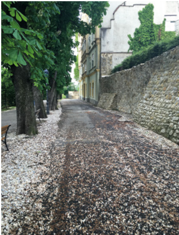
15. Saniran i rekonstruiran bedem na Strossmayerovu šetalištu

Recovered and reconstructed walls on the Strossmayer Promenade