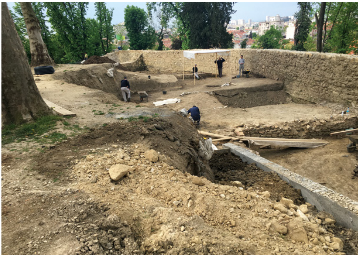
13. Arheološka istraživanja u parku Grič 2015. Archaeological excavations in Grič Park, 2015

novoga i staroga“, postavljeno na početku, moglo bi se odgovoriti, da je Šegvić u danim okolnostima, pod prisilom zadanih uvjeta i teretom naslijeđenih (i usvojenih) sudova, učinio najbolje što je mogao – štedeći samodostojanstvo. U nizu njegovih „bliskih susreta“ s povijesnom sredinom, kad je bio u skladu sa svojim bićem, ovom projektu ne pripada visoko mjesto.