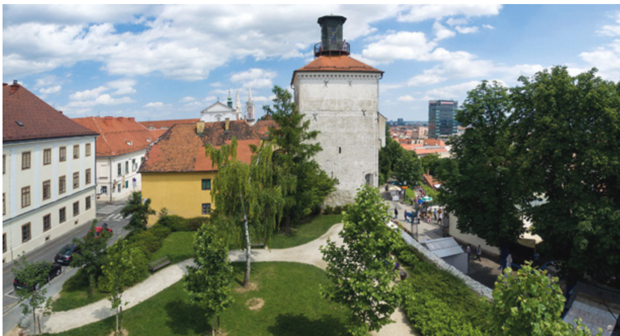
12. Park Bele IV. (fototeka HRZ-a, snimio Lj. Gamulin, 2016.)

Bela IV Park (Croatian Conservation Institute Photo Archive, photo by Lj. Gamulin, 2016)