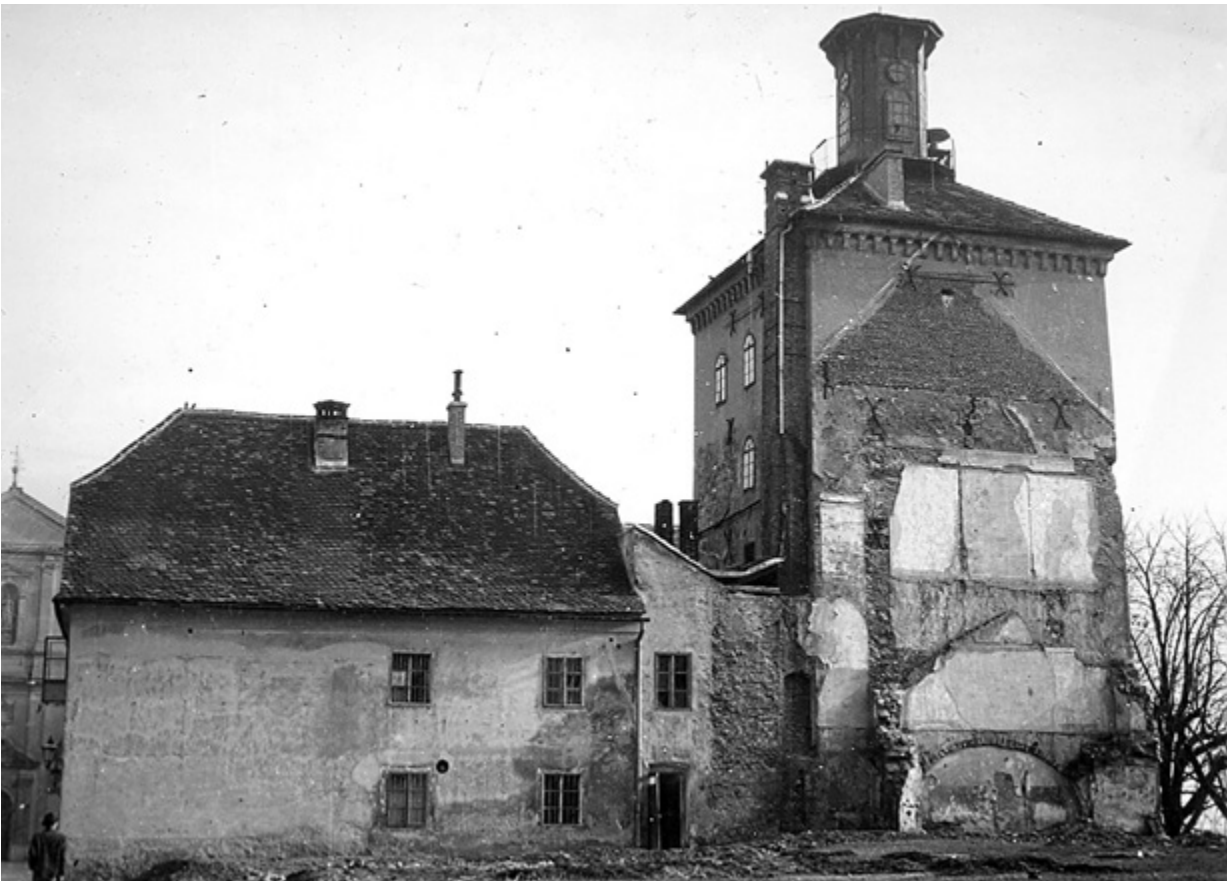
5. Kula Dverce/Lotrščak s obrisom bivše pavlinske kurije (kuće Hellenbach), kuća Čučić-Jelačić, Vranicanijeva 1-Katarinski trg 1 i dogradnja između nje i kule (fototeka MGZ-a 4898, snimila M. Fabijanić Orel, 1948.)

Dverce/Lotrščak Tower with the outline of the former Pauline manor (the Hellenbach house), the Čučić-Jelačić house, 1 Vranicani St. - 1 St. Catherine Sq., and a later addition between it and the tower (Zagreb City Museum Photo Archive, 4898, photo by M. Fabijanić Orel, 1948)