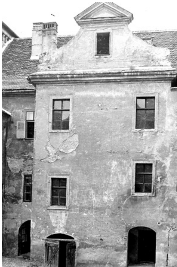
11. Središnji rizalit na sjevernom, dvorišnom pročelju kuće Hellenbach, 1940. (fototeka MGZ-a, 13448)

Ipak, u formulacijama propozicija za novogradnju hotela, čime se pozvani stručnjaci bave u pojedinačnim mišljenjima, nestali sklop valorizira se kao spomenik koji treba rekreirati: novogradnjom ponoviti njegovu formu, strukturu i volumen. Tako se Šeper zalaže za „faksimile porušениh zgrada“, Mohorovićić želi da novo bude „što sličnije starom“, a Magaš da to novo razvija i nadopunjava