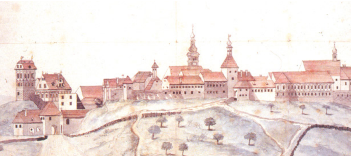
7. Ludovik Bužan, Pogled na južnu osnovicu Gradeca, 1792. Situacija poslije ukinuća pavlinskog reda (1786.) i raspuštanja kapucinskog samostana (1788.), a prije adaptacije sklopa. Kuriya i samostan tvore kompaktnu cjelinu; između nje i jugozapadne kule jedini dio bedema bez nadogradnje, iza njega, u drugom planu, kapucinska crkva Blažene Djevice Marije

Ludovik Bužan, View of the south front of Gradec, 1792. Situation after the Pauline Order was disbanded (1786) and the monastery abandoned (1788) and prior to the adaptation of the complex. The manor and monastery make up a compact ensemble; between it and the southwest tower is the only portion of the walls without later erections; behind it, in the background, is the Capuchin church of the Blessed Virgin Mary