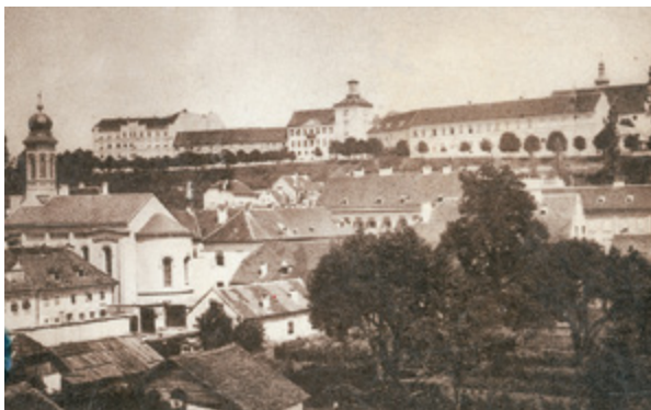
9. Pogled na Južnu promenu i tzv. Jelačićeve kuće, 1864. Situacija prije dogradnje gimnazije (1872. – 1874.) View of the south promenade and the so-called Jelačić's houses, 1864. Situation before the grammar school was built (1872/74)