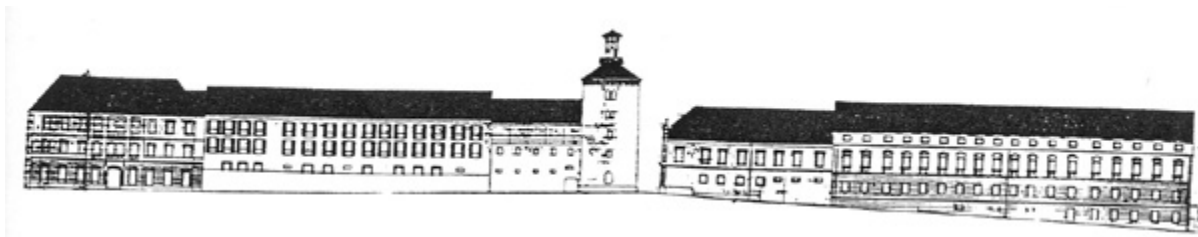
1. Neven Šegvić i Ana Marija Jelinčić, Prijedlog rekonstrukcije cijele južne fronte Gornjega grada s novim hotelom, 1969./70. Uklanjanjem katova na jugozapadnom i jugoistočnom kraju kontura je ujednačena (ČIP, 1970., 207.) Neven Šegvić and Ana Marija Jelinčić, Proposal for the reconstruction of the Upper Town south front with the new hotel, 1969/70. By removing floors at the southwest and southeast ends, the contour was levelled (Čovjek i prostor, 1970, 207)