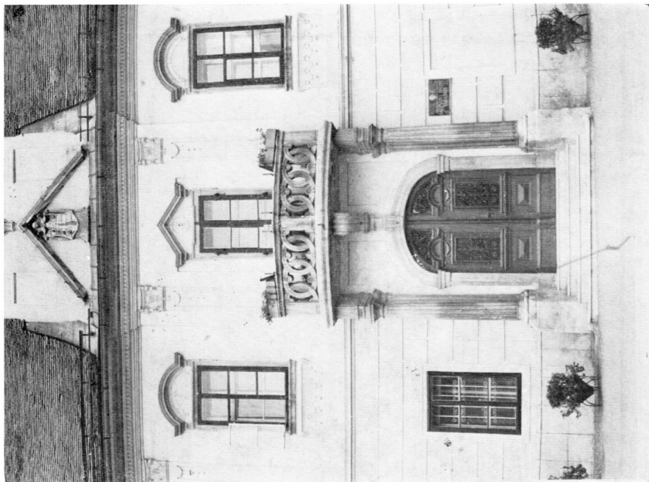
9. Portal balkon i gradski grb varaždinske Vijećnice (Leopold Wietter, 1793. godine)