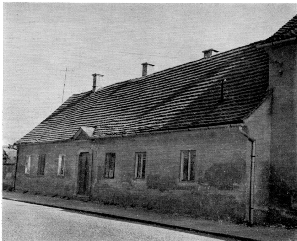
13. Gradski hospital iz 1839. u Prešernovoj ulici