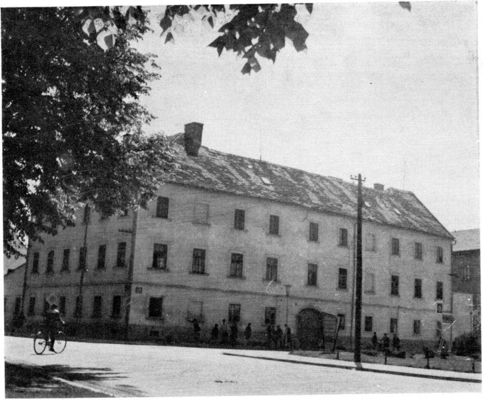
14. Zgrada prve bolnice u Varaždinu 1859 — 1866 (Fulir)