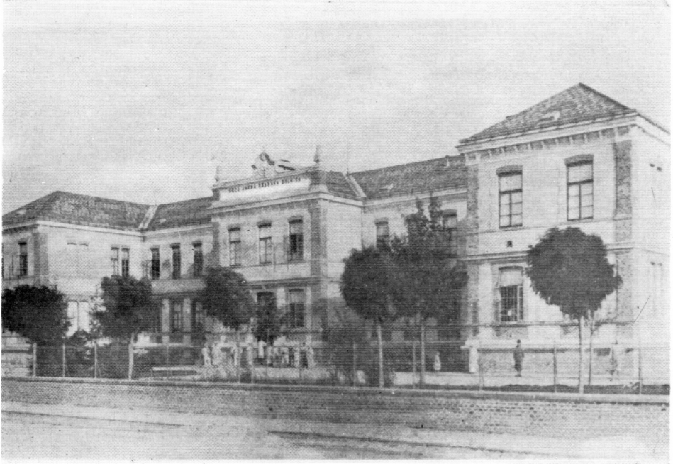
16. Javna gradska bolnica 1898.