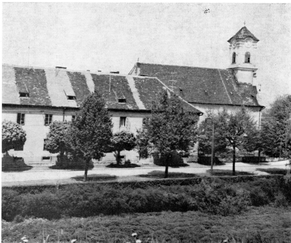
12. Gradski hospital iz 1776. — »Bürgerspital«