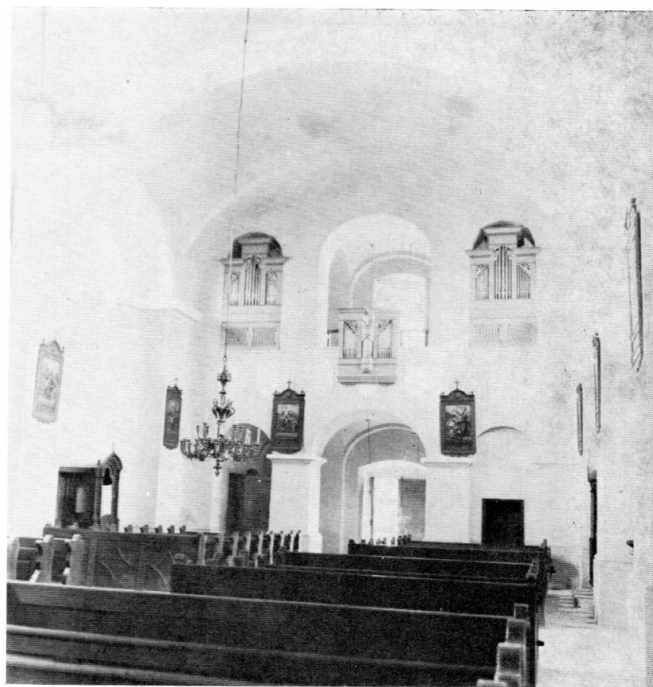
29. Drnje, orgulje Ignaca Pettera (1851)