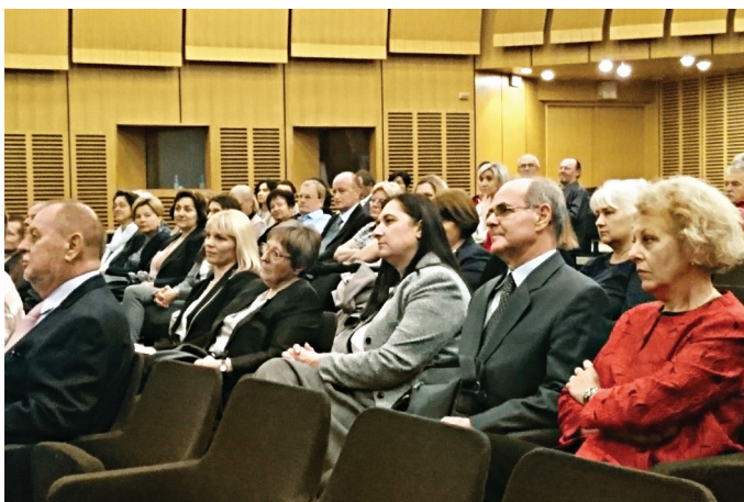
Sudionici skupa

HZN je povodom Svjetskog dana norma organizirao stručni skup o ulozi normizacije u kreiranju pametnih gradova. Na skupu su se okupili predsjednici tehničkih odbora HZN-a, predstavnici tijela državne uprave, članovi