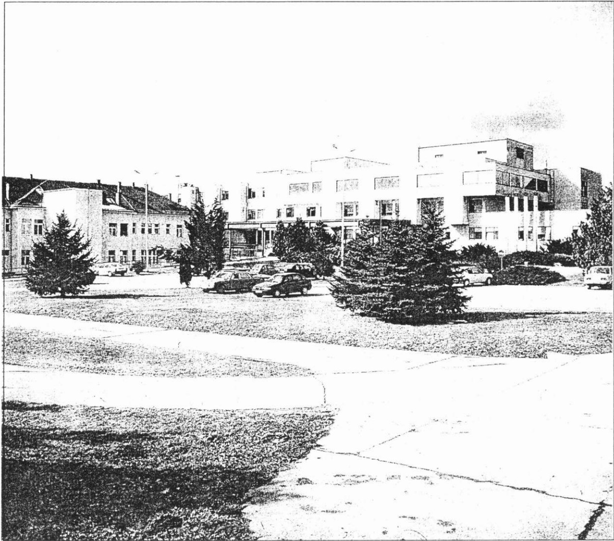
SLIKA 4. Novi dio požeške bolnice dograđen 1981. godine