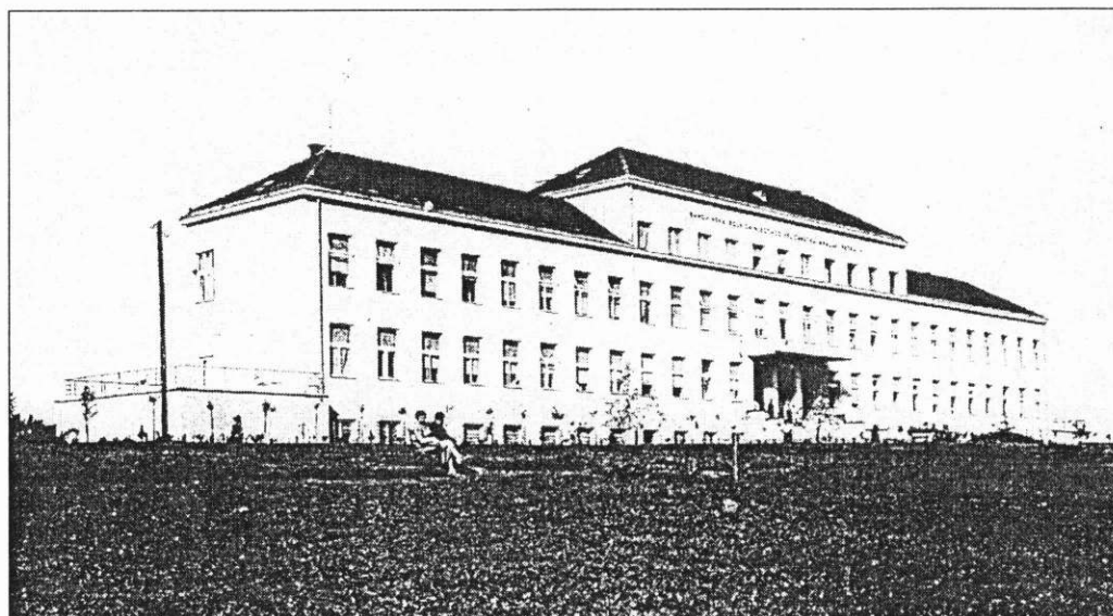
SLIKA 3. Požeška bolnica iz 1936. godine