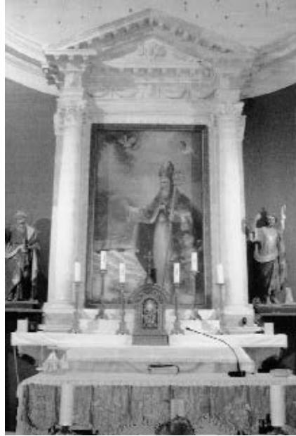
Glavni oltar iz crkve sv. Nikole u Čilipima (izvorno u dubrovačkoj dominikanskoj crkvi),

vac da se tu podigne/popravi oltar i postavi oltarna pala Gospe od Karmena sa sv. Jakovom, sv. Ivanom, sv. Pavlom i sv. Jelenom. 28 Odredio je da se na tom oltaru govore mise za njegovu dušu, dušu njegove supruge Jelene i njegovih pokojnih koje je poimence naveo. 29 Danas se taj kasnorenesansni oltar nalazi u prezbiteriju župne crkve sv. Nikole u Čilipima. Oltar je prilikom obnove crkve sv. Dominika 1883. prodan kako bi se namaknula sredstva za obnovu i njezino novo uređenje. Oltar iz dominikanske crkve najvjerojatnije je prvotno bio oltar sv. Pavla. Nastao je u istoj radionici u kojoj je izrađen i oltar obitelji Pucić na kojemu se nalazila Tizianova oltarna pala. Na bazama stupova ovih oltara nalaze se grbovi. Na bazi čilipskog oltara s lijeve su strane grbovi obitelji Brajković (Braichi/Brajki), kao i na fasadi kuće broj 5 u Palmotićevoj ulici. Drugi grb, koji na prvi pogled slič