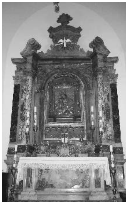
Oltar Pomoćnice Kršćana u crkvi bl. Gracije na Mulu (izvorno oltar sv. Dominika iz dubrovačke dominikanske crkve)

grbu pučanske obitelji Vodopić, nešto je drugačiji. 30 Možda se radi o specifičnom grbu Jaketine grane. 31 U gornjem polju grba nalaze se osmerokraka zvijezda i polmjesec, u donjem polju, odijeljenom kosom gredom, nema ničega. Iznad grba, vertikalno ispod vizira, isklesan je mač, stiliziran poput mača na grbu Palmotića i Crijevića. Mač ima i obiteljsko objašnjenje. Možda najstarija potvrđena veza roda Palmotićevidih s kulturnom baštinom jest i vijest kako je hrvatsko-ugarski kralj Matijaš Korvin poslao mač dubrovačkom knezu po Dživu Palmotiću. Vjerojatno se radi o maču koji se čuva u zbirci oružja bečkoga Muzeja za povijest umjetnosti. 32 Smatramo kako se radi o varijanti grba Palmotića, a njegova kombinacija