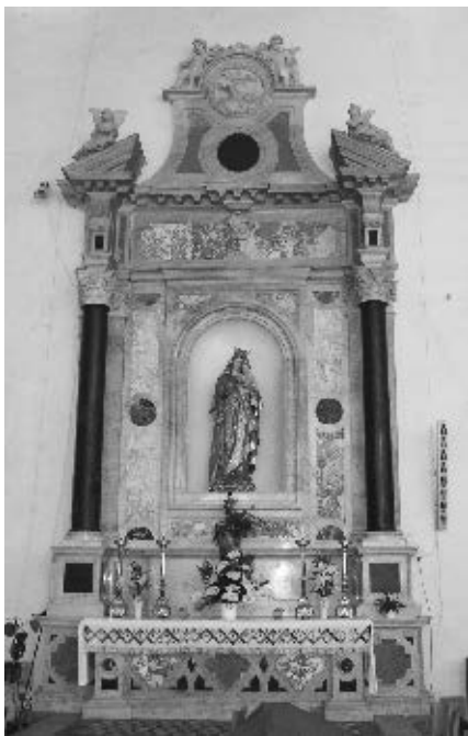
Oltar Gospe od Rozarija u dubrovačkoj dominikanskoj crkvi (vjerojatno Bilinićeva radionica), Split, XIX. st.