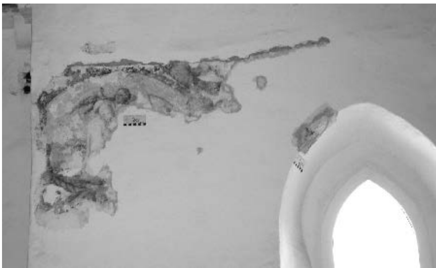
Ulomak baroknog fresko-oslika iz stare knjižnice dubrovačkog dominikanskog samostana, XVII. st.

Dana 27. svibnja 1806. francuske trupe su u poslijepodnevim satima okupirale samostan i to: najveći dio dormitorija, ćelija, novicijat i knjižnicu, a redovnicima su ostavili samo pet soba. Tada je francuska soldateska uništila i otuđila najveći broj rukopisa pohranjenih pod ključem na stalcima i u ormarima, a u isto je vrijeme uništen interijer ove važne knjižnice, koja potom biva pregrađena za vojničke potrebe. Sve su redovničke ćelije na drugome katu demolirane. 6