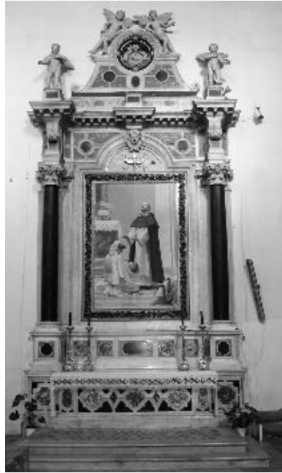
Oltar sv. Dominika sa oltarnom palom Vlaha Bukovca

1753. popravljen je kip sv. Vinka. 41 Uokolo kipa očito su se nalazile slike jer su 1755. isplaćena slikaru Giovanniju Beppu za popravak slika sv. Vinka Fererskog i za pozlatu njihovih okvira četiri dukata i 22 groša. 42 Oltar je 1761., kada ga je izradio majstor Nikola kožar, dobio kožni predoltarnik. 43 Kapetan Antun Grego je 1762. za oltar u Mlecima za 22 mletačka dukata nabavio srebrne kanonske ploče. 44 Majstoru Giovanniju Beppu dva puta je plaćano za osvježenje niše i kipa sv. Vinka, kao i za izradu nacrtu svetohraništa za ovaj oltar. 45 Svetohranište je bilo pozlačeno 1789., a »palu portante« popravljao je 1791. dominkanac fra. Bruni. 46 Ta je pala poslije uklanjanja oltara očito bila stradala. Kip sv. Vinka sada se nalazi izložen u crkvenoj lađi na kamenom nosaču. Poslije prodaje mramornog baroknog oltara, kult sv. Vinka je u Dubrovniku polako gasnuo.