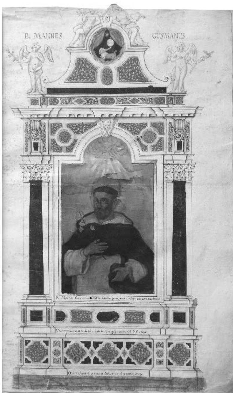
Arhiv dominikanskog samostana u Dubrovniku, Serafin Marija Crijević: Viginti supra centum Sanctorum, Beatorum, ac Venerabilim Fratrum Ordinis Praedicatorum Chronologico ordine digeste Imagines , str. 5.: prikaz bl. Manesa Guzmana (likovni predložak za oltar sv. Dominika)