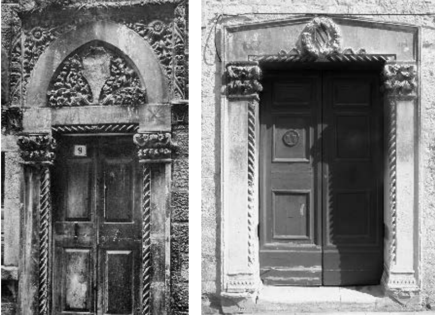
Portali na kući Paparčić u Korčuli i na kući Nassis u Zadru

koji ima rijetku odliku za ranorenesansnu arhitekturu. Po sredini je viši nego na krajevima te ima trokutasti oblik plitkog zabata, odnosno peterostrani obris. Po sredini je istaknut vijenac složen u krug, spleten od listova i plodova, čini se hrasta, kruške, česmine i vinove loze. U krugu je grb s koso položenim gredama, heraldičkim znakom obitelji Nassis.