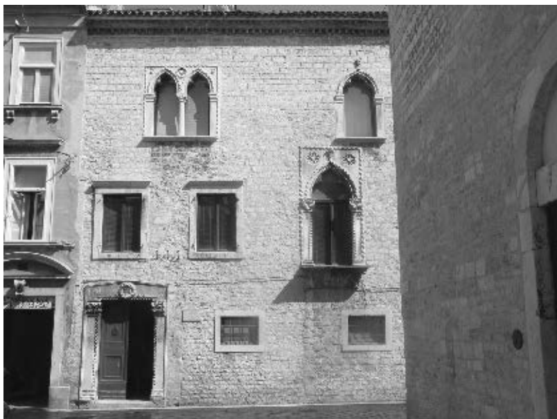
Pročelje kuće Nassis u Zadru