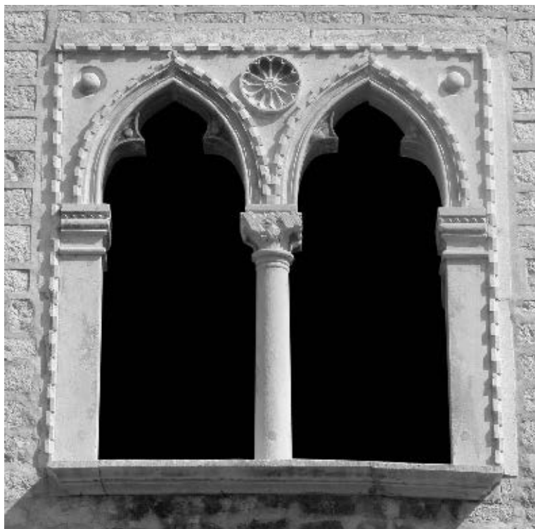
Bifore na kući Nassis u Zadru