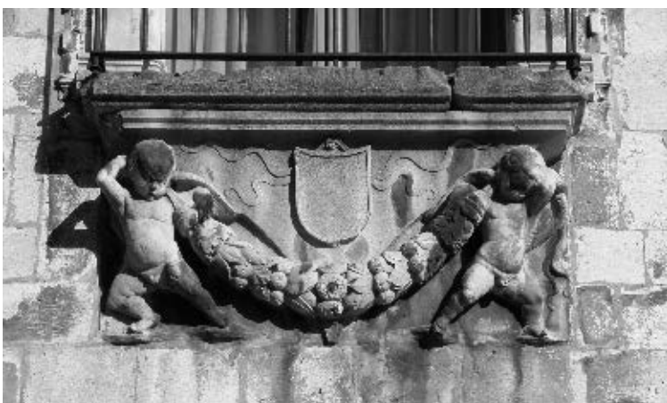
Menzole na kući Ghirardini i na kući Nassis

palače. Dapače, u pismu nadbiskupa Vallaressa izričito se spominju »glave životinja«. Međutim, navedeni primjeri s puttima svjedoče da su i oni bili popularni u Zadru, upravo karakteristični na više zgrada. Njihovu popularnost zacijelo treba pripisati drugoj inspiraciji, a ta je proizašla iz radionice Nikole Firentinca. Njegovim opusom u Zadru posebno se bavio Cvito Fisković te mu pripisao menzolu na balkonu palače Ghirardini i onu pod prozorom palače Pasini. Obje je datirao u osamdesete godine XV. stoljeća kao i slične putte na luneti portala na kući De Ponte i na grbu obitelji Detrico nad njihovom kapelom u crkvi sv. Frane u Zadru. Ta je građena oko 1480. godine. 14 Međutim, siguran podatak o boravku Nikole Firentinca u Zadru predstavlja tek ugovor iz 1485. godine kojim se Nikola obvezao Deodatu Venieru, opatu benediktinskog samostan sv. Krševana, izraditi šest pro-