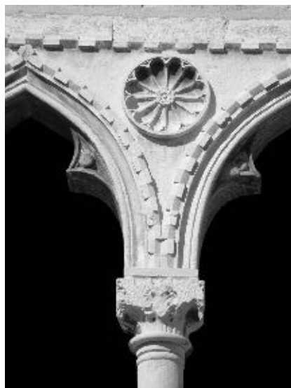
Patera na bifori