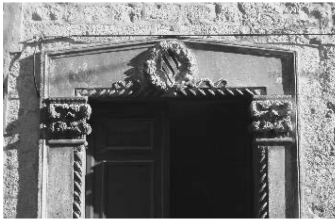
Kapiteli i nadvratnik portala u Korčuli i u Zadru