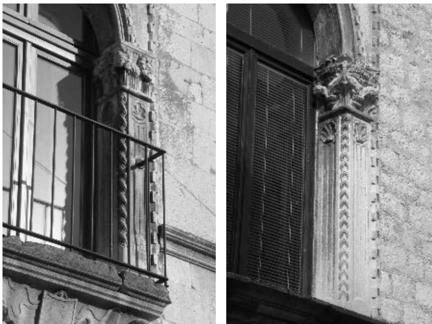
Fotografija doprozornika velike monofore na kući Ghirardini i na kući Nassis

slomljenog luka s trilobatom u podgledu. Tvore ih tri ploče. Lijeva i desna oblikuje nasuprotne polovice lijevoga i desnog luka, a srednja njima susjedne polovice. Vanjski obris ploča ocrtava spomenuti profil s gotičkim zupcima. Isti takav prati i obrise slomljenih lukova. Pod njima su uha koja grade trilobatnu formu arkada. U trokutu među njima je patera u obliku kruga s mrežištem od dvanaest isječaka. Posred pateri je maleni cvijet s pet latica. Na stijenama pateri očuvani su tragovi boje, crvene po obodu i modre u jedrima isječaka. U kutovima ploča uklesane su kugle, ukras srodan onome na arkadama katedrale u Šibeniku ili na monoforama palače Foskolo, također u Šibeniku, ali i ukrasima na prozorima brojnih zgrada u Veneciji. Malene kugle nalaze se i unutar spomenutih uha na trilobatima. Zanimljivo je da se sličan motiv nalazi među slijepim arkadama podno krovnog vijenca srednje lađe na katedrali u Korčuli, ili bifore pohranjene u tamošnjoj muzejskoj zbirci, te na monoforama sakristije u samostanu sv. Dominika, ili na trifori s pročelja Divone u Dubrovniku, klesarijama pripisanima Andrijićevoj radionici. Dakako, riječ je o motivu koji je, poput potonjih, opće mjesto kasnogotičke arhitektonske plastike na Jadranu, pa tako i u Dalmaciji. Tu ga susrećemo u Rabu, Zadru, Trogiru, Hvaru, Korčuli, Dubrovniku. Iz tog ambijenta preuzet je i često korišten u rječniku spomenute radionice.