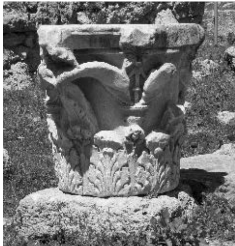
Kapitel na agori u Korintu

Pišući 1979. godine o obnovi kuće Nassis, upozorio sam na to da kapitule s njezine velike monofore valja dovoditi u vezu sa srodnima iz radionice Marka Andrijića. Karakteriziraju ih parovi delfina na oplošju kapitela. Delfini su sučelice postavljeni jedan prema drugome i svinuti u obliku položenog slova »S«. Oba su glavom prignuta nad kantaros pod njima, posudu iz koje piju vodu. Repovima su oba izdignuta visoko prema uglovima abaka. Među repovima je brid kalatosa, podno njega klasična profilacija s kimom na kojoj su ovulusi, a pod njima denti. Ispod delfina su listovi akantusa, a među njima spomenuti kantarosi.