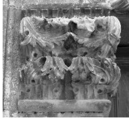
Kapiteli u klastru samostana sv. Dominika u Dubrovniku i na portalu palače Nassisi u Zadru

Pročeljem kuće Nassisi u Zadru dominira velika monofora s balkonskim istakom pod kojim je menzola s festonom koji nose dva krilata putta . Menzola je u donjem dijelu posve preklesana tako da nedostaje velik dio skulpture: donji dio grba, gotovo cijeli feston te s njim donji dijelovi tijela na likovima anđelčića. Znatno je oštećena i u gornjem dijelu s lijeve strane. Ondje nedostaje lijeva ruka i lice putta . Grb s heraldičkim znakom gotovo je sav sačuvan skupa s trakama koje vijore s jedne i druge strane. Krila na likovima anđela dobro su sačuvana te donekle ruke kojima nose feston konopom ovješene preko njihovih ramena. Očuvani su tek vrškovi festona. Glava anđela na desnoj strani menzole dobro je očuvana. Dječak ima pravilno lice s oblim obrazima i čelom. Tjeme i potiljak prekriva kosa koja se u pramenovima spušta prema vratu, ušima i čelu. Arkade su mekane, oble. Oči su fino modelirane s iscrtanim kopcima, plitko istaknutom rožnjačom i posred nje ukopanom zjenicom. To stvara dojam živahnog pogleda. Nos je prčast, s malo proširenim nosnicama. Usta su uska i stisnuta, a usne lijepo modelirane. Brada je također mekana. Ponad menzole je balkonska ploča obrubljena s klasičnom profilacijom.