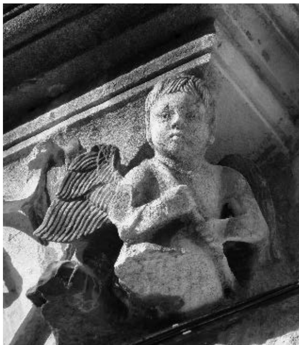
Putto na menzoli velike monofore na kući Nassis

slomljenu arkadu u vanjskom pravokutnom okviru. S lijeve i desne strane grade je jedna nad drugom dvije ploče što zajedno oblikuju zrcalno postavljene ornamente na bokovima arkade dok je srednja zapravo njezin ključni kamen. Vanjskim pravokutnim obrisom nastavlja se spomenuti profil s gotičkim zupcima, a unutrašnjima oblikuje trilobatna forma pod slomljenim lukom koji omeđuje također profil s gotičkim zupcima. Na njegovom vršku je akroterij u obliku razlistanog busena akantusa. Podno lijeve i desne strane arkade su tzv. uha koja u podgledu oblikuju trilobatnu formu. Plohu im prekriva plitki reljef u obliku cvijeta. Uz gornje kutove arkade uklesane su patere. Imaju kružni oblik s mrežicom od jedanaest isječaka, poput cvijeta s laticama.