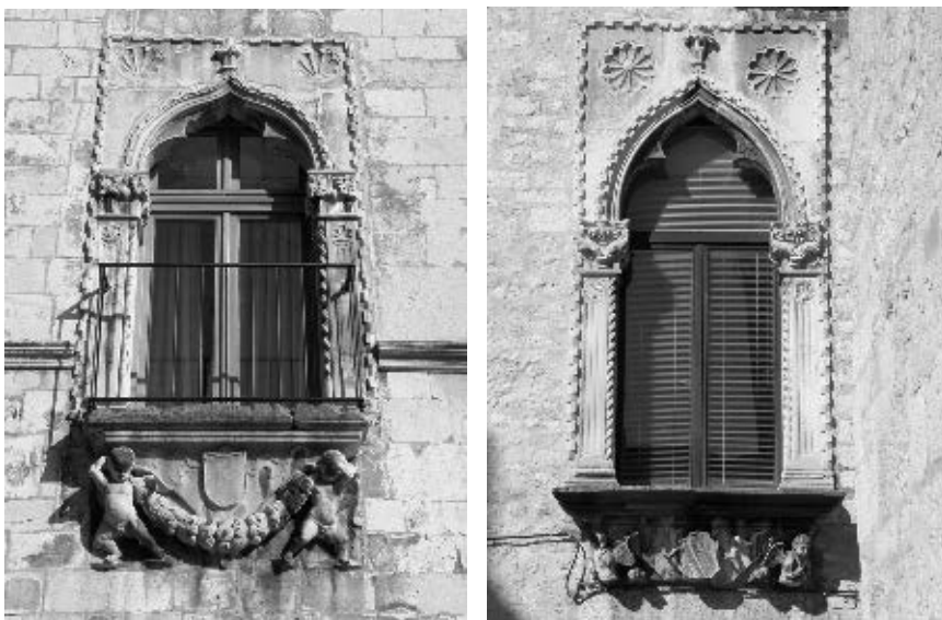
Monofora na kući Ghirardini i monofora na kući Nassis u Zadru

Dakle, tijekom osamdesetih i devedesetih godina XV. stoljeća, u Zadru su na zidovima više patricijskih zgrada izgrađene monofore s balkonskim istakom na menzoli, srodne onima na nadbiskupskoj palači. Postojale su na kući Soppe, na kući Pasini, na kući Cipriani, na kući Ghirardini, na kući Nassis, a možda i na još nekima. Međutim, sve se one razlikuju od Vallaressovih balkona po tome što pod menzolom nemaju donji prozor koji s gornjim čini arhitektonsku cjelinu okvira. 11 To je bio izuzetak uvjetovan prostornom strukturom biskupove palače. No, sam red što ga je tvorila velika monofora, ili trifora, s balkonskim istakom i menzola podno njega, oblikovao je specifičan slog s osobitom arhitektonskom plastikom. Rese je kasnogotički i ranorenesansni ornamenti, potonji osobito na menzoli. Za njih je C. Fisković napisao da su »... postali u Zadru uobičajeni ...«, zapravo »... tipični za zadarski gotičko-renesansni prozor ...«, odnosno »... češći arhitektonski motiv negoli u ostalim dalmatinskim gradovima ...«. 12