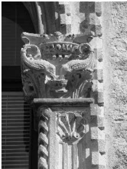
Kapiteli na ciboriju u Korčuli i na velikoj monofori u kući Nassis u Zadru

tu prema kantarosu i nos uronjen u vodu koju piju. Na većini ostalih delfini su glavom i nosom ispruženi prema kantarosu, srodni nekim primjerima u Padovi i Mantovi. 25