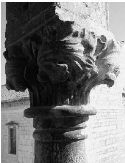
Kapitel na bifori