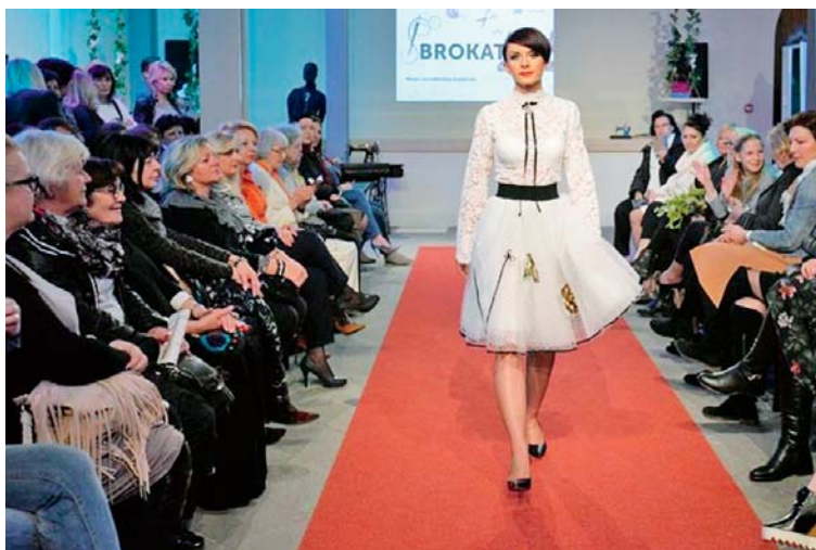
Sl.5 Mjeseca varaždinskog šnajderaja - zajednička revija radova varaždinskih kreatorica

Uz izložbu, tijekom četiri petka u palači Herzer održane su modne revije na kojima je devet varaždinskih kreatorica predstavilo svoje kolekcije