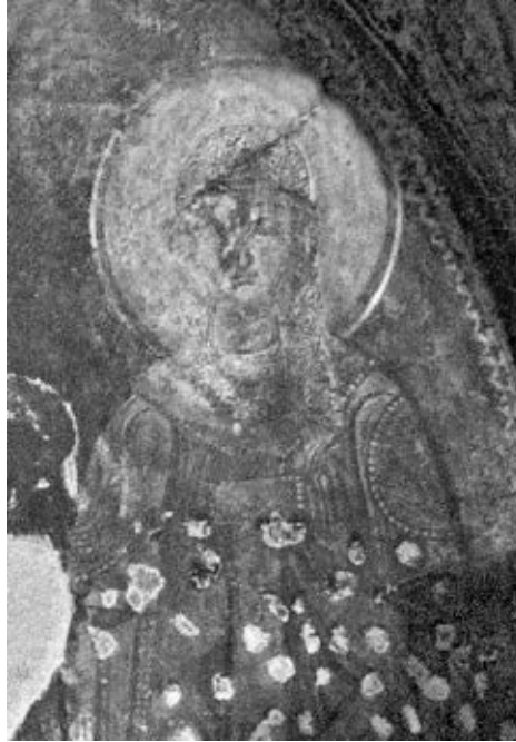
Sv. Barbara (detalj)

Smatram kako je ispravno desnu figuru na kotorskoj fresci povezati s ličnosti sv. Barbare. Kako je već rečeno, svetica na kotorskoj fresci u potpunosti poštuje i slijedi ikonografska pravila prikazivanja sv. Barbare, o čemu najjasnije svjedoči bijeli veo koji joj pokriva kosu, 34 te gesta desne ruke kojom pokazuje na svoja prsa. 35 Činjenica da je zajedničko prikazivanje sv. Katarine i sv. Barbare više svojstveno umjetnosti istočne nego zapadne crkve, gdje se sa sv. Katarinom češće prikazuje sv. Agata, 36 ne može se smatrati spornim za ovu identifikaciju, jer se treba uzeti u obzir i činjenica da je kult sv. Barbare bio znatno jači i rašireniji od kulta sv. Agate, te da je sv. Barbara, za razliku od sv. Agate, bila čašćena i u istočnoj crkvi, što nije zanemarivo kada je riječ o umjetnosti srednjovjekovnoga Kotora, mješovite sredine u kojoj su oba kršćanska kulta bila jednako jaka i jednako zastupljena. 37 Dakle, uz navedene argumente koji govore u prilog identifikaciji desne svetice sv. Barbarom, unatoč činjenici da nije sačuvan natpis koji bi je podržao i nesumnjivo dokazao, mišljenja sam kako je takva identifikacija vrlo prihvatljiva i vjerojatno točna. Tome treba dodati i dosad neuočenu poveznicu