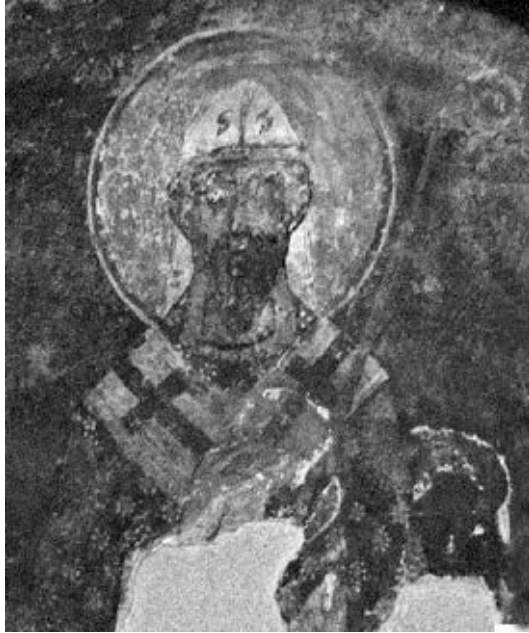
Sv. Ćiril Aleksandrijski (detalj)

koje se niz leđa spuštaju trake ili veo, čija se jedina dekoracija očituje u obrubu oker žute boje, traci iste boje koja ide od sredine čela preko glave i dijeli površinu kape na dva jednaka dijela, te dva simetrično postavljena latinična slova »S«. 42 Identificirajući središnju ličnost sv. Bazilijem Velikim na temelju uočenih analogija s figurom iz kripte San Vito Vecchio u Gravini, gdje je lik sv. Bazilija signiran, A. Skovran tu kapu nije uzela u razmatranje. 43 S druge strane, V. J. Đurić svoj prijedlog za identifikaciju sv. Silvestra temelji upravo na toj kapi argumentirajući svoj prijedlog identifikacije činjenicom da je u ikonografiji istočne crkve uobičajeno prikazivanje biskupa (episkopa) bez ikakvih pokrivala na glavama za razliku od zapadnih biskupa i papa koji su se prikazivali s mitrama. 44 Mišljenja sam da je takva argumentacija dovela do pogrešnog zaključka o pripadnosti prikazanoga svetog biskupa zapadnoj crkvi, što je, uz neprihvatljivo shvaćanje ornamenta