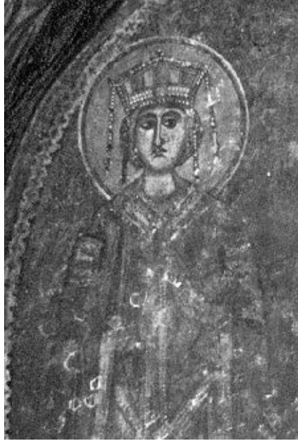
Sv. Katarina (detalj freske)

vena u svečanu, raskošnu odjeću – dugačku tamnoplavu haljinu uzduž koje se sredinom proteže široka traka tamnijega ružičastoga tona prekrivena gustim vegetabilnim ornamentom spiralnih lozica, imitacijom zlatoveza, koja je pri dnu obrubljena širokom svijetlom bordurom. Preko ramena ima kraći crveni plašt sa žutozlatnom bordurom s biserima, zakopčan okruglim brošem. Na glavi, preko široke, »napuhane« tamne kape ili marame nejasna tona prigušene boje, nosi peterostranu krunu bogato ukrašenu trostrukim nizom bisera i draguljima s koje se prema ramenima spuštaju perpendulije.