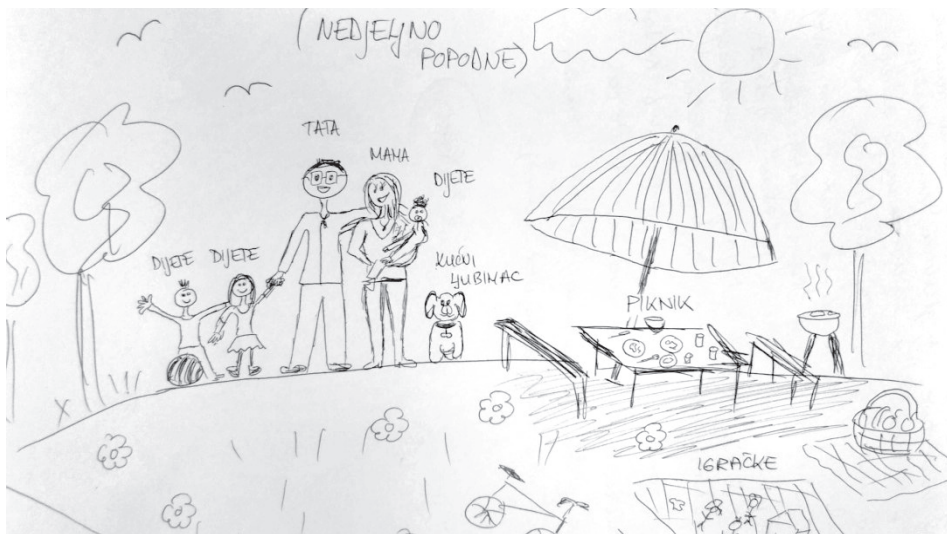
Slika 2. Primjer idealne obitelji

Temeljem ovih rezultata prihvaća se hipoteza H 1 , u kojoj se pretpostavilo da će više od polovice studenata pedagogije idealnu obitelj crtati dominantno kao zajednicu dvaju roditelja različitoga spola i najmanje dvoje djece različitoga spola 5 . Crtež koji bi mogao biti ogledni primjerak tipične reprezentacije idealne obitelji s obzirom na broj i spol prikazanih odraslih članova i djece vidljiv je na Slici 2, koja prikazuje majku, oca, troje djece i psa na idiličnome obiteljskom pikniku u sunčano nedjeljno poslijepodne. Ovakvi su rezultati sukladni istraživanjima poput onoga Gilby i Pedersona (1982, prema Ford i sur., 1996), Ford (1994) i Ford i sur. (1996), u kojima su ispitanici pod pojmom obitelji (doduše, ne idealne) najčešće podrazumijevali nuklearnu obitelj s roditeljima suprotnoga spola i njihovom djecom.