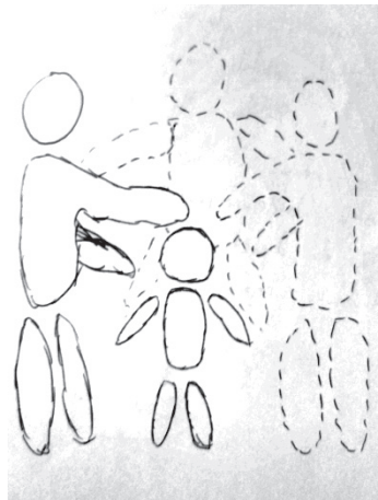
Slika 3. Prikaz idealne obitelji apstrahiran od svih pedagojski manje relevantnih obilježja

Ovaj student/ova studentica je dakle na crtežu punom crtom označio/označila minimum konstitutivnih dijelova pedagojske definicije obitelji, ali isto tako isprekidanom označio/označila potenciju, odnosno mogućnost da oko djeteta postoji i više odraslih/roditeljskih figura, čak i više od dvije (što se iščitalo iz toga što je ispod crteža pisalo "dijete Saša i roditelj Vanja + roditelj(i)"). Svi su likovi nacrtani bez bilo kakvih spolnih, statusnih ili kontekstualnih obilježja, ali je stajanjem u krug i pružanjem ruku jednih prema drugima simbolički prikazana srž obitelji, a to su zajedništvo, bliskost i briga jednih za druge.